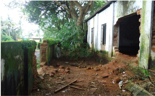
ചങ്ങനാശ്ശേരി ഗവ: ഹയർ സെക്കണ്ടറി സ്കൂൾ മതിലിന്റെ പൊതുവഴിയോട് ചേർന്നഭാഗം പൊളിഞ്ഞു കിടക്കുന്നത്

കണ്ണൂർ ജില്ലാപഞ്ചായത്തിന്റെ നിയന്ത്രണത്തിലുള്ള 71 സ്കൂളുകളിൽ 33 സ്കൂളുകൾക്ക് ഭാഗികമായി മാത്രമാണ് ചുറ്റുമതിൽ ഉള്ളത്. ചുറ്റുമതിൽ ഉള്ള 34 സ്കൂളുകളിൽ തന്നെ 15 സ്കൂളുകളുടെ ചുറ്റുമതിൽ തകർന്ന നിലയിലുമാണ്.