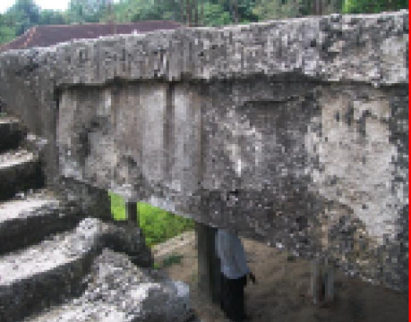
ബീമിൽ നിന്നും കോൺക്രീറ്റ് മിശ്രിതം

പെരിങ്ങാലം ഗവൺമെന്റ് ഹയർ സെക്കന്ററി സ്കൂൾ, കെട്ടിട സൗകര്യങ്ങളുടെ അപര്യാപ്തതമൂലം വീർപ്പുമുട്ടുകയാണ്. ഏതാനും ക്ലാസുകളും കമ്പ്യൂട്ടർ ലാബും പ്രവർത്തിക്കുന്നത് ആസ്ബസ്റ്റോസ് ഷീറ്റ് മേഞ്ഞ ആന്റി ഡിസാസ്റ്റർ ഷെൽറ്ററിലാണ്. സ്ഥലമില്ലാത്തതിനാൽ സ്കൂൾ ലാബോറട്ടറികൾ പോലും പ്രവർത്തിക്കാൻ കഴിയുന്നില്ല.