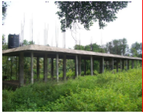
പൂർത്തിയാക്കാത്ത പെരിങ്ങാലം സ്കൂൾ കെട്ടിടം

കൊല്ലം ജില്ലാപഞ്ചായത്തിൽ സുനാമി പുനരധിവാസ പദ്ധതി (TRP) 2008-09 പ്രകാരം പണി ആരംഭിച്ച, സ്കൂൾ കെട്ടിടങ്ങളിൽ പെരിങ്ങാലം (മൺഭ്രോ തുരുത്ത്) ചെറിയഴീക്കൽ, കുഴിത്തുറ, അഴീക്കൽ (ആലപ്പാട്) എന്നീ ഗവൺമെന്റ് ഹയർ സെക്കന്ററി സ്കൂൾ കെട്ടിടങ്ങൾ പണി പൂർത്തിയാക്കാതെ പാർട്ട് ബില്ലുകൾ മാറി, കോൺട്രാക്ടർമാർ പണിയുപേക്ഷിച്ചു. നാലു സ്കൂളുകളും പിന്നാക്ക മേഖലയിലായിട്ടും പണി യഥാസമയം പൂർത്തീകരിക്കുന്നതിനോ നഷ്ടം ഉണ്ടാകാതെ നിയമാനുസൃതമായി പുന: ക്രമീകരിക്കുന്നതിനോ നിർവ്വഹണാധികാരികൾക്ക് കഴിഞ്ഞിട്ടില്ല. 2009 ൽ കരാർ വച്ചിട്ടുള്ള ഈ പ്രവൃത്തികൾ 31.03.10 ന് മുമ്പ് പൂർത്തീകരിക്കേണ്ടവയായിരുന്നു.