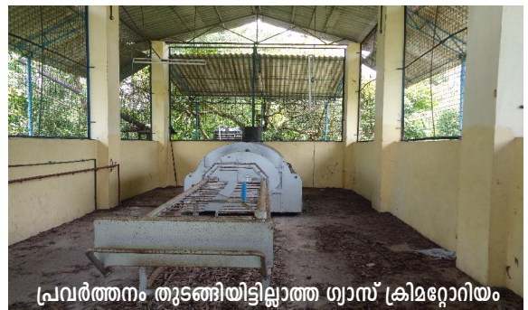
പ്രവർത്തനം തുടങ്ങിയിട്ടില്ലാത്ത ഗ്യാസ് ക്രിമറ്റോറിയം

ശ്മശാനത്തിന്റെ ഔദ്യോഗിക ഉദ്ഘാടനം 14.12.2008 ൽ നടന്നുവെങ്കിലും നാളിതുവരെ (ആഗസ്റ്റ് 2014) ക്രിമറ്റോറിയം ഉപയോഗിച്ചിട്ടില്ല. ഇത് സംബന്ധിച്ച ഓഡിറ്റ് അന്വേഷണത്തിന് (ഓഡിറ്റ് എൻക്വയറി നം. 27, തീയതി 25.8.12), ക്രിമറ്റോറിയം