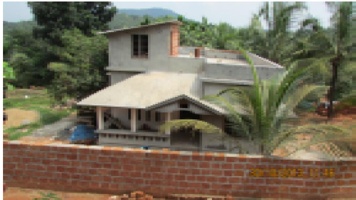
അനുവദനീയമായതിലും കൂടുതൽ വലിപ്പത്തിൽ നിർമ്മിച്ച വീടുകളിലൊന്ന്

തദ്ദേശസ്വയംഭരണ സ്ഥാപനങ്ങൾ നടപ്പാക്കുന്ന പദ്ധതികളിൽ നിശ്ചിത മാനദണ്ഡങ്ങൾ പ്രകാരം ഗുണഭോക്താക്കളെ മുൻഗണനാക്രമത്തിൽ തിരഞ്ഞെടുത്ത് നൽകുക എന്നത് ഗ്രാമസഭകളുടെ അധികാരമാണെന്ന് കേരള പഞ്ചായത്ത് രാജ് നിയമം സെക്ഷൻ 3എ(സി) യിൽ വ്യക്തമാക്കിയിട്ടുണ്ട്. തദ്ദേശസ്വയംഭരണ വകുപ്പിന്റെ 2/9/1998 ലെ ജി.ഒ.(പി) 189/98/തഭവ നമ്പർ ഉത്തരവിലും ഇക്കാര്യം വ്യക്തമാക്കുന്നുണ്ട്. ഗ്രാമപഞ്ചായത്ത് ഭരണസമിതി അംഗീകരിച്ച ഗുണഭോക്തൃ ലിസ്റ്റിൽ നിന്നാണ് ബ്ലോക്ക് പഞ്ചായത്ത് വ്യക്തിഗതാനുകൂല്യങ്ങൾ അനുവദിക്കേണ്ടത് എന്ന് ഗുണഭോക്തൃ തിരഞ്ഞെടുപ്പു സംബന്ധിച്ച ജി.ഒ.(പി).181/98/സി.എ.ഡി.നമ്പർ ഉത്തരവിൽ (തീയതി 2/9/98) വ്യക്തമാക്കിയിട്ടുണ്ട്.