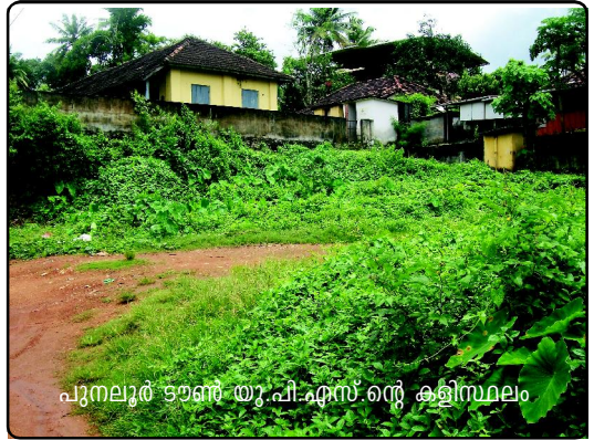
പുനലൂർ ടൗൺ യു.പി.എസ്.ന്റെ കളിസ്ഥലം

കൊല്ലം ജില്ലയിലെ പുനലൂർ നഗരസഭയിലെ ടൗൺ ഗവൺമെന്റ് എൽ.പി.സ്കൂളിന്റെ കെട്ടിടം നിൽക്കുന്ന പുരയിടത്തിന് ചുറ്റുമതിലുണ്ട്. കാടുമുടിയ നിലയിൽ തുടരുന്ന കളിസ്ഥലത്തിന്റെ നടുവിലൂടെ തദ്ദേശീയർ ഉപയോഗിക്കുന്ന രണ്ട് വഴികൾ രൂപപ്പെട്ടിട്ടുണ്ട്. ഒരു വഴി ഉണ്ടാക്കുന്നതിലേക്ക് കളിസ്ഥലത്തിന്റെ ഒരു വശത്തെ മതിൽ തകർത്തിരിക്കുന്നതായി പ്രാദേശിക പരിശോധനയിൽ ബോധ്യപ്പെട്ടു.