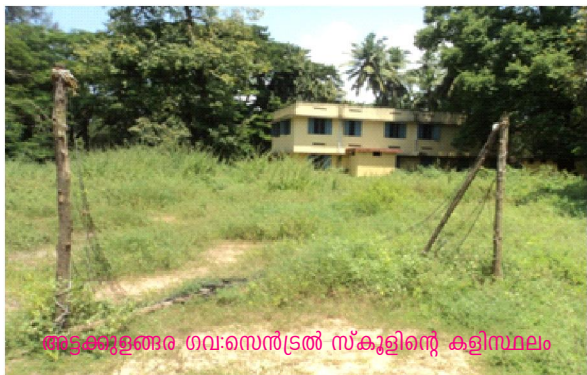
അടുക്കൂളങ്ങര ഗവ:സെന്റ്രൽ സ്കൂളിന്റെ കളിസ്ഥലം

തിരുവനന്തപുരം നഗരസഭയുടെ അധീനതയിലുള്ള മിക്ക സ്കൂളുകളിലും കളിസ്ഥലങ്ങൾ ഒരുക്കുന്നതിൽ 1959 ലെ കേരള വിദ്യാഭ്യാസ ചട്ടങ്ങളിലെ നിർദ്ദേശങ്ങൾ പാലിക്കപ്പെട്ടിട്ടില്ല. ചില സ്കൂളുകളിൽ കളിസ്ഥലങ്ങൾക്കാവശ്യമായ ഭൂമിയില്ല. കളിസ്ഥലങ്ങളുള്ള സ്കൂളുകളിൽ അവ ചുറ്റുമതിൽ കെട്ടി സംരക്ഷിച്ചിട്ടില്ല. പല സ്കൂളുകളിലും കളിസ്ഥലങ്ങൾ കാടുപിടിച്ച് ഉപയോഗശൂന്യമായ നിലയിലും ചിലയിടങ്ങളിൽ സ്കൂളിൽ നിന്നും അകലെയായും കളിസ്ഥലങ്ങൾ കാണാൻ കഴിഞ്ഞു.