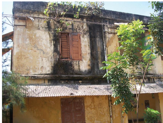
കൊല്ലം ജില്ല - ചെറിയഴീക്കൽ ഗവൺമെന്റ് ഹയർ സെക്കന്ററി സ്കൂളിന്റെ ജീർണ്ണാവസ്ഥയിലായ ലാബ് കെട്ടിടം

തിരുവനന്തപുരം ജില്ലയിലെ കിഴുവിലം ഗ്രാമപഞ്ചായത്തിലെ ഒരു സ്കൂളിലും സയൻസ് ലാബുകൾ കാര്യക്ഷമമല്ല. ഇവയ്ക്കായി പ്രത്യേക മുറിയും പ്രദർശന സംവിധാനങ്ങളുമില്ല. ലാബിനായി ലഭിച്ച വസ്തുക്കൾ അലമാരകളിൽ നിറച്ചിരിക്കുന്നു. രാസപരീക്ഷണങ്ങൾ നടത്തുന്നത് ക്ലാസ്സുകളിലാണ്.