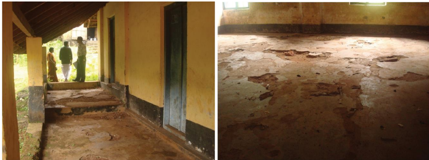
കൊടിയമ്മ ഗവ.യു.പി.സ്കൂൾ കെട്ടിടത്തിന്റെ പൊട്ടിപ്പൊളിഞ്ഞ തറ

കാസറഗോഡ് ജില്ലയിലെ കുന്ദള ഗ്രാമപഞ്ചായത്തിൽ 10 ഡിവിഷനുകളിലായി 250 കുട്ടികൾ പഠിക്കുന്ന കൊടിയമ്മ ഗവൺമെന്റ് യു.പി.സ്കൂളിലെ 2 കെട്ടിടങ്ങളുടെയും അവസ്ഥ ശോചനീയമാണ്. 2 ക്ലാസ്സുമുറികൾ പ്രവർത്തിക്കുന്ന കെട്ടിടത്തിന്റെയും ലൈബ്രറി, ലാബോറട്ടറി എന്നിവ പ്രവർത്തിക്കുന്ന കെട്ടിടത്തിന്റെയും നിലം പൊട്ടിപ്പൊളിഞ്ഞ് കുഴികളായി മാറിയിരിക്കുകയാണ്.