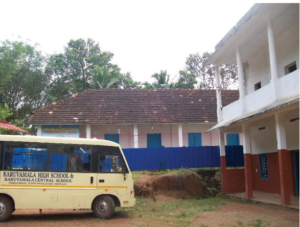
കരുവാമല ഹൈസ്കൂളിന്റെ വസ്തുവിൽ അനധികൃതമായി പ്രവർത്തിക്കുന്ന സി.ബി.എസ്.ഇ.സ്കൂൾ

കൊല്ലം ജില്ലയിലെ കുുന്നത്തൂർ ഗ്രാമപഞ്ചായത്ത് പരിധിയിൽ എയ്ഡഡ് സ്കൂളിന്റെ പുരയിടത്തിൽ പ്രസ്തുത സ്കൂളിന്റെ കെട്ടിടം ഉൾപ്പെടെയുള്ള സൗകര്യങ്ങൾ ഉപയോഗിച്ച് അനധികൃതമായി അൺഎയ്ഡഡ് സി.ബി.എസ്.ഇ. സ്കൂൾ പ്രവർത്തിക്കുന്നു.