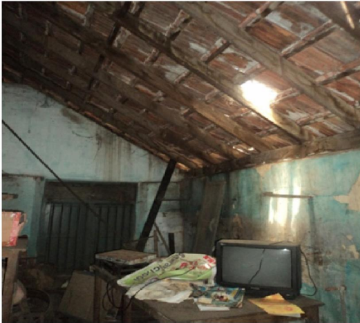
ഗവ: സെൻട്രൽ സ്കൂൾ, അട്ടക്കുളങ്ങര