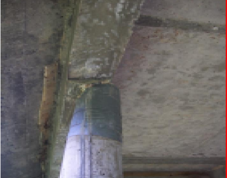
ബീമിൽ നിന്നും പില്ലർ തെന്നിമാറി

സ്ഥല പരിശോധനയിൽ പില്ലറുകൾക്കുമുകളിൽ കുരയുടെ സ്റ്റാമ്പ് വാർത്ത അവസ്ഥയിലാണ് കെട്ടിടം കാണുന്നത്. മുകൾ നിലയ്ക്ക് വേണ്ടി പില്ലർ വാർക്കുന്നതിനുള്ള കമ്പികൾ തുരുമ്പിച്ച് ജീർണ്ണാവസ്ഥയിലായും പില്ലറുകൾ ബീമിനോട് ചേരാതെ ബീമിൽ നിന്നും തെന്നിമാറി നിൽക്കുന്ന രൂപത്തിലുമാണ് കാണപ്പെടുന്നത്. തൂണുകളിലും ബീമുകളിലും കോൺക്രീറ്റ് "തിക്ക് ഫില്ലിംഗ്" നടത്തിയിട്ടില്ലാത്തതിനാൽ തുരുമ്പിച്ച കമ്പികൾ പുറത്ത് കാണാവുന്ന അവസ്ഥയിലാണ്. കോൺക്രീറ്റ് ചെയ്ത തറ മെറ്റലുകൾ ഇളകി കുണ്ടും കുഴിയുമായാണ് കാണപ്പെട്ടത്. ബോട്ട് കൺവയൻസ് നിരക്കുകൾ ഉൾപ്പെടുത്തിയിട്ടുള്ള എസ്റ്റിമേറ്റ് നിരക്ക് പ്രകാരമുള്ള പ്രവൃത്തി 10% അധിക നിരക്കിലാണ് ടെണ്ടർ ക്ഷണിച്ചിട്ടുള്ളത്. 27,50,000/- രൂപ അടങ്കൽ നിശ്ചയിച്ചിട്ടുള്ള പ്രവൃത്തിയുടെ രണ്ട് പാർട്ട് ബില്ലുകൾ പ്രകാരം 15,50,122/- രൂപയാണ് ഇതുവരെ ചെലവ് വന്നിട്ടുള്ളത്.