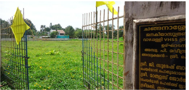
വാഴപ്പള്ളി ഗവൺമെന്റ് സ്കൂൾ ഗ്രൗണ്ട് കാടുപിടിച്ച് ഉപയോഗശൂന്യമായ നിലയിൽ

സ്പോർട്സ് & യൂത്ത് അഫേയ്സ് ഡയറക്ടറേറ്റിൽ നിന്നും തദ്ദേശസ്വയംഭരണ സ്ഥാപനങ്ങളിലെ കായികാടിസ്ഥാന സൗകര്യം മെച്ചപ്പെടുത്തുന്നതിന്റെ ഭാഗമായി മിനിസ്റ്റേഡിയം നിർമ്മിക്കുന്നതിനുവേണ്ടി കൊല്ലം ബോയ്സ് ഹൈസ്കൂളിന് 10 ലക്ഷം രൂപ ഗ്രാന്റ് അനുവദിക്കുകയും മിനി സ്റ്റേഡിയം നിർമ്മിക്കുന്നതിന് സ്ഥലസൗകര്യം ഇല്ലാത്തതിനാൽ പി.ടി.എ.യുടെയും സ്കൂൾ അധികൃതരുടെയും അഭിപ്രായം അനുസരിച്ച് ഫുട്ബോൾ കോർട്ടും, മിനി ബാസ്ക്കറ്റ് ബോൾ കോർട്ടും നിർമ്മിക്കുന്നതിന് തീരുമാനിക്കുകയും ചെയ്തു. തുടർന്ന് ജില്ലാ സ്പോർട്സ് കൗൺസിൽ സെക്രട്ടറിയുടെ നിർദ്ദേശപ്രകാരം 90 മീറ്റർ : 70 മീറ്റർ വലുപ്പത്തിൽ ഫുട്ബോൾ ഫീൽഡ് ഗ്രൗണ്ട് ലെവൽ ചെയ്ത് ഗോൾ പോസ്റ്റ് സ്ഥാപിക്കുന്നതിനും 32 മീറ്റർ : 20 മീറ്റർ വിസ്തൃതിയിൽ ബാസ്ക്കറ്റ് ബോൾ കോർട്ട് നിർമ്മിക്കുന്നതിനും എസ്റ്റിമേറ്റ് തയ്യാറാക്കി. എന്നാൽ സ്പോർട്സ് കൗൺസിൽ സെക്രട്ടറി നിർദ്ദേശിച്ച സ്ഥലത്തിനുപകരം സ്കൂൾ പി.ടി.എ.യുടെ നിർദ്ദേശപ്രകാരമുള്ള സ്ഥലത്ത് ബാസ്ക്കറ്റ് ബോൾ കോർട്ട്