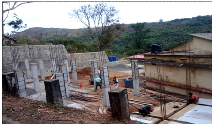
പണി പൂർത്തീകരിക്കാത്ത പട്ടികജാതി തൊഴിൽപരിശീലനകേന്ദ്രം

പട്ടികജാതി തൊഴിൽ പരിശീലന കേന്ദ്രത്തിനായി 2010-11 ൽ 15,60,000/- രൂപ ചെലവഴിച്ചത് കൂടാതെ 2011-12 ൽ 5,60,000/- രൂപയും 2012-13 ൽ 8,60,000/- രൂപയും ചെലവഴിച്ചു. കുടുംബശ്രീ ഉൽപ്പന്ന വിപണന കേന്ദ്രത്തിനായി 2010-11 ൽ 5,20,000/- രൂപ ചെലവഴിച്ചു. 2012-13 ൽ ഉൽപ്പന്ന വിപണന കേന്ദ്രത്തോടനുബന്ധിച്ച് വനിതാ കാർഷിക വിപണന കേന്ദ്രം നിർമ്മിക്കുന്നതിനായി 1,00,000/- രൂപയും വനിതാ തൊഴിൽ പരിശീലന കേന്ദ്രം നിർമ്മിക്കുന്നതിനായി 3,00,000/- രൂപയും ചെലവഴിച്ചു. രണ്ട് പ്രോജക്ടുകളിലായി വിവിധ നിർമ്മാണങ്ങൾക്ക് ആകെ 39,00,000/- രൂപ ചെലവഴിച്ചെങ്കിലും ഏതാനും തൂണുകൾ വാർക്കുക മാത്രമാണ് ചെയ്തിട്ടുള്ളത്.