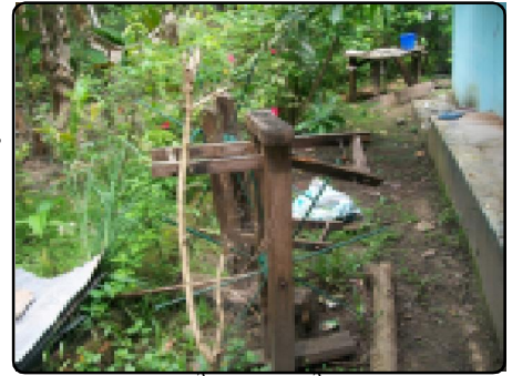
കരുനാഗപ്പള്ളി നഗരസഭയിലെ കയർപിരി റാട്ടുകൾ നശിച്ച നിലയിൽ

കരുനാഗപ്പള്ളി നഗരസഭ - കൊല്ലം ജില്ലയിലെ കരുനാഗപ്പള്ളി നഗരസഭയുടെ 34-ാം ഡിവിഷനിലുള്ള അശ്വമേധം കുടുംബശ്രീ യൂണിറ്റിന്റെ നേതൃത്വത്തിൽ ആരംഭിച്ച നവരത്നം കയർപിരി യൂണിറ്റ് ഇപ്പോൾ പ്രവർത്തനരഹിതമാണ്. കയർപിരി റാട്ടുകൾ നശിച്ച അവസ്ഥയിൽ യൂണിറ്റ് അംഗങ്ങളുടെ വീടിന് സമീപം സൂക്ഷിച്ചിരിക്കുന്നു.