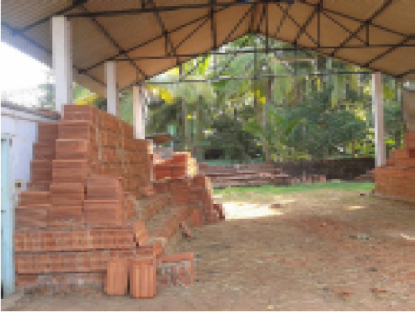
വാടകര നഗരസഭയിൽ വ്യവസായ എസ്റ്റേറ്റിനായി കൈമാറിയ 4-ാം നമ്പർ പ്ലോട്ട്

അതാത് പ്രദേശത്ത് സാധ്യതയുള്ള ചെറുകിട വ്യവസായ സംരംഭങ്ങൾ നടത്തുന്നതിനാണ് കൊല്ലം ജില്ലാപഞ്ചായത്ത്, തലവൂർ, പിറവന്തൂർ, കരവാളൂർ, പുയപ്പള്ളി എന്നീ ഗ്രാമപഞ്ചായത്തുകളിലും ചടയമംഗലം ബ്ലോക്ക് പഞ്ചായത്തിലെ നിലമേൽ എന്ന സ്ഥലത്തും അതാത് പഞ്ചായത്തുകളുടെ ഭൂമിയിൽ മിനി വ്യവസായ എസ്റ്റേറ്റുകൾ സ്ഥാപിച്ചിട്ടുള്ളത്.