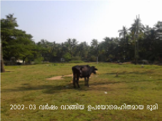
2002-03 വർഷം വാങ്ങിയ ഉപയോഗരഹിതമായ ഭൂമി

വാടകര നഗരസഭ- 2002-03 വർഷം താഴെ അങ്ങാടിയിൽ വ്യവസായ എസ്റ്റേറ്റ് സ്ഥാപിക്കുന്നതിനായി 2.6 ഏക്കർ ഭൂമി (റി.സ.155/1) 33,97,349/- രൂപ ചെലവഴിച്ച് നഗരസഭ വാങ്ങിയിട്ടുണ്ട്. ഇതിൽ ഒരേക്കർ ഭൂമി കെ.എസ്.ആർ.ടി.സി.ക്ക് കൈമാറി. സ്ഥലപരിശോധനയിൽ ബാക്കി ഭൂമി ഉപയോഗരഹിതമായി കിടക്കുന്നതായാണ് കാണാൻ കഴിഞ്ഞത്. അടിസ്ഥാന സൗകര്യവികസനത്തിനായി നഗരസഭ തുടർനടപടികൾ സ്വീകരിച്ചിട്ടില്ല. മേൽ ഭൂമിയിൽ 250 കെ.വി.എ. ട്രാൻസ്ഫോർമർ സ്ഥാപിക്കുന്നതിന് 3,47,520/- രൂപ നഗരസഭ 2003-04 വർഷം കെ.എസ്.ഇ.ബി.യിൽ ഒടുക്കിയിട്ടുണ്ട്. എന്നാൽ നാളിതുവരെ ട്രാൻസ്ഫോർമർ സ്ഥാപിച്ചിട്ടില്ല.