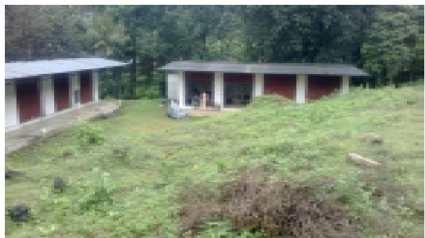
മാർക്കറ്റ് വിപണനകേന്ദ്രം ഉപയോഗശൂന്യമായ നിലയിൽ

പത്തനംതിട്ട ജില്ലയിലെ ചെറുകോൽ ഗ്രാമപഞ്ചായത്ത് - മാർക്കറ്റ് വിപണനകേന്ദ്രത്തിനായി ഇലന്തൂർ ബ്ലോക്ക് പഞ്ചായത്ത് ചെലവഴിച്ച 6.7 ലക്ഷം രൂപ പാഴായി. മാർക്കറ്റിനോ വിപണനകേന്ദ്രത്തിനോ യാതൊരു സാധ്യതയുമില്ലാത്ത കാടു പിടിച്ച സ്ഥലത്ത് 575 ച.മീ. വിസ്തീർണ്ണമുള്ള 4 കടമുറികൾ പണിത് നാളിതുവരെയും ഒരു പ്രയോജനവുമില്ലാതെ നിലകൊള്ളുകയാണ്. ബ്ലോക്ക് പഞ്ചായത്ത് നിർമ്മിച്ച വിപണനകേന്ദ്രത്തിനു തൊട്ടടുത്തായി ചെറുകോൽ ഗ്രാമപഞ്ചായത്തും 9.12 ലക്ഷം രൂപ ചെലവിൽ 6 മുറികളോടുകൂടിയ വിപണന