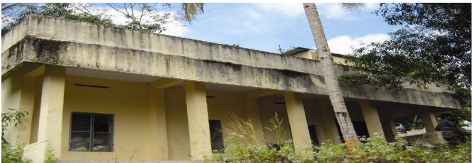
തിരുവനന്തപുരം ജില്ലാപഞ്ചായത്ത് പീപ്പിൾ പദ്ധതി ആനയറ പാക്കിംഗ് യൂണിറ്റ്