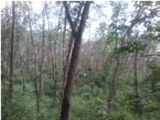
മിനിഇൻഡസ്ട്രിയൽ എസ്റ്റേറ്റിനുവേണ്ടി ശ്രീകൃഷ്ണപുരം ബ്ലോക്ക് പഞ്ചായത്ത് വാങ്ങിയ സ്ഥലം

പാലക്കാട് ജില്ലയിലെ ശ്രീകൃഷ്ണപുരം ബ്ലോക്ക് പഞ്ചായത്ത് പരിധിയിൽ അടയ്ക്കാപുത്തൂർ എന്ന സ്ഥലത്ത് മിനി ഇൻഡസ്ട്രിയൽ എസ്റ്റേറ്റ് സ്ഥാപിക്കുന്നതിനായി 9 ലക്ഷം രൂപ മുടക്കി 3 ഏക്കർ സ്ഥലം 2005 വർഷത്തിൽ വാങ്ങിയിട്ടുണ്ട്. പ്രസ്തുത സ്ഥലം ചുറ്റുമതിൽ നിർമ്മിച്ച് സംരക്ഷണം ഉറപ്പുവരുത്തിയിട്ടില്ല. കെട്ടിട നിർമ്മാണത്തിന് ലാന്റ് ട്രിബ്യൂണലിന്റെ മുൻകൂർ അനുമതി ലഭ്യമാക്കാത്തതിനാൽ മിനി വ്യവസായ എസ്റ്റേറ്റ് നിർമ്മാണം ആരംഭിക്കാൻ ബ്ലോക്ക് പഞ്ചായത്തിന് നാളിതുവരെ കഴിഞ്ഞിട്ടില്ല.