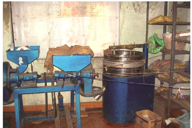
മൂന്നാർ ഗ്രാമപഞ്ചായത്തിൽ ഫ്ളോർ മില്ലിനായി വാങ്ങിയ യന്ത്രസാമഗ്രികൾ

മൂന്നാർ ഗ്രാമപഞ്ചായത്ത് - ഇടുക്കി ജില്ലയിലെ മൂന്നാർ ഗ്രാമപഞ്ചായത്തിൽ 2008-09 വർഷം പ്രത്യേകഘടക പദ്ധതിയിലുൾപ്പെടുത്തി കുടുംബശ്രീ ഫ്ളോർ മില്ലിനായി 1,67,000/- രൂപ മുതൽ മുടക്കി യന്ത്രസാമഗ്രികൾ വാങ്ങി. എന്നാൽ തൊഴിൽ യൂണിറ്റ് ആരംഭിച്ചിട്ടില്ല. യന്ത്രസാമഗ്രികൾ സ്ഥാപിച്ച് പ്രവർത്തനം തുടങ്ങുന്നതിന് പഞ്ചായത്ത് അധികൃതർ ശ്രമിക്കാത്തതിനാൽ ഉപകരണങ്ങൾ തുരുവെടുത്ത് നശിച്ചു കൊണ്ടിരിക്കുന്നു. പദ്ധതിയുടെ യഥാർത്ഥ ലക്ഷ്യത്തിലേക്ക് എത്തിച്ചേരാതെ വാങ്ങൽ മാത്രം നടത്തി പദ്ധതി അവസാനിപ്പിച്ചു.