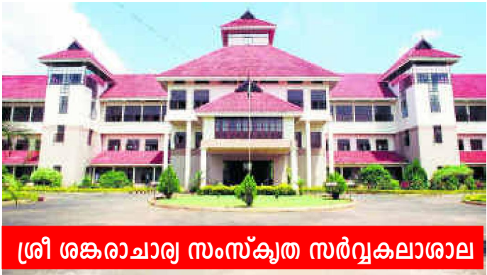
ശ്രീ ശങ്കരാചാര്യ സംസ്കൃത സർവ്വകലാശാല

1992-ൽ കാലടിയിൽ സ്ഥാപിതമായ ശ്രീ ശങ്കരാചാര്യ സംസ്കൃത സർവ്വകലാശാലയിൽ 1993 ൽ കോഴ്സുകൾ ആരംഭിച്ചു. സംസ്കൃതം, മലയാളം, ഹിന്ദി എന്നീ വിഷയങ്ങളിൽ ബിരുദാനന്തര ബിരുദ കോഴ്സുകളാണ് സർവ്വകലാശാല ആരംഭിച്ചത്. സംസ്കൃത ഭാഷയും അതിന്റെ ശാഖകളും, ഇന്ദ്രോളജി, ഇന്ത്യൻ സംസ്കാരം, ഇന്ത്യൻ ഭാഷകൾ, ഇന്ത്യൻ തത്ത്വചിന്ത, വിദേശ ഭാഷകൾ, സാമൂഹ്യ ശാസ്ത്രങ്ങൾ, ഭാരതീയ കലകൾ എന്നിവയിലെ ഉന്നത വിദ്യാഭ്യാസവും ഗവേഷണവും പ്രോത്സാഹിപ്പിക്കുക എന്നതാണ് 1994 ആകട്ടിലെ സെക്ഷൻ 5 പ്രകാരം സർവ്വകലാശാലയുടെ സ്ഥാപിതോദ്ദേശങ്ങളിൽ പ്രധാനം. സർവ്വകലാശാലയിൽ പത്ത് ഫാക്കൽറ്റികൾക്ക് കീഴിലായി 22 പഠന വകുപ്പുകളും എട്ട് പഠന കേന്ദ്രങ്ങളും നിലവിലുണ്ട്. സർവ്വകലാശാലയിലെ ബിരുദ ബിരുദാനന്തര കോഴ്സുകൾക്ക് ചോയ്സ് ബേയ്സ്ഡ് ക്രെഡിറ്റ് & സെമസ്റ്റർ വ്യവസ്ഥയാണ് നിലവിലുള്ളത്.