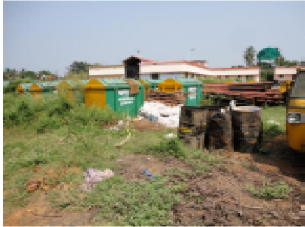
പറവട്ടാനി സോഫ്റ്റ് വെയർ ടെക്നോപാർക്ക്

6. തിരുർ നഗരസഭ - വനിതകളുടെ തൊഴിലില്ലായ്മ പരിഹരിക്കുവാൻ തിരുർ നഗരസഭ ആവിഷ്കരിച്ച പദ്ധതിയാണ് വനിതാ വ്യവസായ കേന്ദ്രം. 12/2000 ൽ നിർമ്മാണം പൂർത്തിയായ വ്യവസായകേന്ദ്രത്തിന്റെ ഇരുനിലകെട്ടിടത്തിനായി 3,89,292/- രൂപ നഗരസഭ ചെലവഴിച്ചു. നഗരസഭയുടെ 25-ാം വാർഡിൽ നടവിലങ്ങാടിയിലാണ് കെട്ടിടം സ്ഥിതി ചെയ്യുന്നത്. എന്നാൽ വ്യവസായ കേന്ദ്രത്തിന്റെ മുറികൾ വാടകയ്ക്കെടുക്കാൻ ആരും മുന്നോട്ടു വരാത്തതിനാൽ പ്രവർത്തനം തുടങ്ങാൻ കഴിഞ്ഞിട്ടില്ല. മുറികൾ വാടകയ്ക്ക് നൽകുവാൻ 18.03.2010, 22.06.2010 തീയതികളിൽ ലേലം നടത്തിയെങ്കിലും ആരും പങ്കെടുത്തില്ല. വ്യവസായ കേന്ദ്രം നിർമ്മിച്ചിട്ടുള്ളത് സംരംഭങ്ങൾ തുടങ്ങുവാൻ അനുയോജ്യമായ സ്ഥലത്തല്ലാത്തതിനാലും ഇതിനായി നിർമ്മിച്ച കെട്ടിടം ആവശ്യത്തിന് യോജിക്കുന്നതല്ലാത്തതിനാലുമാണ് ഈ സ്ഥിതി വിശേഷം ഉണ്ടായിട്ടുള്ളത്.