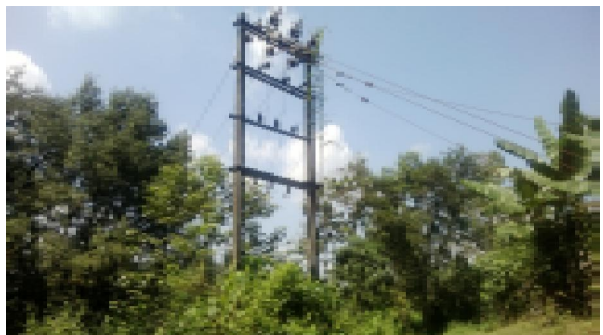
മെഴുവേലി ഗ്രാമപഞ്ചായത്ത് മിനി ഇൻഡസ്ട്രിയൽ എസ്റ്റേറ്റ്

പത്തനംതിട്ട ജില്ലയിലെ ചെറുകോൽ ഗ്രാമപഞ്ചായത്ത് - മാർക്കറ്റ് വിപണനകേന്ദ്രത്തിനായി ഇലന്തൂർ ബ്ലോക്ക് പഞ്ചായത്ത് ചെലവഴിച്ച 6.7 ലക്ഷം രൂപ പാഴായി. മാർക്കറ്റിനോ വിപണനകേന്ദ്രത്തിനോ യാതൊരു സാധ്യതയുമില്ലാത്ത കാടു പിടിച്ച സ്ഥലത്ത് 575 ച.മീ. വിസ്തീർണ്ണമുള്ള 4 കടമുറികൾ പണിത് നാളിതുവരെയും ഒരു പ്രയോജനവുമില്ലാതെ നിലകൊള്ളുകയാണ്. ബ്ലോക്ക് പഞ്ചായത്ത് നിർമ്മിച്ച വിപണനകേന്ദ്രത്തിനു തൊട്ടടുത്തായി ചെറുകോൽ ഗ്രാമപഞ്ചായത്തും 9.12 ലക്ഷം രൂപ ചെലവിൽ 6 മുറികളോടുകൂടിയ വിപണന