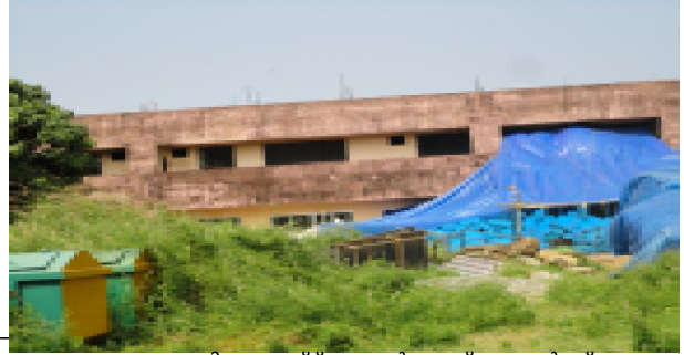
പറവട്ടാനി സോഫ്റ്റ് വെയർ ടെക്നോപാർക്ക്