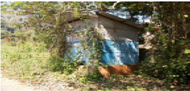
കാസറഗോഡ് മുനിസിപ്പാലിറ്റി ടൗൺ ഹാളിനു മുമ്പിലുള്ള കാടുപിടിച്ചു കിടക്കുന്ന ബങ്കുകൾ

കാസറഗോഡ് മുനിസിപ്പാലിറ്റി - സ്വയം തൊഴിൽ കണ്ടെത്തുന്നതിനും ദാരിദ്ര്യനിർമ്മാർജ്ജനത്തിനുമായി കാസറഗോഡ് മുനിസിപ്പാലിറ്റി നടപ്പാക്കിയ പദ്ധതിയാണ് ബങ്ക് നിർമ്മാണം. മുനിസിപ്പൽ പ്രദേശത്ത് വിവിധ ഭാഗങ്ങളിലായി 21 ബങ്കുകൾ നിർമ്മിച്ചിട്ടുണ്ട്. ഇവയ്ക്കുവേണ്ടി 9,11,540/- രൂപ ചെലവഴിച്ചിട്ടുണ്ട്. ഇവയിൽ 6 എണ്ണം നിലവിൽ