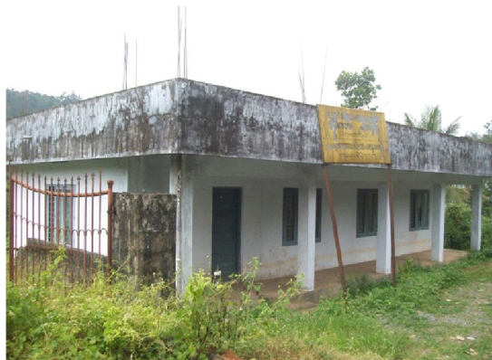
ഇടുക്കി ജില്ലാപഞ്ചായത്ത് (വ്യവസായ എസ്റ്റേറ്റുകൾ)

മലപ്പുറം ജില്ലയിലെ മൊയൂർ ഗ്രാമപഞ്ചായത്ത് - 2012-13 വർഷത്തിൽ വിവിധ ഫണ്ടുകൾ വകയിരുത്തി വനിതകൾക്ക് വ്യവസായ/തൊഴിൽ യൂണിറ്റുകൾ അനുവദിക്കുന്നതിനായി കെട്ടിടങ്ങളും അനുബന്ധ സൗകര്യങ്ങളും ഏർപ്പെടുത്തുന്നതിന് 15,36,032/- രൂപ ചെലവഴിച്ചിട്ടുണ്ട്. എന്നാൽ നാളിതുവരെ പ്രസ്തുത കെട്ടിടങ്ങളിൽ ഒരു തരത്തിലുള്ള വ്യവസായ -