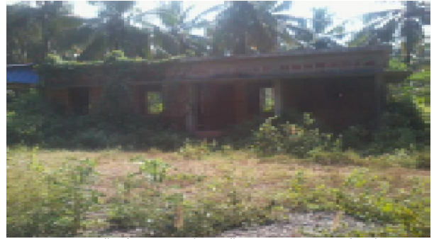
പാലക്കാട് ജില്ല-മണ്ണാർക്കാട് ഗ്രാമപഞ്ചായത്തിന്റെ- ക്ഷീരവികസന കാർഷിക വിപണനകേന്ദ്രം

പാലക്കാട് ജില്ലയിലെ മണ്ണാർക്കാട് ഗ്രാമപഞ്ചായത്ത് 10 ലക്ഷം രൂപ അടങ്കലിൽ പദ്ധതി ഫണ്ട് ഉപയോഗിച്ച് ഒരു ക്ഷീര വികസന കാർഷിക വിപണന കേന്ദ്രം സ്ഥാപിച്ചിട്ടുണ്ടെങ്കിലും അടിസ്ഥാന സൗകര്യങ്ങൾ ഒരുക്കാത്തതിനാൽ പദ്ധതി ലക്ഷ്യം കൈവരിച്ചിട്ടില്ല. തൃശ്ശൂർ ജില്ലയിലെ ആളൂർ ഗ്രാമപഞ്ചായത്തിൽ 2007-08 മുതൽ 2010-11 വരെ 25,33,492/- രൂപ അടിസ്ഥാന സൗകര്യ വികസനത്തിനായി ചെലവഴിച്ചെങ്കിലും, ഈ സൗകര്യങ്ങളൊന്നും ഉപയോഗപ്പെടുത്താതെ കിടക്കുന്നു. വ്യവസായ എസ്റ്റേറ്റിലെ കുടുംബശ്രീ വ്യവസായ ഉൽപ്പന്ന വിപണന കേന്ദ്രം എന്ന ഒരു യൂണിറ്റ് മാത്രം ഭാഗികമായി പ്രവർത്തിക്കുന്നു.