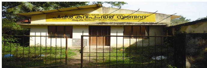
പീപ്പിൾ പദ്ധതി കരിപൗഡർ യൂണിറ്റ്- വാമനപുരം ഗ്രാമപഞ്ചായത്ത്

18 നും 45 വയസ്സിനുമിടയിലുള്ള എസ്.എസ്. എൽ.സി. യോഗ്യതയുള്ള ഗുണഭോക്താക്കളെ കണ്ടെത്തി ബാങ്ക് വായ്പാബന്ധിതമായി സംസ്ഥാന കുടുംബശ്രീ മിഷൻ, ഗ്രാമ-ബ്ലോക്ക് പഞ്ചായത്തുകൾ, പ്രോവിൻസ് ഫുഡ് പ്രൈവറ്റ് ലിമിറ്റഡ് തുടങ്ങിയ ഏജൻസികളുടെ പങ്കാളിത്തത്തോടെ തിരുവനന്തപുരം ജില്ലാപഞ്ചായത്ത് നടപ്പിലാക്കിയതായിരുന്നു പീപ്പിൾപദ്ധതി. പദ്ധതിയുടെ ഒന്നാം ഘട്ടം 2006-07 ൽ ആരംഭിച്ച് 2007-08 ൽ നടപ്പിലാക്കി. ഇതിന്റെ ഭാഗമായി 20 ഉൽപ്പാദക യൂണിറ്റുകൾ ആരംഭിച്ചു. (കരിപൗഡർ നിർമ്മാണം, പിക്സൽ നിർമ്മാണം, വിനിംഗ് ഫുഡ് തുടങ്ങിയവ) ജില്ലയിൽ 30 യൂണിറ്റുകൾ ആരംഭിക്കുകയായിരുന്നു പദ്ധതിയുടെ ലക്ഷ്യം. ഈ യൂണിറ്റുകൾക്കുള്ള മെഷീനുകൾ ജില്ലാപഞ്ചായത്ത്