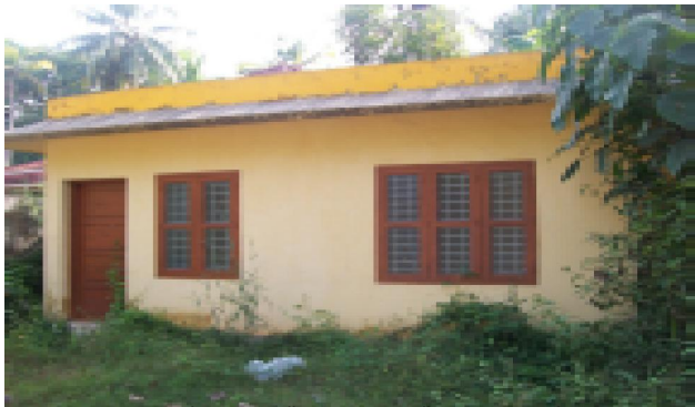
അഞ്ചൽ ബ്ലോക്ക് പഞ്ചായത്ത് കരുകോൺ വനിതാ പ്രവർത്തന കേന്ദ്രം

അഞ്ചൽ ബ്ലോക്ക് പഞ്ചായത്ത് - 2011-12 സാമ്പത്തിക വർഷം 21.81 ലക്ഷം രൂപ വകയിരുത്തി, പഞ്ചായത്ത് കോമ്പൗണ്ടിൽ ഒരു പരിശീലനകേന്ദ്രം പണിയുന്നതിനുള്ള സ്വർണ്ണജയന്തി ഗ്രാമസ്വരോസ്മാർ യോജന (S.G.S.Y) ആക്ഷൻ പ്ലാൻ ജില്ലാ ദാരിദ്ര്യ ലഘൂകരണ യൂണിറ്റിൽ ഹാജരാക്കി അംഗീകരിച്ചിരുന്നു. എന്നാൽ പിന്നീട് വിവിധ ഗ്രാമ പഞ്ചായത്തുകളിൽ വനിതാ ഉൽപ്പന്ന വിപണന കേന്ദ്രങ്ങൾ നിർമ്മിക്കുന്നതിനായി ആക്ഷൻ പ്ലാൻ റിവൈസ് ചെയ്യുകയും ആറു ഗ്രാമപഞ്ചായത്തുകളിലായി 9 കേന്ദ്രങ്ങൾ നിർമ്മിക്കുന്നതിന് തീരുമാനിക്കുകയും ചെയ്തു. ഇതിൽ ഉൾപ്പെടുന്ന അലയമൻ ഗ്രാമപഞ്ചായത്തിലെ കരുകോണിൽ അഞ്ചൽ ബ്ലോക്ക് പഞ്ചായത്ത് പണിയിട്ടുള്ള കെട്ടിടം പഞ്ചായത്തിന് വിട്ടുകിട്ടാത്ത സ്ഥലത്താണ് സ്ഥിതി ചെയ്യുന്നത്. അഞ്ചൽ SRO യിലെ 2031/73 നമ്പർ ആധാര പ്രകാരം സ്വകാര്യ വ്യക്തിയുടെ പേരിലാണ് സ്ഥലം രജിസ്റ്റർ ചെയ്തിട്ടുള്ളത് സ്വർണ്ണജയന്തി ഗ്രാമസ്വരോസ്മാർ യോജന (S.G.S.Y) ഇൻഫ്രാസ്ട്രക്ചർ ഡെവലപ്മെന്റ് ഫണ്ട് ഉപയോഗിച്ചുള്ള കെട്ടിടം പണിക്ക് 4,00,000/- രൂപയായിരുന്നു അടങ്കൽ തുക. അഞ്ചൽ - ചണ്ണപ്പേട്ട റോഡിന്റെ വശത്തായി കരുകോൺ ജംഗ്ഷനിൽ സ്ഥിതി ചെയ്യുന്ന കെട്ടിടം നിയമക്കുരുക്കിൽപ്പെട്ടതിനാൽ തുറക്കാനാവാതെ കാടു പിടിച്ച് നശിക്കുന്നു.