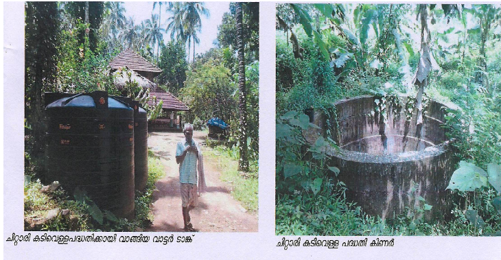
ചിറ്റാരി കുടിവെള്ളപദ്ധതിക്കായി വാങ്ങിയ വാട്ടർ ടാങ്ക്

ജില്ലയിലെ വാണിയമേൽ ഗ്രാമപഞ്ചായത്തിലുള്ള വാളംതോട്, പന്നിയേരി, മാടാഞ്ചേരി, ചിറ്റാരി, കുറ്റല്ലൂർ, മലയങ്ങാട് കോളനികളിൽ നീരുറവകൾ മാത്രമാണ് കുടിവെള്ളത്തിനാശ്രയം. വേനൽക്കാലത്ത് ഇവിടെ ജീവിതം ദുരിതമയമാവുന്നു. വടകര നഗരസഭയിൽ 10 പട്ടികജാതി കുടുംബങ്ങൾ വസിക്കുന്ന അറക്കിലാട് കോളനിയുടെ ഭൗതികസാഹചര്യങ്ങൾ ശോചനീയമാണ്. ഇവിടെ 4 കുടുംബങ്ങൾക്കേ കക്കൂസ് ഉള്ളൂ. ബാക്കി 6 കുടുംബങ്ങൾ പൊതുശുചാലയത്തെ ആശ്രയിക്കുന്നു.