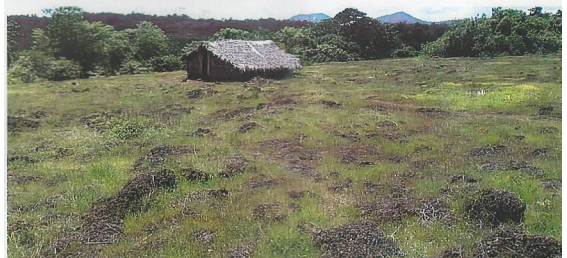
അടിസ്ഥാന സൗകര്യങ്ങൾ ഇല്ലാത്ത കമ്മാടി കോളനി

കുടിവെള്ള വിഭാഗത്തിലെ ആദിവാസികൾ അധിവസിക്കുന്ന കേരളത്തിലെ അപൂർവ്വം പ്രദേശങ്ങളിൽ ഒന്നാണ് ജില്ലയിലെ പനത്തടി ഗ്രാമപഞ്ചായത്തിലുള്ള കമ്മാടി കോളനി. അടിസ്ഥാന സൗകര്യങ്ങൾ ഏറ്റവും കുറഞ്ഞ കേരളത്തിലെ പട്ടികവർഗ്ഗ കോളനികളിൽ ഒന്നാണിത്. കാർഷികവൃത്തിയാണ് കമ്മാടി കോളനിവാസികളുടെ ഉപജീവനമാർഗ്ഗം. വിദ്യാഭ്യാസപരമായി കോളനി വളരെ പിന്നോക്കമാണ്. കോളനിയുടെ ഏറ്റവുമടുത്തുള്ള വിദ്യാലയമായ കല്ലപ്പള്ളി ഗവൺമെന്റ് എൽ.പി. സ്കൂളിൽ എത്തിച്ചേരാൻ 7 കിലോമീറ്റർ സഞ്ചരിക്കണം. യാത്രാസൗകര്യം ഇല്ലാത്തതിനാൽ കുട്ടികൾ ദുരിഭാഗവും ഇടയ്ക്കുവെച്ച് പഠനം നിർത്തുന്നു. ടാർ ചെയ്തിട്ടില്ലാത്ത കോളനി റോഡിലൂടെ കാൽനടയാത്രപോലും ദുഷ്കരമാണ്. ആകെ 60 ആദിവാസി കുടുംബങ്ങൾ ഇവിടെ കഴിയുന്നതിൽ ഒരു കുടുംബത്തിനും കുടിവെള്ളം ലഭ്യമല്ല. കക്കൂസ് ഉള്ളവ 10 എണ്ണം മാത്രമാണ്.