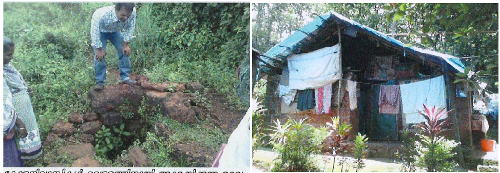
കോളനിവാസികൾ വെള്ളത്തിനായി ആശ്രയിക്കുന്ന ഉറവ

വേനൽക്കാലത്ത് കടുത്ത ജലക്ഷാമം കോളനിയെ ബാധിക്കുന്നു. പ്ലാസ്റ്റിക് ഷീറ്റുകൾ വലിച്ചുകെട്ടിയ നിലയിൽ താൽക്കാലിക മേൽക്കൂരയുള്ള 12 വീടുകൾ കോളനിയിലുണ്ട്.