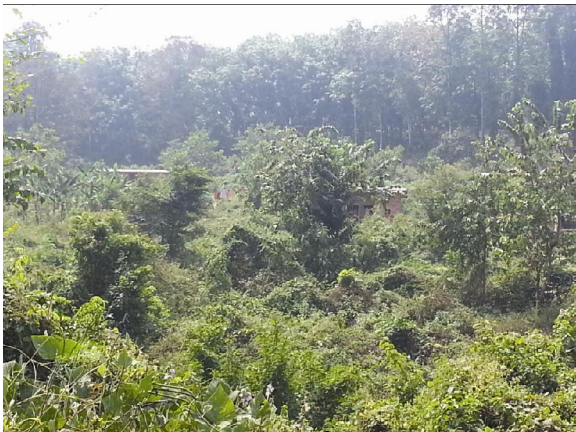
ആറ്റം ഫാം പദ്ധതി പ്രദേശം

25.9.2008-ലെ സർക്കാർ ഉത്തരവ് ഖണ്ഡിക 1, 13.10.2008-ലെ ധാരണാപത്രം ഖണ്ഡിക 2 എന്നിവ പ്രകാരം നിർമ്മിതി കേന്ദ്രത്തിനെ ഏൽപ്പിച്ച 2557 വീടുകളുടെയും അനുബന്ധ സൗകര്യങ്ങളുടെയും നിർമ്മാണത്തിനുള്ള ബൃഹത് പദ്ധതിയുടെ ഭാഗമായ പരിശീലന പരിപാടിയ്ക്കുള്ള അടിസ്ഥാന സൗകര്യം ഒരുക്കുന്നതിനാണ് 40 ലക്ഷം രൂപ നിർമ്മിതി കേന്ദ്രത്തിന് നൽകിയിട്ടുള്ളത്. എന്നാൽ 29.7.2009-ൽ നിർമ്മിതി കേന്ദ്രം നിർമ്മിച്ച് നൽകേണ്ട വീടുകളുടെ എണ്ണം 2557-ൽ നിന്നും 400 ആയി ചുരുക്കിയപ്പോഴും അടിസ്ഥാന സൗകര്യം ഒരുക്കുന്നതിനായി മേൽ സൂചിപ്പിച്ച പ്രകാരം നിർമ്മിതി കേന്ദ്രം 37,71,243/- രൂപ ചെലവഴിച്ച് കഴിഞ്ഞിരുന്നു. അതായത് 2557 വീടുകളുടെ നിർമ്മാണം മൂന്നിൽ കണ്ട് ഒരുക്കിയ അടിസ്ഥാന സൗകര്യങ്ങൾ ഫലത്തിൽ പ്രയോജനപ്പെടാതെ പോയതായി കാണുന്നു. ഇതു സംബന്ധിച്ച് നടത്തിയ ഭൗതിക പരിശോധനയിൽ അടിസ്ഥാന സൗകര്യം ഒരുക്കലിന്റെ ഭാഗമായി നിർമ്മിച്ച കെട്ടിടങ്ങൾ കാടുകയറിയും ഉപയോഗ ശൂന്യമായും കിടക്കുന്നതായി കണ്ടു (ചിത്രങ്ങൾ ചുവടെ ചേർക്കുന്നു). 21.60 ലക്ഷം രൂപ ചെലവ് വരുന്ന 18 കോഴ്സുകളുള്ള പരിശീലന പരിപാടി വിഭാവനം ചെയ്ത സ്ഥാനത്ത്, ലഭ്യമായ രേഖകൾ പ്രകാരം വെറും 9,84,368/- രൂപ മാത്രമാണ് ചെലവഴിച്ചത്.