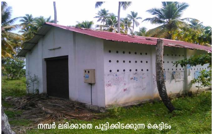
നമ്പർ ലഭിക്കാതെ പൂട്ടിക്കിടക്കുന്ന കെട്ടിടം

ചേർത്തല തെക്ക് ഗ്രാമപഞ്ചായത്തിൽപ്പെട്ട കമീൽ വനിതാ കയർ ഉൽപ്പാദക സംഘത്തിന് - ന് മേൽ പദ്ധതിയിലുൾപ്പെടുത്തി 2,54,172/- രൂപ ചെലവഴിച്ച് കെട്ടിടം നിർമ്മിക്കുകയും 10,90,182/- രൂപയുടെ മെഷിനറികൾ സ്ഥാപിക്കുകയും ചെയ്തു. എന്നാൽ ടി കെട്ടിടം തീരദേശ പരിപാലന നിയമപ്രകാരമുള്ള 200 മീറ്റർ ദുരൂപരിധി പാലിച്ചിട്ടില്ലാത്തതിനാൽ കെട്ടിട നമ്പർ നൽകാനാകില്ല എന്ന് പഞ്ചായത്തധികൃതർ അറിയിച്ചതിനെത്തുടർന്ന് ബോർഡ് ഡിസാസ്റ്റർ മാനേജ്മെന്റ്, റോസ്ത്ര സാങ്കേതിക പരിസ്ഥിതി കൗൺസിൽ, കേരള കോസ്റ്റൽ സോൺ മാനേജ്മെന്റ് അതോറിറ്റി, ജില്ലാ കളക്ടർ എന്നിവർക്ക് കത്തെഴുതിയെങ്കിലും തീരദേശ പരിപാലന നിയമത്തിൽ ഇളവ് വരുത്തി കെട്ടിടത്തിന് നമ്പർ അനുവദിച്ചു ഉത്തരവുണ്ടായില്ല. കെട്ടിട നമ്പർ അനുവദിക്കാത്ത സാഹചര്യത്തിൽ വൈദ്യുതി കണക്ഷൻ ലഭിക്കാത്തതിനാൽ യൂണിറ്റ് പ്രവർത്തനമാരംഭിക്കാനും കഴിഞ്ഞില്ല.