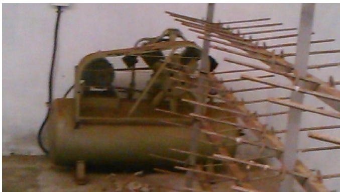
തുരുമ്പെടുത്ത് നശിക്കുന്ന യന്ത്രസാമഗ്രികൾ

കമീൽ വനിതാ കയർ ഉൽപ്പാദക സംഘം യൂണിറ്റിന് അനുവദിച്ച കെട്ടിടവും യന്ത്രസാമഗ്രികളും ക്ഷേമനിധി ബോർഡ് ഉദ്യോഗസ്ഥരുടെ സാന്നിധ്യത്തിൽ 18.5.2015 ൽ നേരിട്ട് പരിശോധന നടത്തിയതിൽ സമീപത്തെ തെങ്ങ് കടപുഴകി വീണ് കെട്ടിടത്തിന് കേടുപാടുകൾ സംഭവിച്ചതായി ഓഡിറ്റിന്റെ ശ്രദ്ധയിൽപ്പെട്ടു. ഇലക്ട്രിഫിക്കേഷൻ ജോലികൾ ചെയ്തിട്ടുണ്ടെങ്കിലും വൈദ്യുതി കണക്ഷൻ ലഭിച്ചിട്ടില്ല. കെട്ടിടത്തിനകത്തു സ്ഥാപിച്ച യന്ത്രസാമഗ്രികൾ തുരുമ്പിച്ച് നശിച്ച അവസ്ഥയിലുമാണ്. വൈദ്യുതി കണക്ഷൻ ലഭിച്ചിട്ടില്ലാത്തതിനാൽ ഒരു ദിവസം പോലും യൂണിറ്റ് പ്രവർത്തിച്ചില്ല.