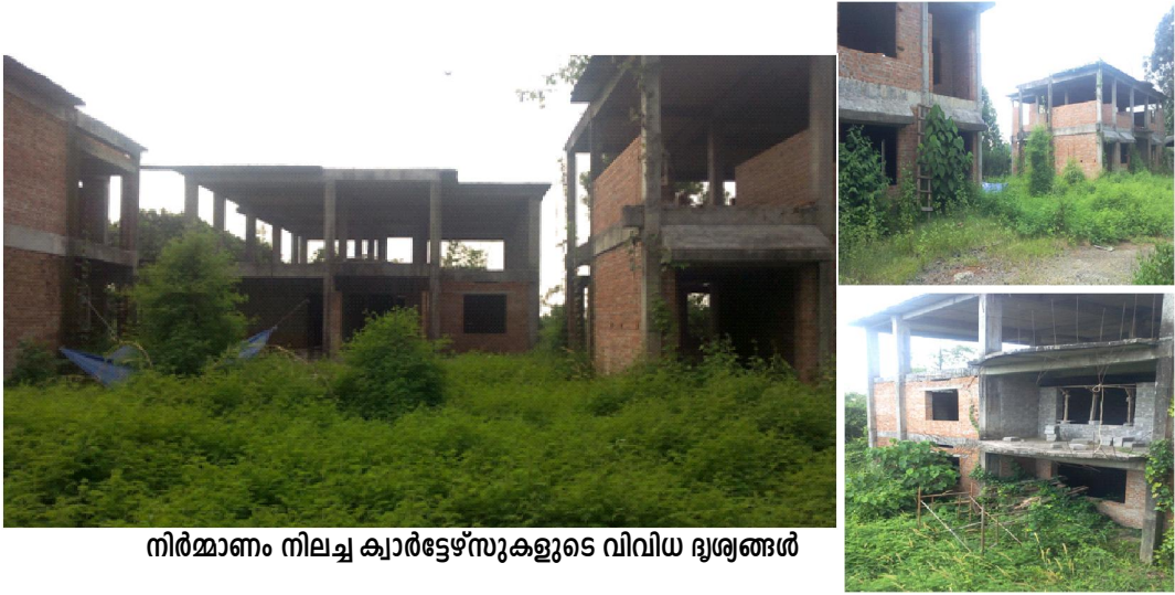
നിർമ്മാണം നിലച്ച ക്വാട്ടേഴ്സുകളുടെ വിവിധ ദൃശ്യങ്ങൾ

(നിർമ്മാണം നിലച്ച ക്വാട്ടേഴ്സുകളുടെ വിവിധ ദൃശ്യങ്ങൾ)