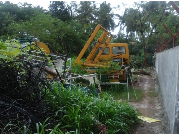
തുരുമ്പെടുത്ത് നശിക്കുന്ന യന്ത്രസാമഗ്രികൾ