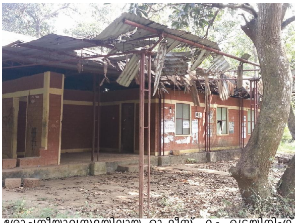
ശോചനീയാവസ്ഥയിലായ ഓഫീസ് - കം - ട്രെയിനിംഗ് സെന്റർ