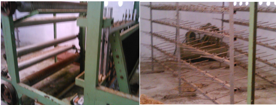
തുരുമ്പെടുത്ത് നശിക്കുന്ന യന്ത്രസാമഗ്രികൾ

പ്രസ്തുത വിഷയം സംബന്ധിച്ച് പ്രത്യേക പരിശോധനാ റിപ്പോർട്ടിന് (കെ.എസ്.എ.ഡബ്ല്യു.എൽ.എഫ്.എ.3- 72/2015, തീയതി 05.12.2015) മറുപടി ലഭ്യമാക്കിയില്ല.