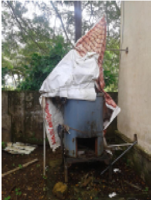
സ്റ്റീം കിച്ചൻ യൂണിറ്റ് തുരുമ്പെടുത്ത അവസ്ഥയിൽ

സർക്കാർ ഹയർ സെക്കന്ററി/ഹൈസ്കൂളുകളോടു ചേർന്നുള്ള എൽ.പി. സ്കൂളുകളിൽ ഉച്ചഭക്ഷണ വിതരണത്തിന് സ്റ്റീം കിച്ചൻ സ്ഥാപിക്കുക എന്ന ലക്ഷ്യത്തോടെ വിദ്യാഭ്യാസ ഡെപ്യൂട്ടി ഡയറക്ടർ നിർവ്വഹണ ഉദ്യോഗസ്ഥനായി 13,50,000/- രൂപ ചെലവഴിച്ച് (മെയിന്റനൻസ് ഗ്രാന്റ്/നോൺ റോഡ് ബിൽ നം.21/31.3.2014) 2013-14 വർഷം നടപ്പാക്കിയ പദ്ധതിയാണിത്. (നം.എസ്.ഒ.301/14). പ്രസ്തുത പദ്ധതി പ്രകാരം 4,50,000/- രൂപ വിലയുള്ള ഒരു കിച്ചൻ യൂണിറ്റ് മാങ്കോൻ എ.റ്റി.വി. ഗവൺമെന്റ് ഹൈസ്കൂളിന് നൽകിയെങ്കിലും യൂണിറ്റിന്റെ സാമഗ്രികൾ നാളിതുവരെയും സ്ഥാപിക്കാതെ തുരുമ്പെടുത്ത അവസ്ഥയിലാണ്. എൽ.പി. വിഭാഗത്തിൽ കുട്ടികളുടെ എണ്ണം തീരെ കുറവായ ഈ സ്കൂളിൽ ഇത്തരമൊരു യൂണിറ്റ് ആവശ്യമില്ലായിരുന്നുവെന്നും ഷെഡ് ഇല്ലാത്തത് കാരണമാണ് യൂണിറ്റ് സ്ഥാപിക്കാത്തതെന്നും സ്കൂൾ അധികൃതർ വിശദീകരിച്ചു. പദ്ധതി വിഭാവനം ചെയ്ത വേളയിൽ നിർവ്വഹണ ഉദ്യോഗസ്ഥൻ യഥാർത്ഥത്തിൽ സ്റ്റീം കിച്ചൻ ആവശ്യമായ സ്കൂളുകളുടെ ലിസ്റ്റ് തയ്യാറാക്കുകയോ യൂണിറ്റ് സ്ഥാപിക്കാനാവശ്യമായ ഭൗതിക സാഹചര്യം ഉറപ്പാക്കുകയോ ചെയ്തില്ല. ബിൽ പ്രകാരം പിൻവലിച്ച മുഴുവൻ തുകയും (ഇൻസ്റ്റലേഷൻ ചാർജ്ജ് സഹിതം) യൂണിക് സിസ്റ്റംസ്, തഴിപ്പ്, ചേർത്തല, ആലപ്പുഴ എന്ന സ്ഥാപനത്തിന് നൽകി നിർവ്വഹണം അവസാനിപ്പിക്കുകയാണുണ്ടായത്. നിർവ്വഹണത്തിലുണ്ടായ വീഴ്ച മൂലമാണ് 4,50,000/- രൂപയുടെ ഉപകരണങ്ങൾ പ്രയോജനപ്പെടുത്താനാകാതെ പോയത്. ആയതിനാൽ, പദ്ധതിയ്ക്കായി ചെലവഴിച്ച 4,50,000/- രൂപ നിർവ്വഹണ ഉദ്യോഗസ്ഥന്റെ ബാധ്യതയായി നിജപ്പെടുത്തുന്നു.