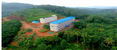
ഭവൻസ് വിദ്യാമന്ദിർ, വാര്യാപുരം

ഗ്രാമപഞ്ചായത്ത് പരിധിയിൽ പ്രവർത്തിക്കുന്ന പ്രമുഖ അൺഎയ്ഡഡ് സ്കൂളായ വാര്യാപുരം ഭവൻസ് വിദ്യാമന്ദിർ എന്ന സ്ഥാപനത്തിന്റെ വസ്തുനികുതി നിർണ്ണയിച്ച് ഈടാക്കുന്നില്ല. കേരള പഞ്ചായത്ത് രാജ് നിയമത്തിൽ വരുത്തിയ ഭേദഗതിയോടെ അംഗീകൃത അൺ എയ്ഡഡ് സ്ഥാപനങ്ങൾ നികുതി ഒഴിവാക്കാൻ അർഹരല്ല. ആയതിനാൽ 2011 ജനുവരി മുതലുള്ള വസ്തു നികുതി നിർണ്ണയിച്ച് ഈടാക്കേണ്ടതായിരുന്നു. പ്രസ്തുത സ്ഥാപനത്തിന്റെ വസ്തു നികുതി നിർണ്ണയിച്ച് ഈടാക്കാത്തതിനാൽ ഗ്രാമപഞ്ചായത്തിന് വൻ വരുമാനനഷ്ടം ഉണ്ടായിട്ടുണ്ട് [സ്വാശ്രയ സ്ഥാപനങ്ങളിൽനിന്നും വസ്തുനികുതി ഈടാക്കണമെന്ന് നിർദ്ദേശിച്ചുകൊണ്ട് തദ്ദേശസ്വയംഭരണ (ആർ.സി.) വകുപ്പ്, 11.10.15-ൽ സർക്കുലർ പുറപ്പെടുവിച്ചിട്ടുണ്ട് (നം.ആർ.സി.2/2976/2015/ത.സം.ഭ.വ.)]. മുൻകാല പ്രബല്യത്തിൽ ടി സ്ഥാപനത്തിന്റെ വസ്തുനികുതി നിർണ്ണയിച്ച് ഈടാക്കുന്നതിന് സൗകര്യം നൽകി സ്വീകരിക്കേണ്ടതാണ്.