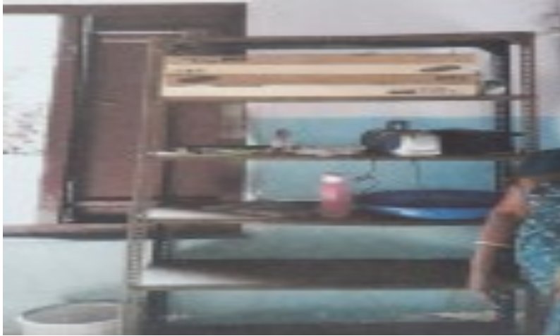
ഉപയോഗിച്ചിട്ടില്ലാത്ത LED ടി.വികൾ

ഇത്തരത്തിൽ അടിസ്ഥാന സൗകര്യങ്ങൾ ലഭ്യമാക്കാതെ ആധുനിക വൽകരണത്തിന്റെ ഭാഗമായി സ്കൂളുകളിൽ പല ഇലക്ട്രോണിക് സാധനങ്ങളും 2016-17 പദ്ധതി പ്രകാരം വാങ്ങിയിട്ടുണ്ട്. എന്നാൽ അവയൊന്നും തന്നെ ഉപയോഗിക്കാതെ വാങ്ങിയ ബോക്സിൽ തന്നെ സൂക്ഷിച്ചും വെച്ചിരിക്കുകയാണ്. കൃത്യമായ മോണിറ്ററിംഗിന്റെ അഭാവമാണ് ഇതിൽ നിന്നും വ്യക്തമാകുന്നത്. പദ്ധതി നിർവ്വഹണം നടത്തുമ്പോൾ, അവയുടെ ലക്ഷ്യം കൈവരിക്കുന്നുണ്ടോ എന്ന് മോണിറ്ററിംഗ് ചെയ്യേണ്ടതും നിർവ്വഹണ ഉദ്യോഗസ്ഥന്റെ ചുമതലയാണ്.