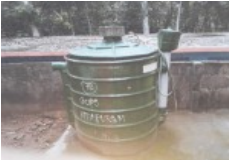
ഉപയോഗിച്ചിട്ടില്ലാത്ത ബയോഗ്യാസ് പ്ലാന്റ്