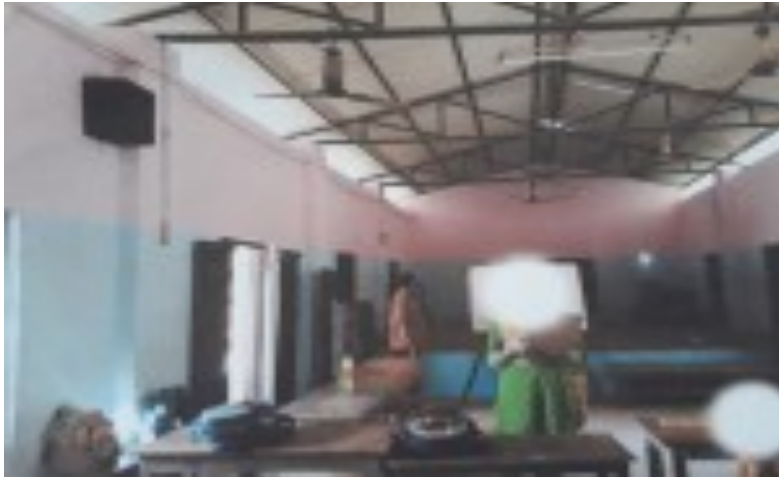
Partition ഇല്ലാതെ മൂന്ന് ക്ലാസ് മുറികൾ ഒരുമിച്ച് ഒരു ഹാളിൽ പ്രവർത്തിക്കുന്നു.