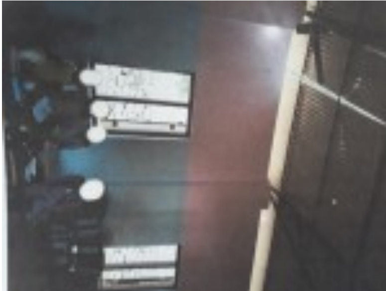
മഴക്കാലത്ത് ചോർന്നൊലിക്കുന്ന ക്ലോസ് മുറികൾ