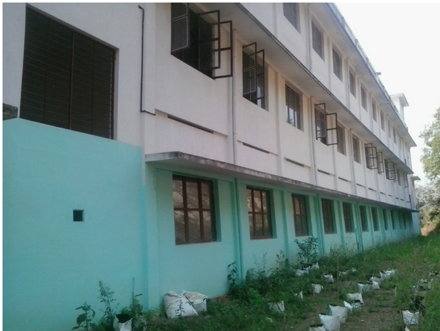
ചെർപ്പള്ളശ്ശേരി കോളേജ് ഓഫ് സയൻസ് & ടെക്നോളജി