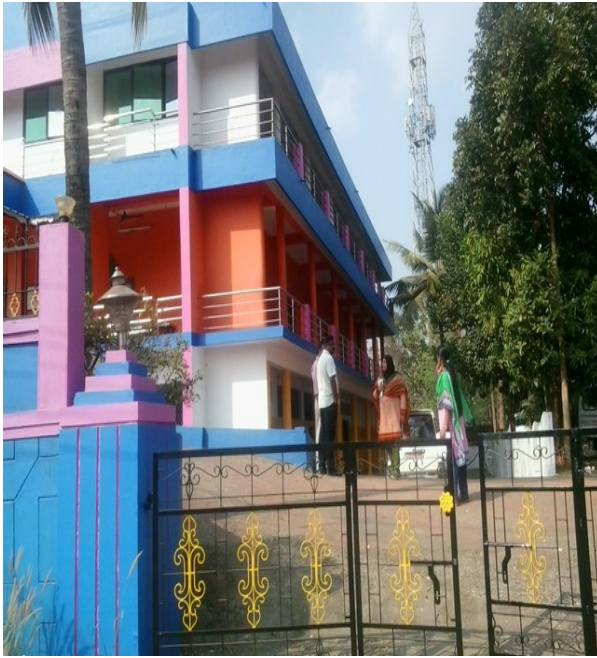
അൽ ഐൻ ഓഡിറ്റോറിയം