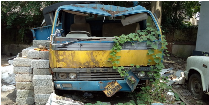
KL01-AF-3909 ശുചീകരണ ലോറി

നഗരസഭാ ഷെഡിൽ രണ്ടു വാഹനങ്ങൾ ഉപയോഗശൂന്യമായി കിടക്കുന്നുണ്ട്.