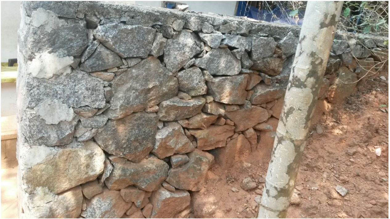
[സിമന്റ് ചാത്തിൽ കരിങ്കൽ പടവ് നടത്തി പോയിന്റിംഗ് ചെയ്തെന്ന് മൂല്യ നിർണ്ണയം നടത്തി തുക നൽകിയ കരിങ്കൽ പടവിന്റെ ഉൾഭാഗത്തുനിന്നുള്ള ദൃശ്യം- താനിയപ്പാടം എസ്.സി കോളനി]