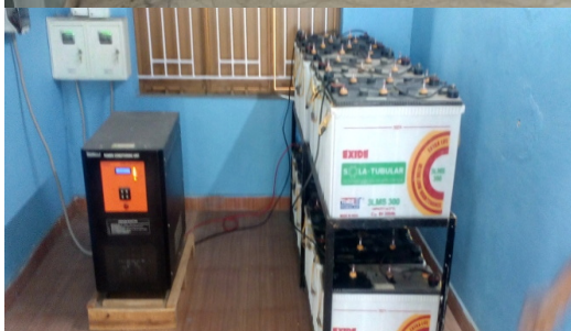
ഗ്രാമപഞ്ചായത്തിലെ സോളാർ പ്ലാന്റ്