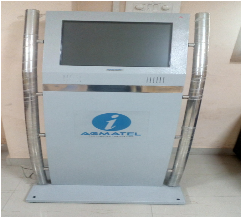
ടച്ച് സ്ക്രീൻ കിയോസ്ക്