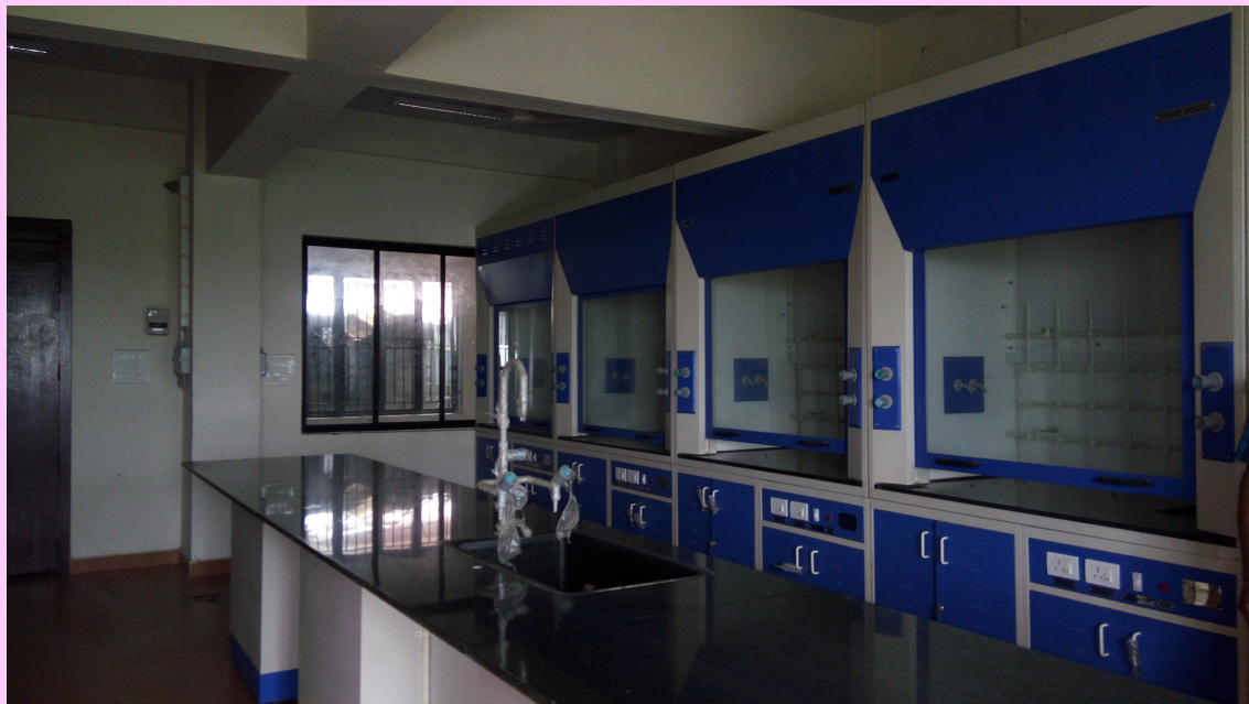
പ്രവർത്തനം തുടങ്ങാത്ത IIRBS ലബോറട്ടറി

സർവ്വകലാശാല ക്യാമ്പസിലെ Institute For Intensive Research In Basic Science (IIRBS)ന്റെ പുതിയ കെട്ടിടത്തിലേക്ക് ലാബോറട്ടറി സജ്ജമാക്കുന്നതിലേക്കായി ഡയറക്ടറുടെ 1-10-2013 ലെ അപേക്ഷ പ്രകാരം യൂണിവേഴ്സിറ്റി 60,05,000 രൂപ മതിപ്പ് വിലയുള്ള ഫ്യൂംഹൂഡ് ,ലാബ് ഫർണിച്ചർ എന്നിവ സ്റ്റോർ പർച്ചേസ് ചട്ടങ്ങൾ അനുസരിച്ച് വാങ്ങുന്നതിന് അനുവാദം നൽകിയിരുന്നു. (സർവ്വകലാശാല ഉത്തരവ് നം-1201/എ 7/2/2014/Admn തീ - 05/03/14 ) ടെണ്ടർ നടപടി ക്രമങ്ങൾ പൂർത്തിയാക്കി 59,11,297/-രൂപ ചെലവഴിച്ച് M/s ടെക്നിക്കൊ ലബോറട്ടറി പ്രൈവറ്റ് ലിമിറ്റഡ് ചെന്നൈ എന്ന സ്ഥാപനത്തിൽ നിന്നു ഉപകരണങ്ങൾ വാങ്ങി 2014 നവംബറിൽ ഇൻസ്റ്റാൾ ചെയ്തിട്ടുണ്ട്.