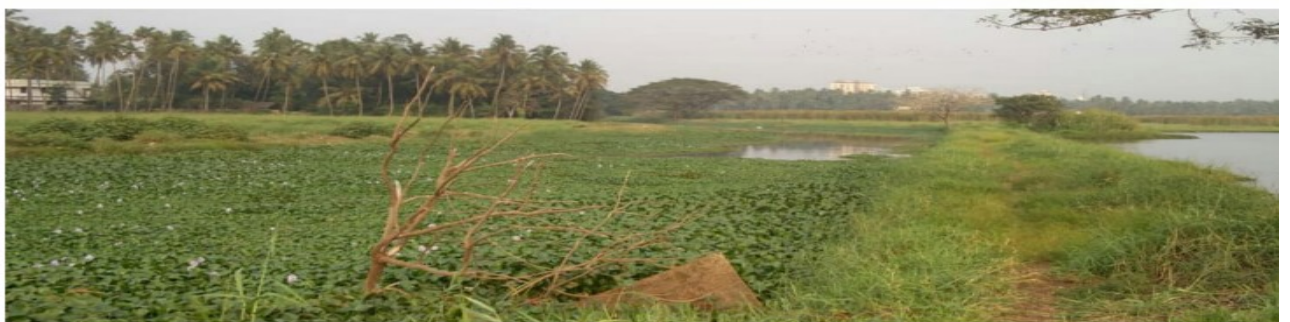
മലിനജല സംസ്കരണത്തിനായി വാങ്ങിയ സ്ഥലം

1) പ്രസ്തുത സർവ്വേ നം.289/പി.യിലെ 1hectare 58are 41 square meter ഭൂമി വൻ തുക ചെലവഴിച്ച് രജിസ്ട്രേഷൻ നടത്തിയ ഒറിജിനൽ ആധാരത്തിൽ വടക്കനാഥൻ ദേവസ്വം വകയുള്ള നിലം എന്ന് രേഖ ഭൂമിയുടെ മൂന്നാധാരങ്ങൾ, പോക്ക് വരവ് നടത്തിയതിന്റെ വിവരം, നഗരസഭയുടെ ആസ്തി രജിസ്റ്ററിൽ തുടങ്ങിയവ പരിശോധനയ്ക്ക് ഹാജരാക്കിയിട്ടില്ല.