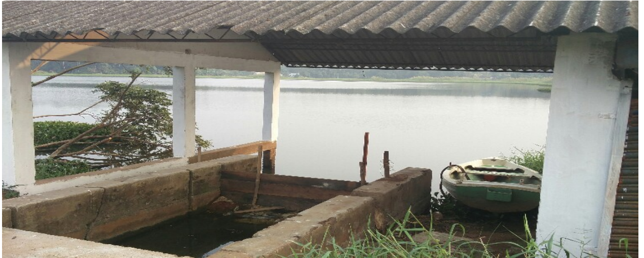
മത്സ്യ കൃഷി നടത്തുന്ന സ്ഥലം