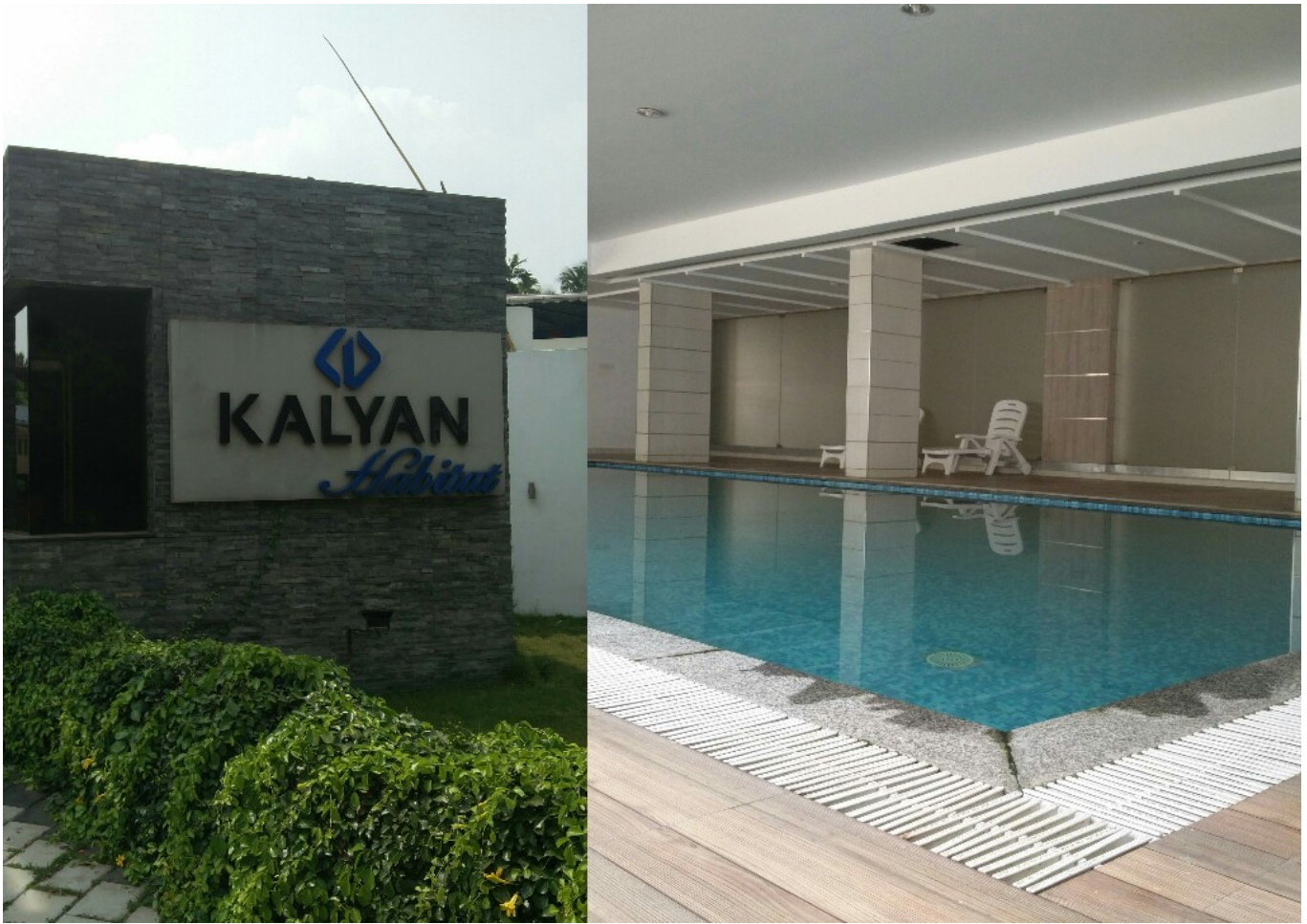
കല്യാൺ ഡവലപ്പ്മെന്റിലെ നീന്തൽകുളം