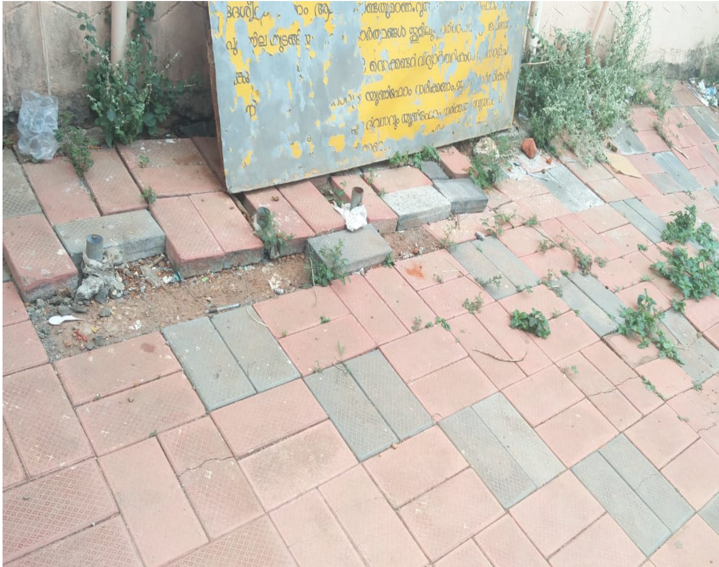
പൂജനം സ്കൂളിലെ പൊട്ടിപ്പൊളിഞ്ഞ ഇന്റർലോക്കിംഗ് ടൈലുകൾ

2016-17 ജനകീയാസൂത്രണ പദ്ധതിയിൽ പ്രോജക്ട് നം-354/16-17 ആയി ഉൾപ്പെടുത്തിയതും, 2017-18 ൽ സ്പിൽ എസ് 0342/18-ാം നമ്പരായി നടപ്പിലാക്കിയതുമായ പദ്ധതിയാണിത്. പൂജനം ഹയർ സെക്കന്ററി സ്കൂൾ കെട്ടിടങ്ങളുടെ അറ്റകുറ്റപ്പണിയാണ് പ്രോജക്ട് ലക്ഷ്യമിട്ടിരുന്നത്. ആയതിലെ ഒരിനമായ വാഹനങ്ങൾ ഷെഡ്ഡിലെ പഴയ മേൽക്കൂരയും ഷീറ്റും മാറ്റം ചെയ്തു പുതിയവ സ്ഥാപിക്കുക, തറ കോൺക്രീറ്റിംഗ്, ലിന്റ് പ്ലാസ്റ്ററിംഗ് നടത്തൽ, വാഹനഷെഡ്ഡിനോട് ചേർന്ന ഭാഗത്ത് എർത്ത് വർക്ക്, പി.സി.സി, സോളിഡ് മേഫില്ലിംഗ് സെറാമിക് സ്റ്റേസ്ഡ് വാൾടൈൽസ്, വാഷിംഗ് ഏരിയയിൽ നിന്നും വെള്ളം പുറത്തുവിടുന്നതിന് വയ്ക്കുക, എച്ച് .എസ്.എസ്.ബിൽഡിംഗിനു മുൻഭാഗത്തും സമീപ പ്രദേശങ്ങളിലും ഇന്റർലോക്കിംഗ് ടൈൽ പ്രവൃത്തിയിൽ പഴയ ഷീറ്റും, അനുബന്ധ സാമഗ്രികളും എടുത്തുവെന്ന് വ്യക്തമല്ല. ആയവ ലേലം ചെയ്തു മുക്തമാക്കിയിട്ടുണ്ട്. വാഷിംഗ് ഏരിയയിൽ സെറാമിക് ടൈലുകൾ അടർന്നു പോയതായും, പൊട്ടിപ്പോയതായും, ജലനം പെപ്പിളാതെ ഉപയോഗശൂന്യമായിക്കിടക്കുന്നതായും ശ്രദ്ധയിൽപെട്ടിട്ടുണ്ട്.