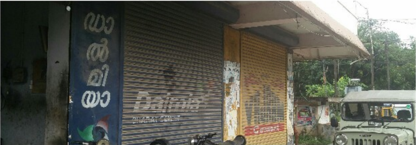
പെരിങ്ങാവ് ഷോപ്പിംഗ് കോംപ്ലക്സ്