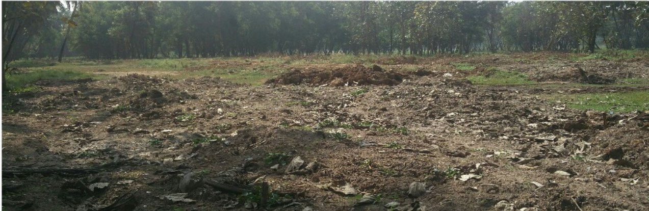
വഞ്ചിക്കുളം - കുഴിച്ചെടുത്ത മണ്ണ് സ്വകാര്യ ഭൂമിയിൽ നിക്ഷേപിച്ചിരിക്കുന്നു

14.1.16ന് സെലക്ഷൻ മെമ്മോ കൈപറ്റുമ്പോൾ, ആദ്യത്തെ അടങ്കലിലെ രണ്ടാമത്തെ ഇനമായ വെള്ളം വറ്റിക്കുന്നതിന് 65 മണിക്കൂറാണ് സമയം കണക്കാക്കിയിരുന്നത്. എന്നാൽ, മഴക്കാലത്ത് പ്രവൃത്തി ആരംഭിച്ച പമ്പ് ചെയ്യാൻ മാത്രം 242 മണിക്കൂർ വേണ്ടി വന്നിട്ടുണ്ട്. അതായത്, 177മണിക്കൂർ അധികമായി മോട്ടോർ പ്രവൃത്തി മണിക്കൂറിന് 176.56രൂപ എന്ന ഷെഡ്യൂളിലെ നിരക്ക് പ്രകാരം ആകെ 31251.12/-രൂപ അധികം ചെലവ് വേനൽക്കാലത്തോടു കൂടി തന്നെ പ്രവൃത്തി അവസാനിച്ചിരുന്നെങ്കിൽ വെള്ളം പമ്പ് ചെയ്ത് വറ്റിക്കുന്നതിന് ഇത്രയും തുക അധികച്ചെലവ് വരില്ലായിരുന്നു.