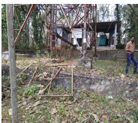
(മൊബൈൽ ടവറും ജനറേറ്റർ റൂമുകളും)

ഗ്രാമപഞ്ചായത്ത് പരിധിയിൽ പ്രവർത്തിക്കുന്നത് 12 മൊബൈൽ ടവറുകളാണെന്ന് ഭൗതികപരിശോധനയിൽ കണ്ടെത്തി. പല ടവറിന്റേയും അനുബന്ധമായി 4 ജനറേറ്റർ റൂമുകൾ വരെ ഉള്ളതായി കണ്ടു. ഗ്രാമപഞ്ചായത്ത് പരിധിയിൽ പ്രവർത്തിക്കുന്ന മൊബൈൽ ടവറുകളുടെ അനുബന്ധമായുള്ള ജനറേറ്റർ റൂമുകളുടെ വസ്തുനികുതി നിർണ്ണയിച്ചിട്ടില്ല. ഇതുമൂലം പഞ്ചായത്തിന് തനതു വരുമാനയിനത്തിൽ നഷ്ടം സംഭവിക്കുന്നു. എല്ലാ ടവറുകളുടേയും ജനറേറ്റർ റൂമുകളുടെ വസ്തുനികുതി നിർണ്ണയിച്ച് ആയത് ഈടാക്കുന്നതിന് ഭരണസമിതിയുടേയും ധനകാര്യസ്റ്റാന്റിംഗ് കമ്മിറ്റിയുടേയും അടിയന്തിര ഇടപെടലുകൾ ഉണ്ടാകേണ്ടതാണ്.