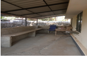
(ടെൽ പാകാത്ത വെയ്റ്റിംഗ് റൂം)

അപാകതയ്ക്ക് വിശദീകരണം ആവശ്യപ്പെട്ട് നൽകിയ ഓഡിറ്റ് എൻക്വയറിയിൽ(നം 25/25.01.2019) മറുപടി ലഭ്യമാക്കിയിട്ടില്ല. ചെയ്യാത്ത പ്രവൃത്തികൾക്ക് കൺവീനർക്ക് നൽകിയ 22038 രൂപ ഓഡിറ്റിൽ നിരാകരിക്കുന്നു. തുക നിർവ്വഹണ ഉദ്യോഗസ്ഥനായ അസിസ്റ്റന്റ് എൻജിനീയർ, പ്രവൃത്തി ചെക്ക് മെമ്പർ ചെയ്ത അസിസ്റ്റന്റ് എക്സിക്യൂട്ടീവ് എൻജിനീയർ എന്നിവരിൽ നിന്നും തുല്യമായി ഈടാക്കുന്നതിന് ഓഡിറ്റ് ശുപാർശ ചെയ്യുന്നു.