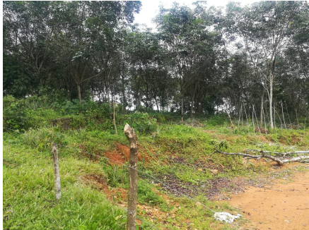
(കൂരോപ്പട വില്ലേജിലുള്ള 1 ഏക്കർ 83 സെന്റ് സ്ഥലം)