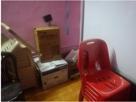
(ഗവ :മോഡൽ ഹയർ സെക്കണ്ടറി സ്കൂളിലെ സ്റ്റാർട്ട് ക്ലാസ്സ് റൂമിൽ അലക്ഷ്യമായി കൂട്ടിയിട്ടിരിക്കുന്ന ഉപകരണങ്ങൾ.)

പരിശോധന നടത്തുന്ന സമയം വരേയും (10-12-2019) ഉപയോഗിക്കാതെ സ്റ്റാർട്ട് ക്ലാസ്സിന്റെ ഒരു ഭാഗത്ത് കവറിൽ വച്ചിരിക്കുന്നതായും കണ്ടു. ഇത്തരത്തിൽ വാങ്ങിയ ഉപകരണങ്ങൾ ഉപയോഗിക്കാതിരിക്കുന്നത് പൊതുപണത്തിന്റെ ദുർഘടനയാണ്.