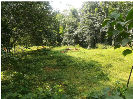
(പാമ്പാടി വില്ലേജിലുള്ള 17 ആർ' സ്ഥലം)