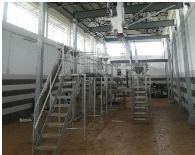
(ആധുനിക അറവുശാലയ്ക്കായി സ്ഥാപിച്ച ഉപകരണങ്ങൾ)

15.03.2018 ൽ 70ലക്ഷം രൂപയുടെമെക്കാനിക്കൽ ഉപകരണങ്ങൾ വാങ്ങുന്നതിനുള്ള ഇ-ടെണ്ടർ ക്ഷണിച്ചെങ്കിലും ആരും പങ്കെടുക്കാത്തതിനാൽ 03.07.2018 ൽ റീ-ടെണ്ടർ നടത്തി. തുടർന്ന്, എറണാകുളം, കിഴക്കമ്പലം, DELBERT Industries Pvt.Ltd. എന്ന സ്ഥാപനം 90.275 ലക്ഷം രൂപ ടെണ്ടറിൽ കോട്ട് ചെയ്യുകയും (04.08.2018) തുടർചർച്ചകളെത്തുടർന്ന് 70 ലക്ഷം രൂപയുടെ കരാറിൽ ഏർപ്പെടുകയും ചെയ്തു (കരാർ നം:328/2018-19;11.01.2019).തുടർന്ന് 11.01.2019 ൽ ടി സ്ഥാപനത്തിന് വർക്ക് ഓർഡർ നൽകി. വർക്ക് ഓർഡർ പ്രകാരം മൂന്നു മാസത്തിനകം (11.04.2019) യന്ത്രോപകരണങ്ങൾ പൂർണ്ണമായും സ്ഥാപിക്കണമായിരുന്നു. എന്നാൽ സ്ഥാപനം ഹാജരാക്കിയ ബിൽ പ്രകാരം 67,83,000 രൂപയുടെ ഉപകരണങ്ങൾ മാത്രമേ സ്ഥാപിച്ചിട്ടുള്ളൂ. 2.17 ലക്ഷം രൂപയുടെ ഉപകരണങ്ങൾ സ്ഥാപിച്ചിട്ടില്ല. ബില്ലുകളുടെ പരിശോധനയിൽ Electrical Stunning Tool,Trolley made of hot dip galvanised with PVC Tank എന്നിവ സ്ഥാപിച്ചതായി കണ്ടില്ല.സ്ഥാപിച്ച ഉപകരണങ്ങളുടെ ബിൽ തുകയായ 67.83 ലക്ഷം രൂപ സ്ഥാപനത്തിന് 2019-20 ൽ നൽകിയിരുന്നു. അവശേഷിക്കുന്ന ഉപകരണങ്ങൾ സ്ഥാപിച്ചു യന്ത്രഭാഗങ്ങൾ പ്രവർത്തനക്ഷമമാക്കിയിട്ടില്ല.