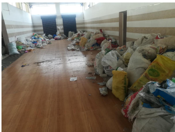
(പുതുതായി നിർമ്മിച്ച കെട്ടിടത്തിൽ പ്ലാസ്റ്റിക് സാമഗ്രികൾ അലക്ഷ്യമായി കൂട്ടിയിരിക്കുന്നു.)

4) വകയിരുത്തിയ തുകയിൽ അവശേഷിച്ച തുക ഉപയോഗിച്ച് ഡസ്റ്റ് റിമൂവർ മെഷീൻ വാങ്ങുന്നതിനു 2019-20 ൽ പദ്ധതി തയ്യാറാക്കുകയും (പ്രോജക്ട് നം:635/2019-20) അസിസ്റ്റന്റ് എക്സിക്യൂട്ടീവ് എഞ്ചിനീയറുമായി ക്ലീൻ കേരള കമ്പനി 08-03-2019 ൽ കരാറിൽ ഏർപ്പെടുകയും ചെയ്തു. കരാർ പ്രകാരം 15 HP യുള്ള ഈ മെഷീൻ നികുതിയും ഇൻസ്റ്റലേഷൻ ചാർജും ഉൾപ്പെടെ 428300 രൂപ രേഖപ്പെടുത്തിയിരുന്നു. ടി തുക അടവാക്കിയിട്ടില്ല. ആദ്യ എസ്റ്റിമേറ്റിലോ പദ്ധതിയിലോ ഉൾപ്പെടാത്ത ഈ മെഷീന്റെ ആവശ്യകത വ്യക്തമല്ല.