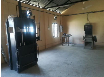
(പ്രവർത്തനം തുടങ്ങാത്ത പ്ലാസ്റ്റിക് ഷ്രെഡ്ഡിംഗ് യൂണിറ്റ്)