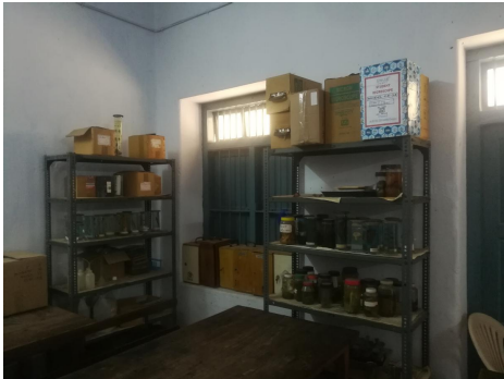
(ഗവ:മോഡൽ ഹയർ സെക്കണ്ടറി സ്കൂളിലെ ലാബിൽ ഉപയോഗിക്കാതിരിക്കുന്ന ലാബ് ഉപകരണങ്ങൾ)

കോട്ടയം, ഗവ മോഡൽ ഹയർ സെക്കണ്ടറി സ്കൂളിൽ ഓഡിറ്റ് ടീം നടത്തിയ പരിശോധനയിൽ പദ്ധതി പ്രകാരം വാങ്ങി നൽകിയ പല ലാബ് ഉപകരണങ്ങളും ഉപയോഗിക്കുന്നില്ല എന്നു കണ്ടു. ബിൽ പ്രകാരം 25900 രൂപയുള്ള Compound Microscope (Olympus) എന്ന ഉപകരണം പരിശോധനാ വേളയിൽപ്പോലും (10-12-2019) കവർ പൊട്ടിച്ചിട്ടില്ല എന്നു വ്യക്തമായി. ഓഡിറ്റിന്റെ സാന്നിധ്യത്തിലാണ് സ്കൂൾ അധികൃതർ മറ്റു ഉപകരണങ്ങളും തുറന്നു പരിശോധിച്ചത്. നിലവിലുള്ള ഉപകരണങ്ങൾ ഉപയോഗക്ഷമമായതുകൊണ്ടാണ് പുതുതായി ലഭിച്ച ഉപകരണങ്ങൾ ഉപയോഗിക്കാതിരുന്നത് എന്നു സ്കൂൾ അധികൃതർ മറുപടി നൽകി. 5219 രൂപ വിലയുള്ള മറ്റു നാലു Compound Microscope ഉം ഇത്തരത്തിൽ ഉപയോഗിക്കാതിരുന്നതായി കണ്ടു. സ്കൂൾ അധികൃതർ ആവശ്യപ്പെട്ടിട്ടാണോ ഇത്തരം ഉപകരണങ്ങൾ വാങ്ങി നൽകിയതെന്നാവശ്യപ്പെട്ടുകൊണ്ടു നൽകിയ ഓഡിറ്റ് എൻക്വയറിയ്ക്കു മറുപടിയായി (ഓഡിറ്റ് എൻക്വയറി നം:44/2018-19; 19.12.2019.) സ്കൂളധികൃതർ അപ്രകാരം ഉപകരണങ്ങൾ രേഖാമൂലം ആവശ്യപ്പെട്ടു എന്ന മറുപടിയാണ് നിർവ്വഹണ ഉദ്യോഗസ്ഥൻ നൽകിയത്.