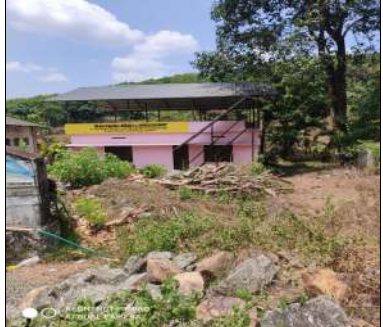
അയർക്കുന്നം പഞ്ചായത്തിലെ പകൽ വീട് പ്രവർത്തനക്ഷമമല്ലാത്ത നിലയിൽ

പ്രവർത്തന ക്ഷമമാക്കാത്തതിനും കോർഡിനേഷൻ ഇല്ലായ്മ ഒരു പരിധിവരെ കാരണമാണ്. ത്രിതല പഞ്ചായത്തുകൾ ആവിഷ്കരിക്കുന്ന പ്രോജക്ടുകളിൽ ഇരട്ടിപ്പ് വരാതിരിക്കുന്നതിനും പ്രോജക്ടുകൾ ഫലപ്രാപ്തിയിലെത്തുന്നതിനും സ്ഥാപനങ്ങൾ തമ്മിലും ജനപ്രതിനിധികൾ തമ്മിലുമുള്ള ആശയവിനിമയവും കോർഡിനേഷനും ഉറപ്പുവരുത്തേണ്ടതാണ്.