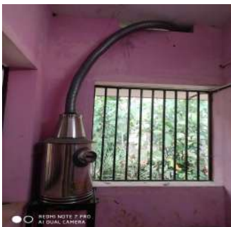
നെടുങ്കുന്നം ഗവ.ഹയർസെക്കണ്ടറി സ്കൂളിൽ സ്ഥാപിച്ചിട്ടുള്ള ഇൻസിനറേറ്റർ

കൂടാതെ, തൃക്കൊടിത്താനം ഗവ.ഹയർ സെക്കൻഡറി സ്കൂൾ, നെടുങ്കുന്നം ഗവ.ഹയർ സെക്കൻഡറി സ്കൂൾ എന്നിവിടങ്ങളിലെ ശുചിമുറികൾ സന്ദർശിച്ചതിൽ തൃക്കൊടിത്താനത്ത് വയറിംഗ് നടത്തി ഇലക്ട്രിക് കണക്ഷൻ ലഭ്യമാക്കിയിട്ടില്ലെന്ന് കണ്ടു. ശുചിമുറി ഉപയോഗക്ഷമമാക്കിയിട്ടില്ല. നെടുങ്കുന്നത്ത് ഇൻസിനറേറ്റർ സ്ഥാപിച്ചിട്ടുണ്ടെങ്കിലും കണക്ഷൻ നൽകി പ്രവർത്തനക്ഷമമാക്കിയിട്ടില്ല.