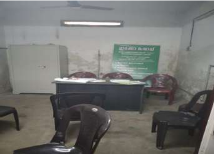
നിലവിൽ പ്രവർത്തനമില്ലാത്ത നെടുംകുന്നം കാർഷികവികസനസംഘം

09.03.2020ൽ ഓഡിറ്റ് ടീം നടത്തിയ സ്ഥലപരിശോധനയിൽ ക്രമനമ്പർ 2ൽ ഉൾപ്പെട്ട കർഷകസംഘത്തിന് ഉപകരണങ്ങൾ വാങ്ങിയിട്ടുണ്ടെങ്കിലും നിലവിൽ ഇക്കോഷോപ്പ് പ്രവർത്തനക്ഷമമല്ലെന്ന് ബോധ്യപ്പെട്ടു. ക്രമ നമ്പർ 8ൽ ഉൾപ്പെട്ട പത്തായപ്പാറ, ഫാർമേഴ്സ് ക്ലബ്ബ് 09.03.2020ലാണ് ഉദ്ഘാടനം ചെയ്യപ്പെട്ടിട്ടുള്ളത്. ക്രമനമ്പർ 4 നാളിതുവരെ പ്രവർത്തനമാരംഭിച്ചിട്ടില്ല. മേൽ സൂചിത വിവരങ്ങൾ 07/03/2020, 09/03/2020 തീയതികളിൽ നടത്തിയ ഭൗതികപരിശോധനയിൽ ബോധ്യപ്പെട്ടതുമാണ്.