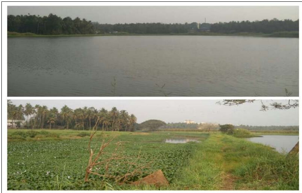
മലിനജല സംസ്കരണത്തിനായി വാങ്ങിയ സ്ഥലം