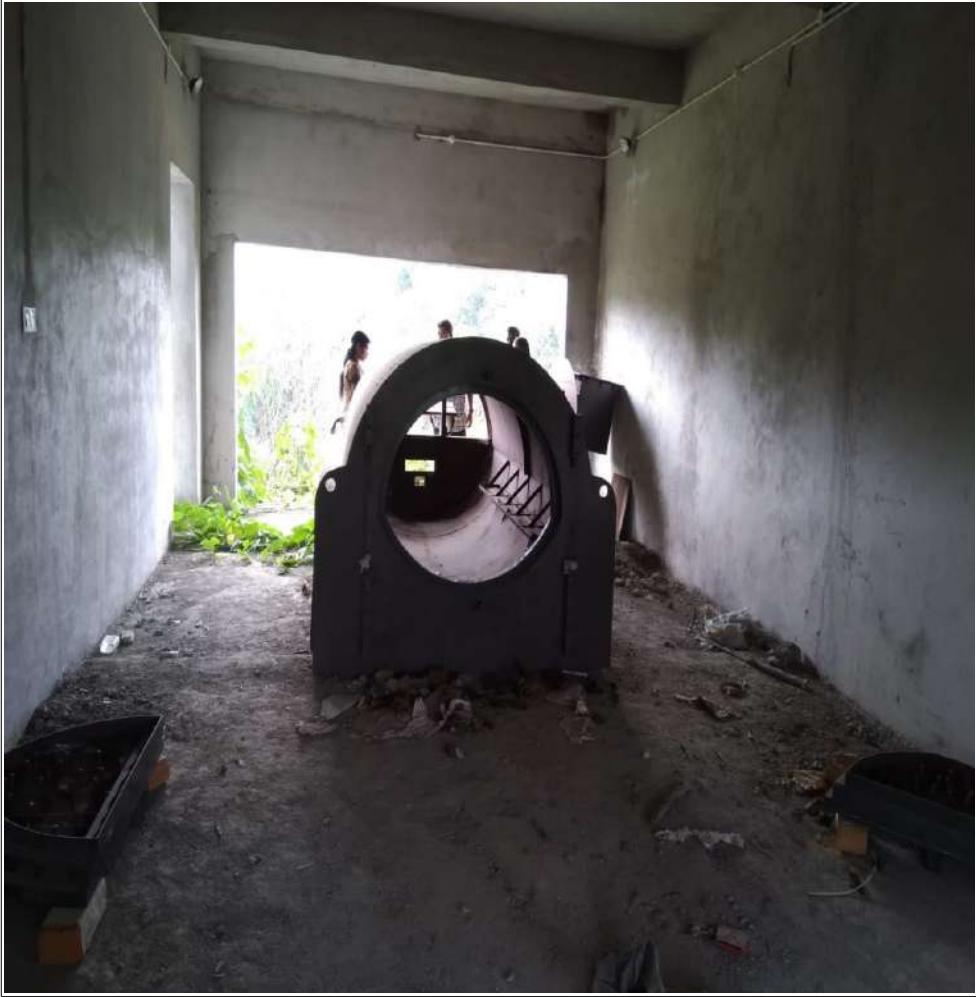
നിർമ്മാണം പൂർത്തീകരിച്ചിട്ടില്ലാത്ത ഗ്യാസ് ഫർണസ്

പ്രകാരം 16,01,850/- രൂപയും സ്ഥാപനത്തിന് നൽകിയിട്ടുണ്ട്. ഭൗതിക പരിശോധനയിൽ ഗ്യാസ് ബർണർ, മൃതദേഹം കിടത്തുന്നതിനുള്ള സ്റ്റീൽബെഡ്, പ്രധാന നിർഗ്ഗമനക്കുഴലിലേക്കുള്ള കണക്ഷൻ പൈപ്പുകൾ, മറ്റ് അനുബന്ധസാമഗ്രികൾ എന്നിവയൊന്നും ഘടിപ്പിക്കാതെ ചേമ്പർമാത്രം തുറസ്സായ കെട്ടിടത്തിൽ വെച്ചിരിക്കുന്നതായി കണ്ടു. സ്റ്റീൽബെഡ് സ്ഥലത്ത് കാണാത്തത് എവിടെയാണ് സൂക്ഷിച്ചിട്ടുള്ളതെന്ന് വ്യക്തമാക്കിയിട്ടില്ല. ചുറ്റുമതിലോ, കതകുകളും വാതിലുകളും ഉൾപ്പെടെയുള്ള സംരക്ഷണ സംവിധാനങ്ങളോ കെട്ടിടത്തിന് ഇല്ലാത്തതിനാലാണ് ഇവയൊന്നും സ്ഥാപിച്ചിട്ടില്ലാത്തതെന്ന് നഗരസഭാ ഉദ്യോഗസ്ഥർ അറിയിച്ചിട്ടുണ്ട്. എന്നാൽ ഇവ സ്ഥാപിക്കുന്നതുൾപ്പെടെയുള്ള തുകയാണ് നിർവ്വഹണ ഏജൻസിക്ക് നൽകിയിട്ടുള്ളത്. പ്രസ്തുത അപാകത സംബന്ധിച്ച് വിശദീകരണം ലഭ്യമാക്കിയിട്ടില്ല.