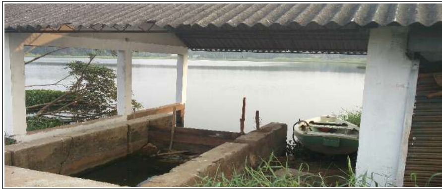
മത്സ്യ കൃഷി നടത്തുന്ന സ്ഥലം