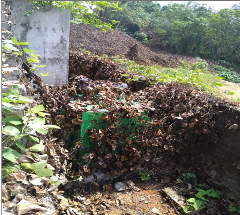
സുരക്ഷിതമല്ലാതെ സൂക്ഷിച്ചിരുന്ന ജനറേറ്ററിന്റെ പ്ലാസ്റ്റിക് കവചം കത്തിയ നിലയിൽ