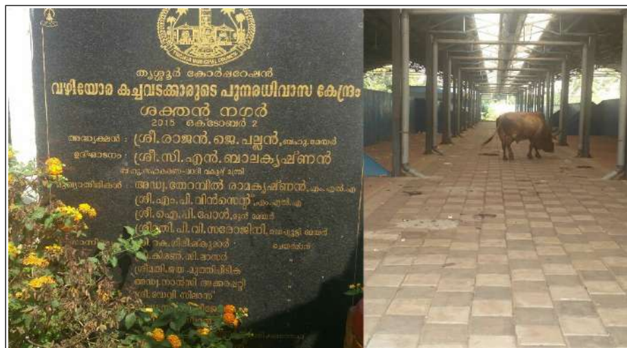
തെരുവോര കച്ചവടക്കാരുടെ പുനരധിവാസകേന്ദ്രത്തിൽ അലഞ്ഞുതിരിയുന്ന കന്നുകാലികൾ

ഇത്തരത്തിൽ, കോർപ്പറേഷൻ പ്രതിദിനം 9,120/- രൂപ വരുമാനവും പ്രതീക്ഷിച്ചിരുന്നു. അത്തരത്തിൽ ഒരു മാസം 2,73,600/- രൂപയാണ് വരവ് കണക്കാക്കാവുന്നത്. തെരുവോര കച്ചവടക്കാരുടെ ഉപജീവനം മെച്ചപ്പെടുത്താനെന്ന സദുദ്ദേശത്തോടെ പണികഴിപ്പിച്ച പ്രസ്തുത കെട്ടിടം ഇപ്പോൾ യാതൊരു പ്രയോജനവുമില്ലാതെ, കന്നുകാലികളുടെയും സാമൂഹ്യ വിരുദ്ധരുടെയും താവളമായി മാറിയിരിക്കുകയാണ്. തെരുവുകച്ചവടക്കാർ ഇപ്പോഴും നഗരത്തിലെ കാൽനടപ്പാതകൾ കൈയടക്കി വച്ചിരിക്കുന്നു.