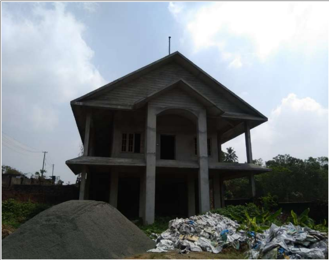
തുടർ പ്രവൃത്തികൾ തടസ്സപ്പെട്ട് കാട്പിടിച്ചു കിടക്കുന്ന ഗ്യാസ് ക്രിമറ്റോറിയം

കെട്ടിടത്തിന്റെ സൗന്ദര്യവൽക്കരണത്തിനും പരിസരത്തിന്റെ ആകർഷണീയതയ്ക്കും വേണ്ടി ആദ്യ എസ്റ്റിമേറ്റിൽ ഉൾപ്പെടുത്തിയിരുന്ന വിവിധ പ്രവൃത്തി ഇനങ്ങൾ നിർവ്വഹണവേളയിൽ ഒഴിവാക്കി ലെവലിംഗിനുവേണ്ടിയുള്ള ഇനങ്ങൾ ഉൾപ്പെടുത്തി എസ്റ്റിമേറ്റ് റിവൈസ് ചെയ്തിരുന്നു. ലെവലിംഗ് പ്രവൃത്തികൾ നടപ്പാക്കിയിട്ടുണ്ടെങ്കിലും പദ്ധതിസ്ഥലം നിലവിലും കന്നം കുഴിയുമായ അവസ്ഥയിലാണ്. എസ്റ്റിമേറ്റിലുൾപ്പെട്ട പ്ലാസ്റ്ററിംഗ്, കരകുകളും ജനാലകളും ഘടിപ്പിക്കൽ, ടൈൽപാകൽ, പ്ലംബിംഗ് സംവിധാനങ്ങൾ എന്നീ പ്രവൃത്തി ഘടകങ്ങളൊന്നും നടപ്പാക്കിയിട്ടില്ല. സാനിറ്ററി സൗകര്യത്തിന്റെ ഭാഗമായി വാങ്ങിയിട്ടുള്ള രണ്ട് യൂറോപ്യൻ ക്ലോസറ്റുകൾ കെട്ടിടത്തിനുപുറത്ത് സൂക്ഷിച്ചിരിക്കുകയാണ്. സൂക്ഷ്മ മാത്രം പൂർത്തീകരിച്ച കെട്ടിടത്തിൽ വൈദ്യുതീകരണത്തിനുവേണ്ടി വയറിംഗ് നടത്തിയിട്ടുണ്ട്. ഗ്യാസ് ക്രിമറ്റോറിയത്തിനുവേണ്ടി 49,83,549/- രൂപ ചെലവഴിച്ച് പണികഴിപ്പിച്ചിട്ടുള്ള കെട്ടിടവും പരിസരവും കാട് പിടിച്ചു മറ്റ് പാഴ്വസ്തുക്കളുടെയും സാന്നിധ്യംകൊണ്ട് വൃത്തിഹീനമായ അവസ്ഥയിലുമാണ്.