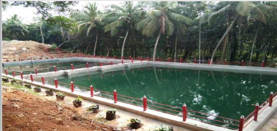
സ്വകാര്യ സ്ഥാപനം നിർമ്മിച്ച ജലസംഭരണി