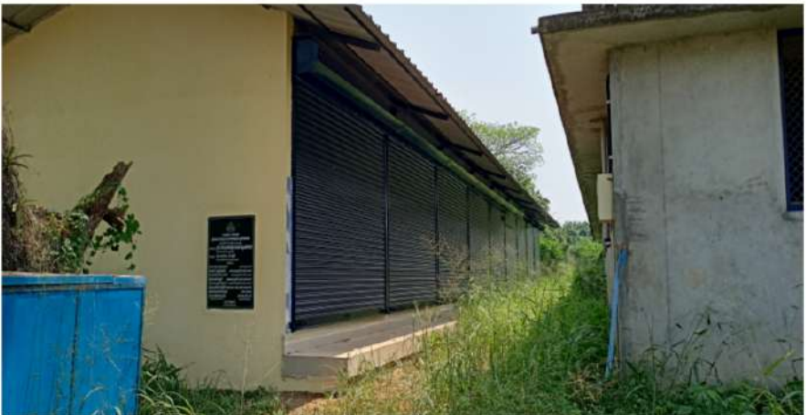
(ഉപേക്ഷിക്കപ്പെട്ട ഫിഷ് മാർക്കറ്റ് കെട്ടിടം)

4) 28.21 ലക്ഷം രൂപ ചെലവഴിച്ച കെട്ടിടം യാതൊരു പ്രയോജനവുമില്ലാതെ കാടുകയറി കിടക്കുന്നതായി ഓഡിറ്റ് നേരിട്ടു നടത്തിയ പരിശോധനയിൽ ബോധ്യപ്പെട്ടു. ഉണക്കമീൻ മാർക്കറ്റിനായി നിർമ്മിച്ച കെട്ടിടത്തിൽ മീൻ വ്യാപാരം നടക്കുന്നില്ല. ഈ കെട്ടിടത്തിനു എതിർവശത്തുള്ള റോഡ് സൈഡിൽ വ്യാപാരികൾ ഉണക്കമീൻ കച്ചവടം നടത്തുന്നുണ്ട്. ലക്ഷക്കണക്കിനു രൂപ ചെലവഴിച്ച നിർമ്മിച്ച കെട്ടിടം കാടുകയറിക്കിടക്കുന്നതിൽ നഗരസഭയോടു വിശദീകരണം ആവശ്യപ്പെട്ടെങ്കിലും നഗരസഭ മറുപടി നൽകിയിട്ടില്ല.