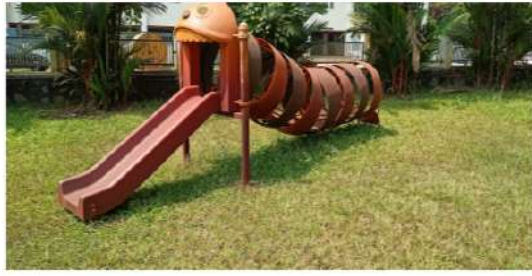
(പാർക്കിലെ കളിയുപകരണങ്ങൾ നാശോന്മുഖമായ നിലയിൽ)

നാഗമ്പടത്ത് വെള്ളം കയറുന്നത് പതിവാണെന്നും ഇവ കെട്ടിക്കിടന്നാണ് ഉപകരണങ്ങൾ നശിച്ചു പോകുന്നതെന്നും ഓഡിറ്റ് നടത്തിയ അന്വേഷണത്തിൽ ബോധ്യപ്പെട്ടിട്ടുണ്ട്. ഇക്കാര്യം പദ്ധതി തയ്യാറാക്കുമ്പോൾ എഞ്ചിനീയറിംഗ് വിഭാഗം പരിഗണിക്കാത്തത് ഉദ്യോഗസ്ഥ തലത്തിലുള്ള വീഴ്ചയാണ്. പാർക്കിന്റെ മധ്യ ഭാഗത്ത് മണ്ണിടയർത്തിയതിനാൽ ഈ ഭാഗത്ത് വെള്ളം കയറാറില്ല. പാർക്ക് മണ്ണിടയർത്തി നവീകരണം നടത്താത്തതു മൂലം ഇപ്പോൾ സ്ഥാപിച്ച 12 ലക്ഷം രൂപയുടെ ഉപകരണങ്ങൾ നശിക്കുവാൻ കാരണമായി. ഇനിയും ഇത്തരം പദ്ധതികൾ ആവിഷ്കരിക്കുമ്പോൾ നാഗമ്പടത്തെ വെള്ളക്കെട്ടിനു പരിഹാരം കാണാത്ത പക്ഷം പൊതുപണം ഈവിധം പാഴായി പോകുമെന്ന് ഓഡിറ്റ് വിലയിരുത്തുന്നു. നഗരസഭയുടെ അടിയന്തിര ശ്രദ്ധ ഈ വിഷയത്തിലുണ്ടാകേണ്ടതാണ്. ഉപകരണങ്ങളുടെ വാറണ്ടി സംബന്ധിച്ചും അറ്റകുറ്റപ്പണികൾ സംബന്ധിച്ചും നിർവ്വഹണത്തിലെ വീഴ്ച സംബന്ധിച്ചുമുള്ള ഓഡിറ്റ് എൻക്വയറിൽ എഞ്ചിനീയറിംഗ് വിഭാഗം ഉദ്യോഗസ്ഥർ മറുപടി നൽകാത്തതിനാൽ കളിയുപകരണങ്ങൾ സ്ഥാപിക്കുന്നതിനായി ചെലവഴിച്ച ₹1222687 രൂപ ഓഡിറ്റിൽ തടസ്സപ്പെടുത്തുന്നു.