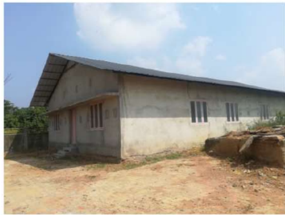
(ഉപേക്ഷിക്കപ്പെട്ട ABC കെട്ടിടം)

3) 29.97 ലക്ഷം രൂപ ചെലവഴിച്ച കെട്ടിടം യാതൊരു പ്രയോജനവുമില്ലാതെ കിടക്കുന്നതായി ഓഡിറ്റ് നേരിട്ടു നടത്തിയ പരിശോധനയിൽ ബോധ്യപ്പെട്ടു. ABC പദ്ധതിയിൽ വിഭാവനം ചെയ്തിട്ടുള്ള തെരുവുനാഴ്ചയുടെ വന്ധ്യകരണം ഈ കെട്ടിടത്തിൽ നടക്കുന്നില്ല. കെട്ടിട നിർമ്മാണം മാത്രം നടത്തി പദ്ധതിയെ അവഗണിച്ചതിനും നഗരസഭ ഓഡിറ്റിനു വിശദീകരണം നൽകേണ്ടതാണ്. ABC പദ്ധതിയുടെ നിർവ്വഹണം ഫലപ്രദമായി നടപ്പാക്കാൻ നഗരസഭ അടിയന്തിര നടപടികൾ സ്വീകരിക്കേണ്ടതാണ്. ഭരണസമിതിയുടെ അടിയന്തിര ശ്രദ്ധ ഈ വിഷയത്തിലുണ്ടാകേണ്ടതാണ്.