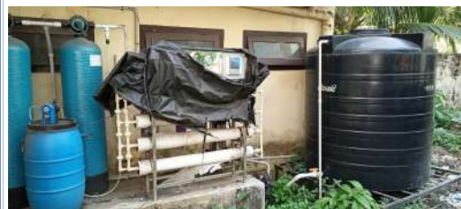
(ഉപയോഗിക്കാത്ത റിവെഴ് ഓസ്മോസിസ് പ്ലാന്റ്)

ചെയ്തിരുന്നത് ശ്രദ്ധിക്കുകയും വെള്ളം ശേഖരിക്കുന്ന ടാങ്ക്, മോട്ടോർ പമ്പ് എന്നിവ അടങ്ങുന്നതാണ് ഒരു യൂണിറ്റ്. ലക്ഷങ്ങൾ ചെലവഴിച്ചു സ്ഥാപിച്ച പ്ലാന്റുകൾ പ്രവർത്തനക്ഷമമാക്കുവാൻ നഗരസഭ അധികൃതർ സ്വീകരിച്ച നടപടികൾ അടിയന്തിരമായി അറിയിക്കണമെന്നാവശ്യപ്പെട്ടുകൊണ്ട് നൽകിയ ഓഡിറ്റ് എൻക്വയറിയിൽ (നം:44/2019-20;16.01.2021.) എഞ്ചിനീയറിംഗ് വിഭാഗം ഉദ്യോഗസ്ഥർ മറുപടി നൽകിയിട്ടില്ല.