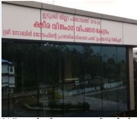
3-1-2) വാത്തിക്കടി ഗ്രാമ പഞ്ചായത്ത് - ക്ഷീരവിജ്ഞാന കേന്ദ്രം , മുരിക്കാശ്ശേരി

(എ) ക്ഷീരവിജ്ഞാന കേന്ദ്രം, കെട്ടിടനിർമ്മാണം