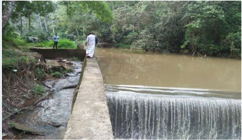
തദ്ദേശസ്വയംഭരണസ്ഥാപനങ്ങൾ വാർഷിക പദ്ധതിയുടെ ഭാഗമായി ആവിഷ്കരിക്കുന്ന ബ്രഹ്മത്ത് പദ്ധതികൾ പരമാവധി ആളുകൾക്ക്

4. കൂട്ടാർ തോടിന് ഏകദേശം 25 മീറ്റർ വീതിയുള്ള ഭാഗത്താണ് തടയണ നിർമ്മാണം നടന്നിട്ടുള്ളത്. തടയണയുടെ നീളം കേവലം 20 മീറ്ററും. അതിന്റെ വിംഗ് വാൾ പ്രബലിത കോൺക്രീറ്റിനു പകരം കല്ലുകൊണ്ടാണ് നിർമ്മിച്ചിരിക്കുന്നത്. തോടിന്റെ സ്വാഭാവിക വീതിയും ഒഴുക്കും പരിഗണിക്കാതെ നിർമ്മിച്ച ഒരു വശത്തെ വിംഗ് വാൾ മഴക്കാലത്ത് പൂർണ്ണമായും തകരുകയും കരാറുകാരൻ സ്വന്തം നിലയ്ക്ക് വീണ്ടും നിർമ്മിക്കുകയുമായിരുന്നു. ഇപ്രകാരം നിർമ്മിച്ച കൽക്കെട്ടിനിടയിലൂടെയാണ് ജലം ഇപ്പോഴും ഒഴുകുന്നത്. ശക്തമായ മഴയിൽ തടയണ ഈ കെട്ടുൾപ്പെടെ തകരാനുള്ള സാധ്യതയാണ് നിലനിൽക്കുന്നത്. സൃഷ്ടിക്കുന്ന ആസ്തിയുടെ സുരക്ഷ ഉറപ്പാക്കുന്നതിനുള്ള ഇനങ്ങൾ എസ്റ്റിമേറ്റിൽ ഉൾപ്പെടുത്താതിരുന്നതിനും സൈറ്റ് സാഹചര്യങ്ങൾ പരിഗണിക്കാതിരുന്നതിന്റെയും കാരണം വ്യക്തമാക്കേണ്ടതാണ്. ചെക്ക് ഡാമിന്റെ ചിത്രം ചുവടെ ചേർക്കുന്നു.