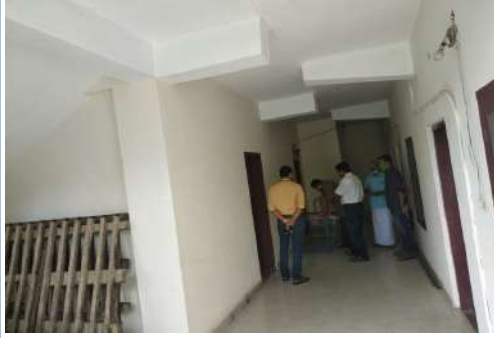
3-1-3) ഉടമ്പന്തൂർ ഗ്രാമ പഞ്ചായത്ത് - അമയപ്ര ക്ഷീര സഹകരണ സംഘം കെട്ടിട നിർമ്മാണം