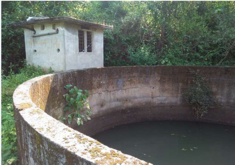
I-62 ടൈഫോർഡ് എസ്റ്റേറ്റ് എസ്.സി കോളനി കുടിവെള്ള പദ്ധതി ലക്ഷ്യം കൈവരിച്ചില്ല.