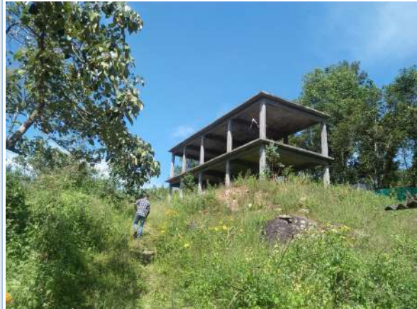
പദ്ധതി ഫലപ്രാപ്തിയിൽ എത്താത്തതിനാൽ ഈ പ്രവൃത്തിക്കായി ചെലവഴിച്ച തുക ₹976706/- ഓഡിറ്റിൽ തടസ്സപ്പെടുത്തുന്നു.

നിയന്ത്രണം മൂലം ബിൽതുക പിൻവലിക്കാൻ കഴിയാതിരുന്നതിനാൽ തൻവർഷം പ്രോജക്ട് തയ്യാറാക്കി തുക കരാറുകാരന് നൽകി പദ്ധതി പ്രവർത്തനം അവസാനിപ്പിച്ചു. (അടുത്ത സാമ്പത്തികവർഷം പ്രോജക്ട് ആസൂത്രണം ചെയ്തിട്ടില്ല.) ജില്ലാ പഞ്ചായത്ത് ഭരണസമിതിയുടെ കാലാവധി ഇതിനോടകം കഴിഞ്ഞതിനാൽ പാതിവഴിയിൽ ഉപേക്ഷിക്കപ്പെട്ട അവസ്ഥയിലാണ്. കെട്ടിടത്തിന്റെ സ്ഥലപരിശോധനാവേളയിലെ ചിത്രം ചുവടെ ചേർക്കുന്നു.