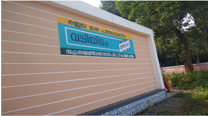
ടേക്ക് എ ബ്രേക്ക് കേന്ദ്രം

പ്രവൃത്തി പൂർത്തീകരിച്ചു എന്നറിയിച്ചതിന്റെ അടിസ്ഥാനത്തിൽ അസിസ്റ്റന്റ് എഞ്ചിനീയർ, ഓവർസിയർ, അസിസ്റ്റന്റ് സെക്രട്ടറി എന്നിവരുടെ സാന്നിധ്യത്തിൽ 24.12.2021ന് നടത്തിയ ഫീൽഡ് പരിശോധനയിൽ ടേക്ക് എ ബ്രേക്ക് കേന്ദ്രം പൂർത്തിയാക്കിയതായി കണ്ടു. മുറ്റം ടൈൽസ് പതിക്കാൻ അവശേഷിക്കുന്നുണ്ട്. ടേക്ക് എ ബ്രേക്ക് കേന്ദ്രം പ്രവർത്തനക്ഷമമാക്കിയിട്ടില്ല.