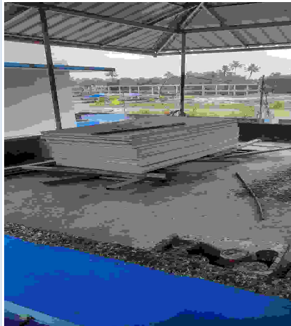
കലവൂർ പ്രാധമികാരോഗ്യ കേന്ദ്രത്തിന് മുകളിൽ അഴിച്ചുവെച്ചിട്ടുള്ള സോളാർ ഉപകരണങ്ങൾ.

സോളാർ പാനൽ വയറിംഗ് നടത്തി നെറ്റ് മീറ്റർ സ്ഥാപിച്ചിട്ടുണ്ട്. എന്നാൽ അത് പ്രവർത്തനക്ഷമമാക്കി വൈദ്യുതി ഉത്പാദനം നാളിതുവരെ ആരംഭിക്കാനായിട്ടില്ല എന്ന് ഹെഡ്മിസ്ട്രസ് അറിയിച്ചു.