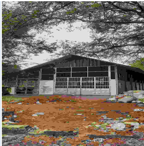
പതിനാല് ലക്ഷത്തി എൺപതിനായിരം രൂപ മുടക്കി നിർമ്മിച്ച പ്ലാസ്റ്റിക് കളക്ഷൻ സെന്റർ