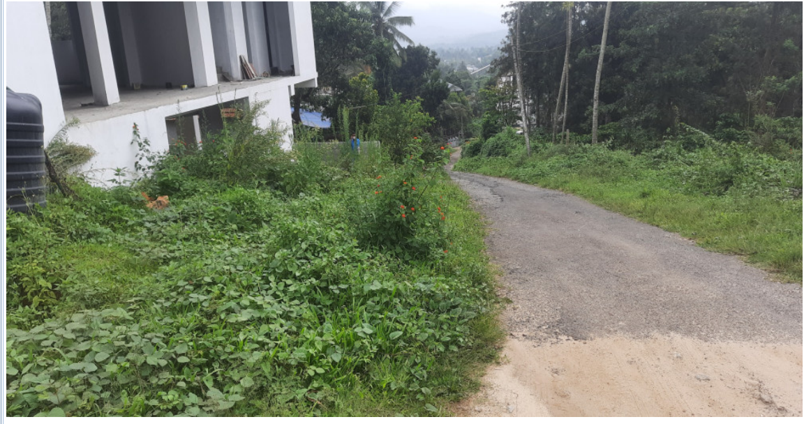
ബേബ്ബെന്റ് ഫ്ലോറിലേക്ക് ഡ്രൈവേ നിർമ്മിച്ചിട്ടുള്ളതായി പ്ലാനിൽ കാണിച്ചിട്ടുള്ള സ്ഥലം