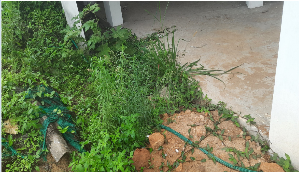
ബേസ്മെന്റ് ഫ്ലോറിലേ പാർക്കിംഗിലേക്കുള്ള ഡ്രൈവേയായി പ്ലാനിൽ രേഖപ്പെടുത്തിയ സ്ഥലം

അഗ്നി ബാധസുരക്ഷ സംവിധാനങ്ങൾ പ്രവർത്തനക്ഷമമല്ല