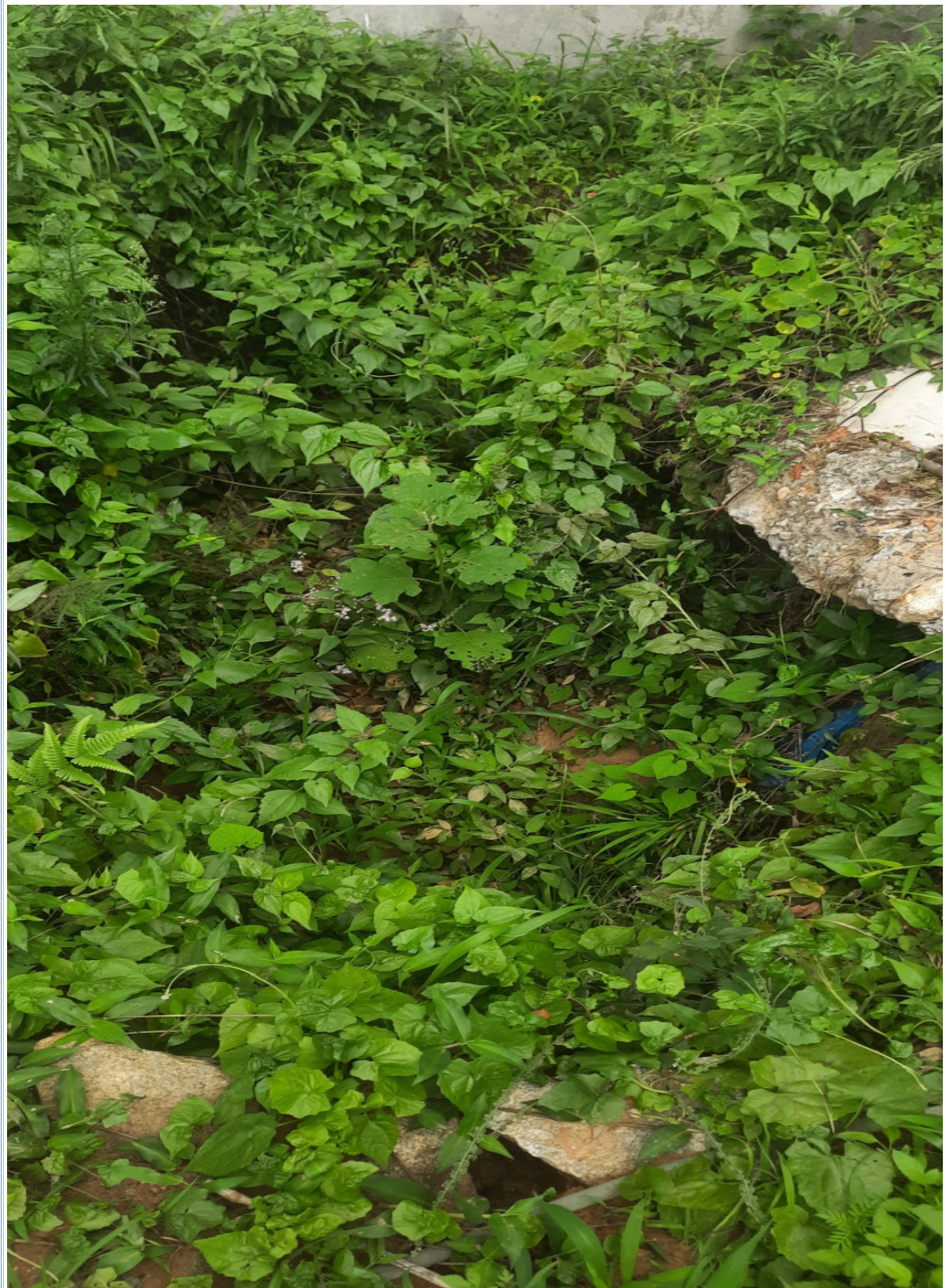
മഴവെള്ള സംഭരണി സ്ഥാപിച്ചതായി പ്ലാനിൽ രേഖപ്പെടുത്തിയിരിക്കുന്ന സ്ഥലത്തിന്റെ നിലവിലെ അവസ്ഥ കെട്ടിടത്തിൽ പാർക്കിംഗ് സംവിധാനങ്ങൾ ഏർപ്പെടുത്തിയിട്ടില്ല.

കെട്ടിടത്തിൽ മഴവെള്ള സംഭരണസംവിധാനം സ്ഥാപിച്ചിട്ടില്ല. മുൻസിപ്പാലിറ്റി കെട്ടിടനിർമ്മാണ ചട്ടങ്ങൾ 109 ബി പ്രകാരം 179.99 ച.മീ കവരേജ് വിസ്തീർണ്ണമുള്ള കെട്ടിടത്തിന് കവരേജ് വിസ്തീർണ്ണത്തിന് 25 ച.മീ പ്രകാരം 4500 ലിറ്റർ സഭരണശേഷിയുള്ള മഴവെള്ള സംഭരണി ആവശ്യമുണ്ട്. എന്നാൽ മേൽ കെട്ടിടത്തിൽ മഴവെള്ള സംഭരണത്തിനായി മേൽക്കൂരയിൽ വെള്ളപ്പാത്തി,താഴെക്കുള്ള പൈപ്പുകൾ,അരിപ്പ യൂണിറ്റ്,വെള്ളം എടുക്കുന്നതിനും വെള്ളം നിറഞ്ഞൊഴുകുന്നതിനുമുള്ള സംവിധാനത്തൊടു കൂടിയ സംഭരണ ടാങ്ക് എന്നിവ സ്ഥാപിച്ചിട്ടില്ല. മഴവെള്ള സംഭരണി നിർമ്മിച്ചിട്ടുള്ളതായി പ്ലാനിൽ രേഖപ്പെടുത്തിയിട്ടുള്ള സ്ഥലത്ത് ഒരു മൺകഴിയാണ് കണ്ടെത്താൻ കഴിഞ്ഞിട്ടുള്ളത്.