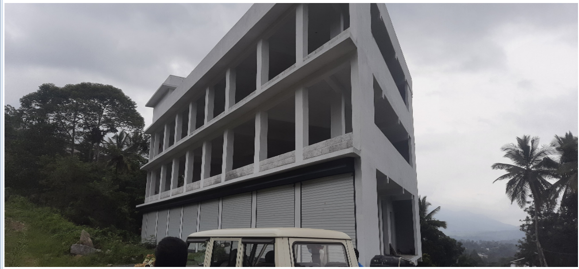
കാട്പിടിച്ച് ഉപയോഗപ്രദമല്ലാതായിരിക്കുന്ന കെട്ടിടത്തിന് മുൻഭാഗത്തെ കാർപാർക്കിംഗ്

എന്നാൽ കെട്ടിടത്തിന്റെ വടക്ക് കിഴക്ക് ഭാഗത്തായി(കെട്ടിടത്തിന്റെ മുൻഭാഗത്ത്) പാർക്കിംഗ് യൂണിറ്റുകളിലേക്കായി പ്ലാനിൽ രേഖപ്പെടുത്തിയിട്ടുള്ള 4.5 മീ വീതിയിലുള്ള ഡ്രൈവേ നിർമ്മിക്കാത്തതിനാലും മേൽ സ്ഥലം നിരപ്പാകാതെ കാടുപിടിച്ച് കിടക്കുന്നതിനാലും നിലവിൽ 1 കാർ പാർക്കിംഗ് യൂണിറ്റ് സ്ഥലം മാത്രമേ ലഭ്യമായിട്ടുള്ളൂ. ബേബ്ബെന്റ് ഫ്ലോറിലേക്ക് പ്ലാൻ പ്രകാരമുള്ള ഡ്രൈ വേ നിർമ്മിച്ചിട്ടില്ലാത്തതിനാൽ മേൽ സ്ഥലത്ത് നിലവിലുള്ള പാർക്കിംഗ് യൂണിറ്റുകളും ഇരുചക്രവാഹന പാർക്കിംഗ് സൗകര്യവും ഉപയോഗപ്രദമല്ല.