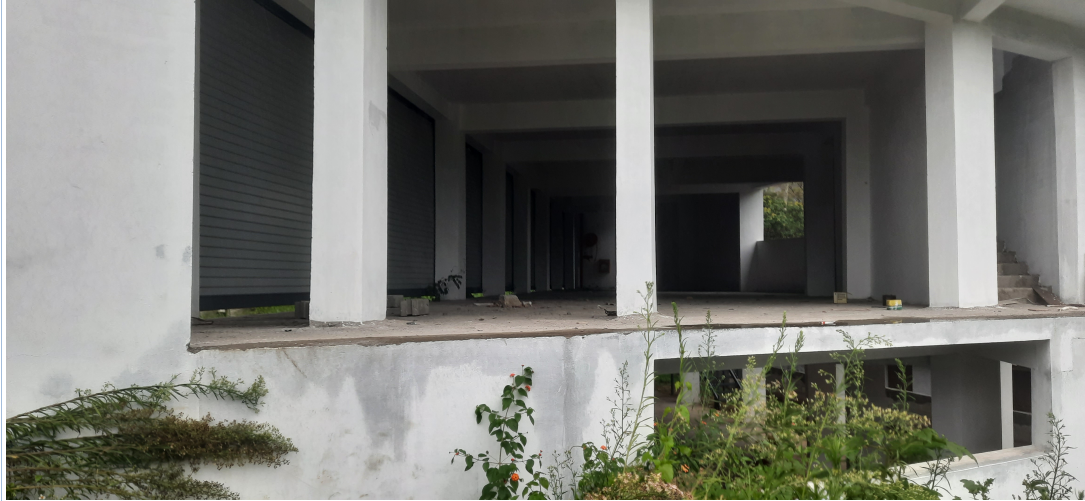
നിർമ്മാണം പൂർത്തീകരിക്കാത്ത കെട്ടിടത്തിന്റെ ഗ്രൗണ്ട് ഫ്ലോർ

പ്ലാൻ പ്രകാരം കെട്ടിടത്തിന്റെ തറനിലയിൽ 6 കടമുറികൾ നിർമ്മിച്ചിട്ടുള്ളതായി കാണിച്ചിട്ടുണ്ടെങ്കിലും .ഗ്രൗണ്ട് ഫ്ലോറിന്റെ മുൻഭാഗത്ത് റോളിങ്ങ് ഷട്ടറുകൾ സ്ഥാപിക്കുക മാത്രമാണ് കെട്ടിടത്തിൽ ചെയ്തിട്ടുള്ളത്. പില്ലറുകളും മേൽക്കൂരയും മാത്രമാണ് തറ നിലയിൽ നിർമ്മിച്ചിട്ടുള്ളത്. പ്ലാൻ പ്രകാരമുള്ള ഇട ഭിത്തികൾ വാതിലുകൾ എന്നിവയൊന്നും നിർമ്മിച്ചിട്ടില്ല. പ്ലാൻ പ്രകാരം 6 കെട്ടിട മുറികളും ടോയിലറും നിർമ്മിച്ചിട്ടുള്ളതായി രേഖപ്പെടുത്തിയിട്ടുണ്ടെങ്കിലും. മേൽ മുറികളൊന്നും ഭിത്തി കെട്ടി വേർതിരിച്ച് ഉപയോഗപ്രദമാക്കിയിട്ടില്ല.