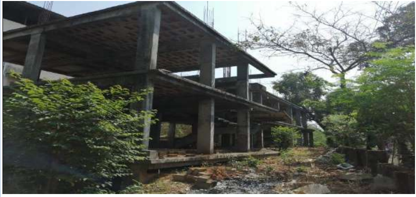
സുശാന്തം-ജില്ലാ വയോജന ക്ഷേമകേന്ദ്രം

2. വിവിധ തദ്ദേശ സ്ഥാപനങ്ങളിൽ നിന്നും ധനസഹായം സ്വീകരിക്കുന്നതിനും, സൊസൈറ്റിയായി പ്രവർത്തിക്കുന്നതിനും സർക്കാർ അംഗീകാരം ലഭിക്കാത്ത സാഹചര്യത്തിൽ പ്രയോജനമില്ലാത്ത ഒരു കെട്ടിടം നിർമ്മിക്കുന്ന ഒരു പാഴ് ചെലവ് പദ്ധതിയായി മാത്രം ഈ പ്രോജക്ട് മാറിയിരിക്കുകയാണ്. നിലവിൽ വ്യവസായ വകുപ്പിന്റെ ഉടമസ്ഥതയിലുള്ള 15 സെന്റ് സ്ഥലത്ത് ഇരു നിലകളുടെ സൂപ്പർ മാത്രം(പില്ലറുകളും ,ആർ.സി.സി.റൂഫും മാത്രം) പൂർത്തിയാക്കി മൂന്നു വർഷത്തിലധികമായി കിടക്കുന്ന ഉപയോഗശൂന്യമായ ഒരു കെട്ടിടമാണ് പദ്ധതി പ്രദേശത്തുള്ളത്.