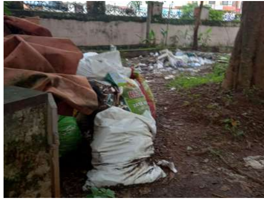
ഓഫീസിന്റെ കോമ്പൗണ്ടിലെ മാലിന്യകമ്പാരം

ജില്ലാ പഞ്ചായത്ത് ഓഫീസിന്റെ കോമ്പൗണ്ടിൽ മാലിന്യസംസ്കരണത്തിന് സംവിധാനങ്ങളില്ല. പ്രതിവർഷം 100 കോടിയിൽപ്പരം രൂപ പദ്ധതിച്ചെലവുകൾക്കായി വകയിരുത്തിവരുന്ന ജില്ലാപഞ്ചായത്തിന് സ്ഥാപനപരിസരത്ത് മാലിന്യനിക്ഷേപം കുന്നുകൂടുമ്പോൾ ഒഴിവാക്കുന്നതിന് വേണ്ട സംവിധാനങ്ങൾ ഒരുക്കാൻ നാളിതുവരെ സാധിച്ചിട്ടില്ല. ഉറവിട മാലിന്യസംസ്കരണമെന്ന ആശയം നടപ്പാക്കുന്നതിൽ ജില്ലാപഞ്ചായത്ത് പോലുള്ള സ്ഥാപനങ്ങൾ പൊതുജനങ്ങൾക്ക് മാതൃകയാകേണ്ടതാണ്. ഇക്കാര്യം ജില്ലാപഞ്ചായത്ത് അധികാരികളുടെ ശ്രദ്ധയിൽപ്പെടുത്തുന്നു. ഓഫീസ് പരിസരം വൃത്തിയാക്കിയിരിക്കുന്നതിനവേണ്ട മാലിന്യ നിർമ്മാർജ്ജന- സംസ്കരണ സ്ഥിരസംവിധാനങ്ങൾ രൂപീകരിക്കാൻ നടപടികൾ സ്വീകരിക്കേണ്ടതാണ്.