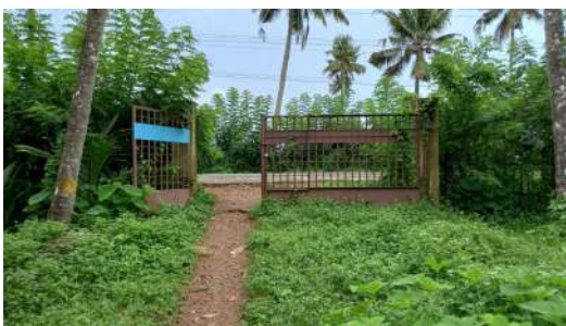
റോഡിന് അഭിമുഖമായുള്ള ഗേറ്റ്