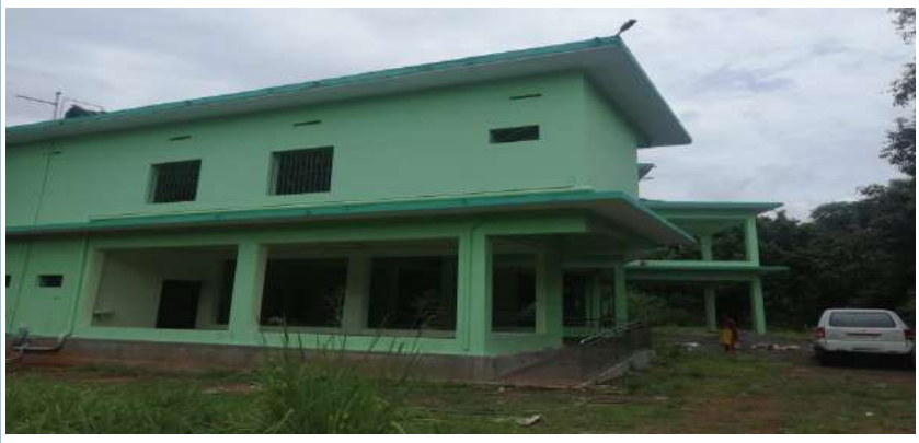
ശുഭാപ്തി- ജില്ലാഭിന്നശേഷി വിഭവകേന്ദ്രം

പദ്ധതിയുടെ ഭാഗമായി 2017 ൽ നിർമ്മാണം ആരംഭിച്ച കെട്ടിടത്തിന് ഇരുനിലകളിലായി 1199.83ച.മീറ്റർ വിസ്തൃതിയുണ്ട്. (ഗ്രൗണ്ട് ഫ്ലോർ 620.49ച.മീ+ഒന്നാം നില 579.34ച.മീ.) കെട്ടിട നിർമ്മാണം പൂർത്തീകരിച്ച് ഒക്കുപൻസി സർട്ടിഫിക്കറ്റിനായി നഗരസഭാ സെക്രട്ടറിക്ക് 2/11/2021 ന് കത്ത് നൽകിയതായി ഫയലിൽ കാണുന്നു. ചെയ്ത പ്രവൃത്തികളുടെ ഫൈനൽ ബിൽ തയ്യാറാക്കിയിട്ടില്ല. അതേ സമയം ചുറ്റുമതിൽ, റോഡ്, ഗേറ്റ്, ട്രസ്റ്റ് വർക്ക് റോഡ് തുടങ്ങിയ അനുബന്ധ സംവിധാനങ്ങൾ ഏർപ്പെടുത്തുന്നതിന് 225 ലക്ഷം രൂപകൂടി ആവശ്യമാണെന്ന് കാണിച്ച് 12.10.2021 ന് കൊടകര സെക്ഷൻ അസിസ്റ്റന്റ് എഞ്ചിനീയർ കത്ത് നൽകിയിട്ടുണ്ട്.