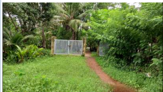
ഫാമിന്റെ പുറകിലെ ഗേറ്റ്

ഫാം ഓഫീസിനു വശത്തായി റോഡിനോട് ചേർന്ന് കിടക്കുന്ന തെങ്ങിൻ തൈകളുള്ള ഭാഗത്ത് പറമ്പിന്റെ നടുവിലൂടെ ഒരു വഴിക്ക് സ്ഥലം വിട്ട് ആയതിന്റെ മുൻപിലുംപുറകിലുമായി ആണ് ഗേറ്റുകൾ സ്ഥാപിച്ചിട്ടുള്ളത്. പറമ്പിനു പുറകിൽ താമസിക്കുന്നവരുടെ ആവശ്യത്തിനായി ഈ ഗേറ്റുകൾ എല്ലായ്പ്പോഴും തുറന്നിടുന്നതായും ഫാം ജീവനക്കാരിൽ നിന്നും അറിയാനായി. കൂടാതെ കോമ്പൗണ്ട് വാൾ ഇല്ല. ഇക്കാരണങ്ങളാൽ പ്രസ്തുതഭാഗത്ത് ഗേറ്റ് സ്ഥാപിച്ചതുകൊണ്ട് യാതൊരു പ്രയോജനവും ഫാമിന് ലഭിക്കുന്നില്ല.