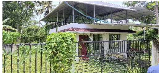
വനിതാ ക്യാന്റിൻ കെട്ടിടം കാട്ടു മുടിയ നിലയിൽ

കൊല്ലമ്പുഴ പാർക്ക് കെട്ടിടത്തിനോട് ചേർന്ന് വനിതാ ക്യാന്റിൻ, അടിസ്ഥാന സൗകര്യ വികസനത്തിനായി 231137/- രൂപ ചെലവാക്കി നിർമ്മാണപ്രവർത്തനങ്ങൾ പൂർത്തിയാക്കിയിട്ടുണ്ട്. ഓഡിറ്റ് ടീം 08.7.2022 ന് പ്രസ്തുത കെട്ടിടം സന്ദർശിക്കുകയുണ്ടായി. നിലവിൽ കെട്ടിടവും സമീപത്തെ പാർക്കും കാട് പിടിച്ച് പൊതുജനങ്ങൾക്ക് ഉപകാരമില്ലാത്ത രീതിയിൽ നിഷ്ഠിത ആസ്തിയായി കാണപ്പെട്ടു. നിർമ്മാണം പൂർത്തിയാക്കിയിട്ടും കെട്ടിടവും പാർക്കും തുറന്നു പ്രവർത്തിപ്പിക്കാത്തതിന് വിശദീകരണം ലഭ്യമാക്കുന്നതിനായി നൽകിയ ഓഡിറ്റ് എൻക്വയറിക്ക് (നമ്പർ 79/08.07.2022) മറുപടിയായി പ്രസ്തുത സ്ഥാപനങ്ങൾ തുറന്ന് പ്രവർത്തിപ്പിക്കുന്നതിനുള്ള നടപടികൾ സ്വീകരിച്ചുവരുന്നതായി അറിയിച്ചിട്ടുണ്ട്. പ്രസ്തുത സ്ഥാപനങ്ങൾ തുറന്നു പ്രവർത്തിപ്പിച്ചു ജനങ്ങൾക്ക് പ്രയോജനകരമാക്കുന്നതിനുള്ള നടപടി സ്വീകരിക്കണമെന്ന് ഓഡിറ്റ് നിർദ്ദേശിക്കുന്നു. ഭരണ സമിതിയുടെ ശ്രദ്ധ ഈ വിഷയത്തിൽ ക്ഷണിക്കുന്നു.