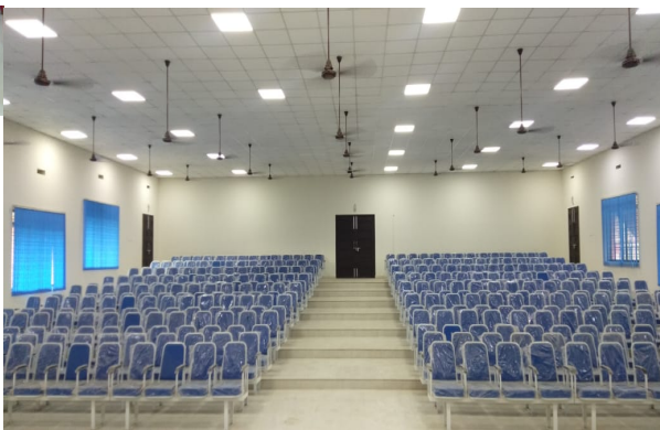
താഴത്തെ നില- എ.സി. ഹാൾ