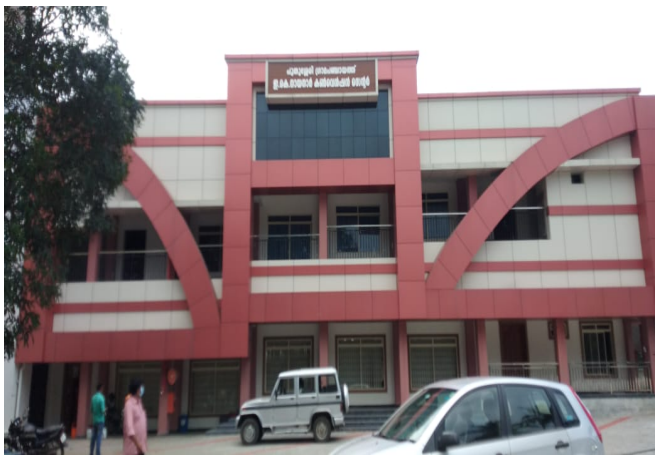
പഞ്ചായത്ത് കല്യാണ മണ്ഡപം

3). പഞ്ചായത്തിന്റെ ആസ്തിയായുള്ള കടമുറികളുടെ അടിസ്ഥാന വിവരങ്ങളടങ്ങിയ രജിസ്റ്റർ സൂക്ഷിച്ചിട്ടില്ല. പഞ്ചായത്തിലെ വാടക രജിസ്റ്റർ പ്രകാരം ഷോപ്പിംഗ് കോംപ്ലക്സിലെ 19/490 ,19/491, 19/492 എന്നീ കടമുറികൾ വാടകയ്ക്ക് നൽകിയിട്ടുണ്ട്. കൂടാതെ പുതുശ്ശേരിയിൽ സാംസ്കാരികനിലയം വാടകക്ക് നൽകിയതിന്റെയും വാർഷികകണക്കിൽ വരവുണ്ട്. കൂടാതെ പഞ്ചായത്തിന്റെ ഉടമസ്ഥതയിൽ ഇ.കെ നായനാർ സ്മാരക കൺവൻഷൻ സെന്റർ / കല്യാണമണ്ഡപം വാടകക്കു നൽകാനായി നിർമ്മാണം പൂർത്തിയായിട്ടുണ്ട്. ഓഡിറ്റ് വർഷം വരെയുള്ള ചെലവ് ₹65112912/- ആണ്. ഓഡിറ്റ് കാലയളവിൽ കെട്ടിടം നിർമ്മാണം പൂർത്തിയാക്കിയിട്ടുണ്ട്.