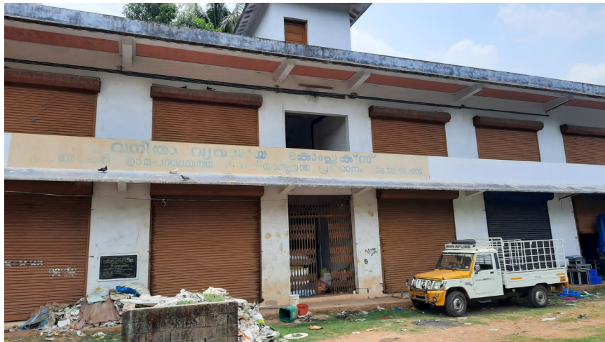
കൂർക്കഞ്ചേരി മേഖലാ കാര്യാലയം, കമ്മ്യൂണിറ്റി ഹാൾ