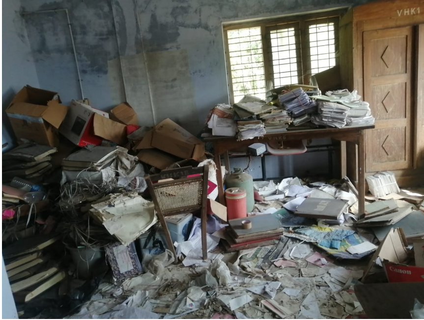
. വെറ്ററിനറി അശുപത്രിയിൽ വെയ്സുകൾ കുന്നുകൂടിയ നിലയിൽ

ഭിത്തിയിൽ നനവ് നിലനിൽക്കുന്ന അവസ്ഥയിലാണ് ഉള്ളത്. മേൽ വിഷയങ്ങൾ ചൂണ്ടിക്കാണിച്ച് നൽകിയ ഓഡിറ്റ് എൻക്വയറി നം.11,12 /24.11.22 ന് മറുപടി നൽകിയിട്ടില്ല. അധികാരികളുടെ ശ്രദ്ധ ഈ വിഷയത്തിലേയ്ക്ക് ക്ഷണിക്കുന്നു.