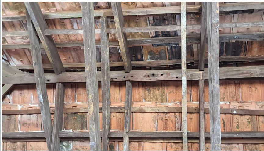
. കൂടൽ ജംഗ്ഷൻ ഗവ. എൽ.പി.സ്കൂളിലെ ഉത്തരങ്ങൾ വണ്ടുകൾ തുളച്ച് അപകടകരമായ നിലയിൽ

കൂടൽ ജംഗ്ഷൻ ഗവ.എൽ പി സ്കൂളിൽ 2016-17 കാലഘട്ടം മുതൽ തടികൾ തുരക്കുന്ന വലിയ വണ്ടിന്റെ ശല്യം നേരിട്ടുവരുന്നുണ്ട്. വണ്ടുകൾ വരാന്തയിലും ക്ലാസ് മുറിക്കകത്തുമുള്ള ഉത്തരങ്ങളും കഴക്കോലുകളും തുരന്ന് കൂട്ടുകൂട്ടിവലിയതോതിൽ പെറ്റുപെരുക്കി തടികൾക്ക് ബലക്ഷയം വന്ന് മേൽക്കൂര താഴെ വീഴുന്ന അവസ്ഥയിലാണെന്ന് ഹെഡ്മാസ്റ്റർ അറിയിച്ചിട്ടുണ്ട്. പ്രീ പ്രൈമറിതലം മുതൽ അഞ്ചാം ക്ലാസുവരെയുള്ള ഏകദേശം നാലു വയസ്സുമുതൽ പത്ത് വയസ്സുവരെ പ്രായമുള്ള 51 പിഞ്ചു ബാലികാബാലന്മാർ പഠിക്കുന്ന വിദ്യാലയം അപകടനിലയിലാണെന്നുള്ളത് അത്യന്തം ഗൗരവമുള്ള വിഷയമാണ്. കുട്ടികളുടെ സുരക്ഷ ഉറപ്പുവരുത്തേണ്ടത് പഞ്ചായത്തിന്റെ ഉത്തരവാദിത്വമാണ്. സ്കൂളിന്റെ അപകടാവസ്ഥ പരിഹരിക്കുന്നതിന് അടിയന്തര നടപടികൾ സ്വീകരിക്കേണ്ടതാണ്.