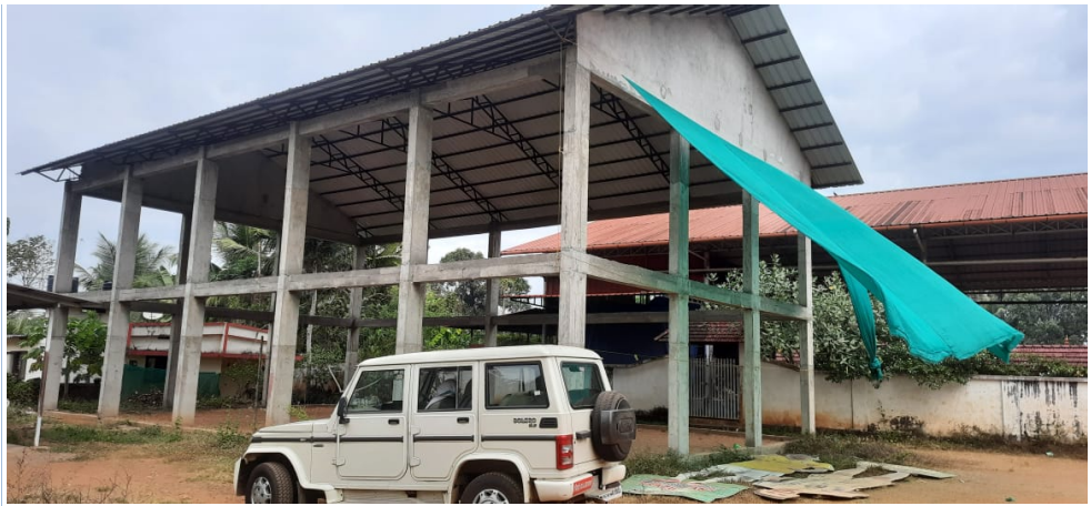
തൃക്കേൽ സ്റ്റേഡിയം - നിലവിലെ അവസ്ഥ