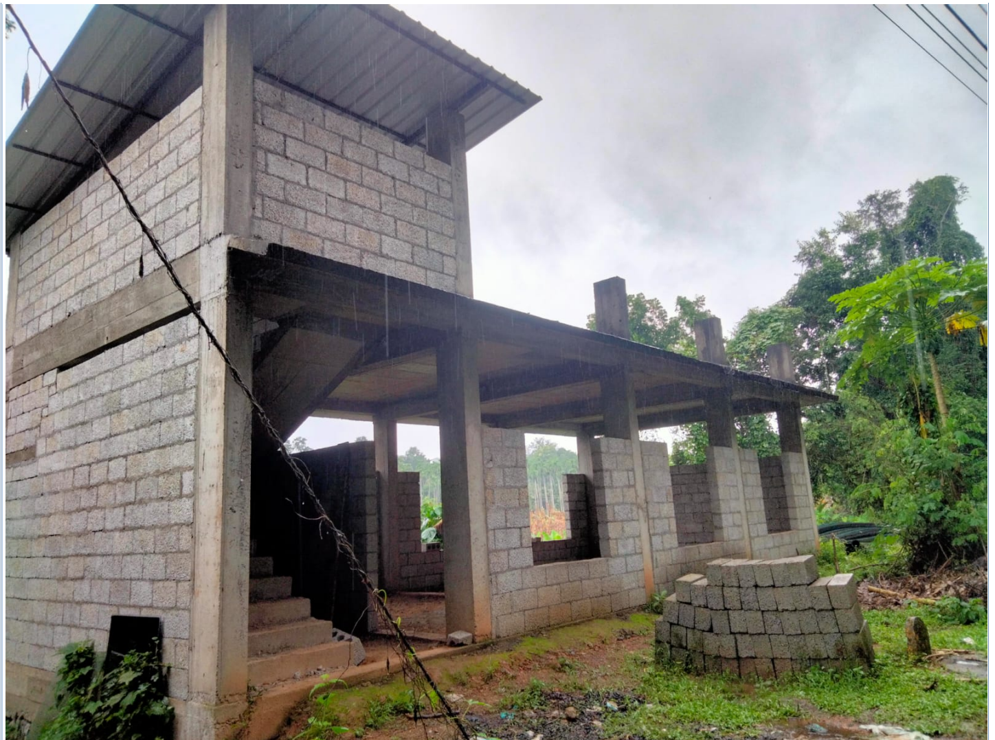
1-20 വിവിധ കുടിവെള്ള പദ്ധതികൾക്ക് മോട്ടോർ വാങ്ങൽ - ടെണ്ടർ നടപടികൾ സ്വീകരിക്കാത്തതിനാൽ റെയിഡ്കോയ്ക്ക് അധികനിരക്ക് നൽകി

സെക്രട്ടറി നിർവ്വഹണ ഉദ്യോഗസ്ഥനായി വിവിധ കുടിവെള്ള പദ്ധതികളുടെ മോട്ടോർ വാങ്ങൽ എന്ന പ്രോജക്ട് മുഖേന കൂടാതെപോയിൽ കുടിവെള്ള പദ്ധതിക്ക് മോട്ടോർ സ്ഥാപിച്ചതിന് താഴെ പറയുന്ന പ്രകാരം 136075 രൂപ ചെലവഴിക്കുകയുണ്ടായി. പ്രോജക്ട് പ്രകാരം മോട്ടോറുകളും അനുബന്ധ ഉപകരണങ്ങളും വിതരണം ചെയ്ത് മോട്ടോറുകൾ ഇൻസ്റ്റാൾ ചെയ്യുന്നതിന് അക്രഡിറ്റഡ് ഏജൻസിയായ റെയ്ഡ്കോയെ നേരിട്ട് ഏല്പിക്കുകയും അവർ സമർപ്പിച്ച കാഷ് ഇൻവോയ്സ് പ്രകാരം തുക നൽകി പദ്ധതി പൂർത്തീകരിക്കുകയാണ് ചെയ്തിട്ടുള്ളത്. ചെലവിന്റെ വിശദാംശങ്ങൾ താഴെ കൊടുക്കുന്നു.