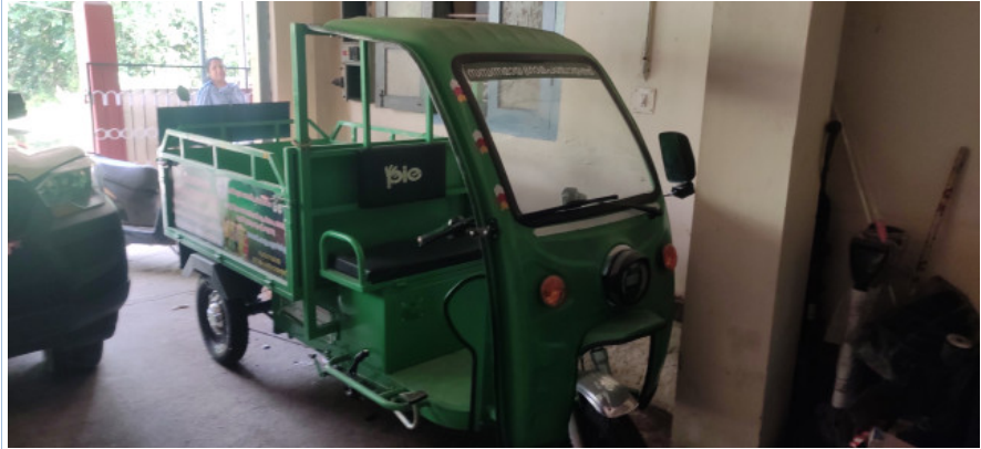
പഞ്ചായത്ത് കോമ്പൗണ്ടിൽ പ്രവർത്തനം ഇല്ലാതെ കിടക്കുന്ന ഇ-കാർട്ട് വാഹനം

മാലിന്യ നീക്കവും നടത്താൻ ടി വാഹനം പര്യാപ്തമല്ലായെന്ന് പ്രാദേശിക അന്വേഷണത്തിൽ ബോധ്യപ്പെട്ടു. ഗ്രൗണ്ട് ക്ലിയറൻസ് കുറവായ വാഹനത്തിന് ഖരമാലിന്യം ഉൾക്കൊള്ളാനുള്ള ശേഷിയും ലോഡുമായി കയറ്റം കയറാനുള്ള ശേഷിയും കുറവാണെന്നും വളരെക്കുറഞ്ഞ അളവിലുള്ള പ്ലാസ്റ്റിക് മാലിന്യങ്ങളേ ഈ വാഹനത്തിൽ ഓരോ ടിപ്പിലും കൊണ്ടുപോകാൻ സാധിക്കൂ എന്നും ഹരിത കർമ്മസേനാംഗങ്ങൾ അറിയിച്ചിട്ടുണ്ട്. ഹരിത കർമ്മസേനാംഗങ്ങളിൽ ആർക്കും തന്നെ വാഹനം ഓടിക്കാനുള്ള ലൈസൻസ് ഇല്ല. മാലിന്യ നീക്കത്തിനായി നിലവിൽ ഹരിത കർമ്മ സേന വാഹനം പുറത്ത് നിന്ന് വാടകയ്ക്കടുക്കുകയാണ് ചെയ്തു വരുന്നത്. വാഹനം വാങ്ങുന്നതിന് മുമ്പായി ടി വാഹനം പഞ്ചായത്തിലെ മാലിന്യ നീക്കത്തിന് പര്യാപ്തമാണോയെന്ന് പ്രാഥമിക പരിശോധന നടത്താതെയാണ് വാങ്ങൽ നടത്തിയത്. നിലവിൽ ടി വാഹനം പഞ്ചായത്ത് കോമ്പൗണ്ടിൽ വെറുതെ കിടക്കുകയാണ്. മേൽ വിഷയങ്ങൾക്ക് നൽകിയ ഓഡിറ്റ് അന്വേഷണക്കുറിപ്പിന് (നം.15./09.08.2023) വാഹനം ഉപയോഗിക്കാനാവശ്യമായ നടപടി സ്വീകരിക്കുമെന്ന് അറിയിച്ചിട്ടുണ്ട്. പ്രോജക്ട് ആസൂത്രണത്തിലും നിർവഹണത്തിലും മോണിറ്ററിംഗിലും പൂർണ്ണമായി വിഴ്ചയുണ്ടായതായി ഓഡിറ്റിൽ വിലയിരുത്തുന്നു.