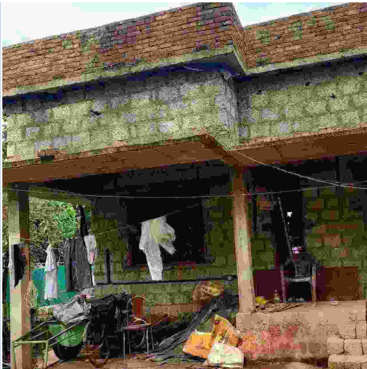
ഗുണഭോക്താക്കൾക്ക് നൽകിയ തുകയുടെ വിശദാംശം ചുവടെ ചേർക്കുന്നു