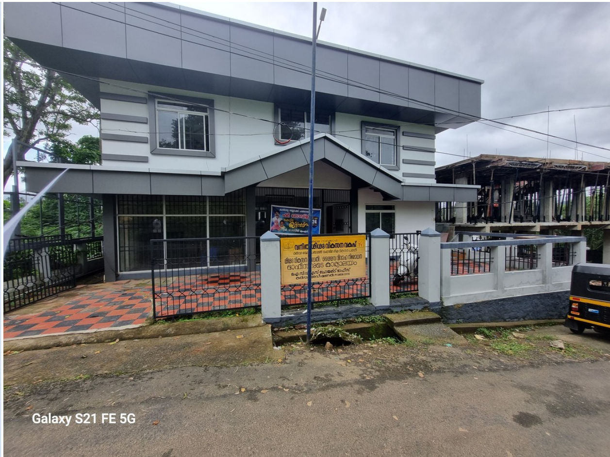
Galaxy S21 FE 5G

ഷി ലോഡ്ജ് കെട്ടിടം (ബാനറിൽ ഷി ലോഡ്ജ് ഉൾലാടനം ചെയ്തു എന്നാണുള്ളത്. വനിത ശിശുവികസന വകുപ്പിന്റെ ബോർഡ് കാണാം)