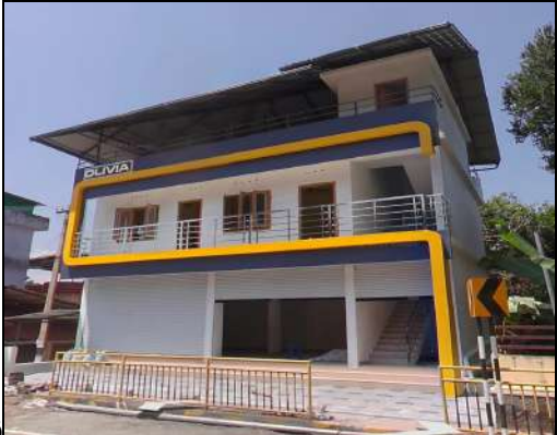
അനധികൃത നിർമ്മാണം വ്യക്തമാക്കുന്ന ചിത്രങ്ങൾ

നിർമ്മിച്ചിട്ടുള്ളതായും പഞ്ചായത്തിൽ നിന്നുള്ള ഒക്യുപൻസിയോ കെട്ടിട നമ്പറോ വാങ്ങാതെ വാടകയ്ക്ക് നൽകിയിട്ടുള്ളതായും ശ്രദ്ധയിൽപ്പെട്ടു. കെട്ടിടത്തിന്റെ സെല്ലാർ നിലയിൽ ദുരപരിധി പാലിക്കാതെയും അനുമതി വാങ്ങാതെയും കിണർ നിർമ്മിക്കുകയും കെട്ടിടത്തിന്റെ വശങ്ങളിൽ നിയമാനുസൃതം ഒഴിച്ചിടേണ്ട തുറസ്സായ സ്ഥലങ്ങളിൽ അനധികൃത നിർമ്മാണം നടത്തുകയും ചെയ്തിട്ടുണ്ട്. ഭിന്നശേഷിക്കാർ, മുതിർന്ന പൗരന്മാൻ, കുട്ടികൾ എന്നിവർക്ക് സൗകര്യപ്രദമായി പ്രവേശിക്കുന്നതിന് ചട്ടം 42(2) പ്രകാരം കെട്ടിടത്തിന്റെ മെയിൻ എൻട്രൻസിലേക്ക് നിർമ്മിക്കേണ്ട റാമ്പ് നിർമ്മിച്ചിട്ടുമില്ല. കൂടാതെ കെട്ടിടത്തിന്റെ ടെറസ്സിൽ അനധികൃതമായി ഷീറ്റ് മേൽക്കൂര നിർമ്മിച്ചിട്ടുമുണ്ട്. കേരള പഞ്ചായത്ത് രാജ്(കെട്ടിട നിർമ്മാണ ചട്ടങ്ങൾ) 2019, ചട്ടം 74(6) പ്രകാരം മൂന്നു നിലകൾ വരെയുള്ളതും 10മീറ്ററിൽ കൂടുതൽ ഉയരമില്ലാത്തതുമായ ഏകകുടുംബ വാസഗൃഹങ്ങൾ ഒഴികെയുള്ള മറ്റൊരു ഒക്യുപൻസിയ്ക്ക് കീഴിലുള്ള കെട്ടിടങ്ങളുടെയും ടെറസ്സിലുള്ള അധിക ഷീറ്റ്/ഓട് മേൽക്കൂര നിർമ്മാണം മറ്റൊരു നിലയായി പരിഗണിക്കേണ്ടതും ഈ ചട്ടങ്ങൾ പ്രകാരമുള്ള എല്ലാ നിർബന്ധിത ആവശ്യകതകളും കണക്കാക്കുന്നതിനായി ഉൾപ്പെടുത്തേണ്ടതുമാണ്.