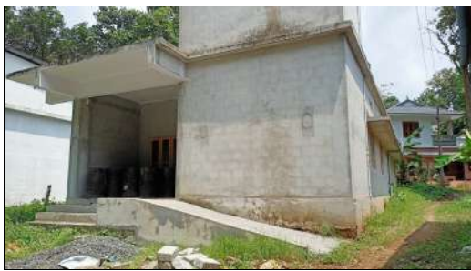
(നിർമ്മാണം നടക്കുന്ന കൃഷി ഓഫീസ് കെട്ടിടം)

2020-21, 2021-22, 2022-23 എന്നീ മൂന്നു സാമ്പത്തിക വർഷങ്ങളിലായി നിർമ്മാണം നടത്തിയിട്ടും കൃഷി ഓഫീസ് നിർമ്മാണം പൂർത്തീകരിക്കാൻ കഴിഞ്ഞിട്ടില്ല എന്നു ഓഡിറ്റ് നേരിട്ടു നടത്തിയ പരിശോധനയിൽ ബോധ്യപ്പെട്ടു. കൃഷി ഭവൻ കെട്ടിട നിർമ്മാണത്തിനു ആകെ 28.26 ലക്ഷം രൂപ (₹2826893) ഇതു വരെ ചെലവഴിച്ചിട്ടുണ്ട്. നിലവിലുള്ള കൃഷി ഭവൻ ഓഫീസ് വാടകയ്ക്കാണ് പ്രവർത്തിക്കുന്നത്. ഈ കെട്ടിടത്തിൽ വലിയതോതിലുള്ള ചോർച്ച ഉള്ളതിനാൽ ജീവനക്കാരുടെ പൊതുജനങ്ങളും ദുരിതത്തിലുമാണ്.