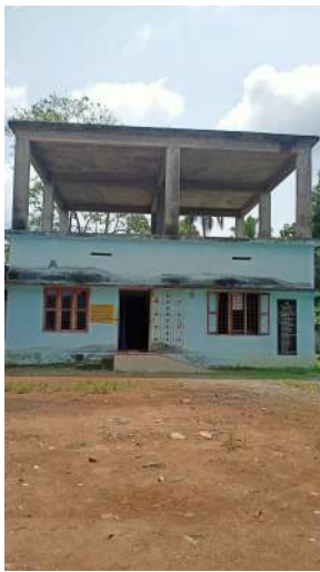
ചെലവിന്റെ വിശദാംശങ്ങൾ ചുവടെ ചേർക്കുന്നു.

2018-19 മുതലുള്ള അഞ്ചു സാമ്പത്തിക വർഷങ്ങളിലായി 20.92 ലക്ഷം രൂപ ചെലവഴിച്ച് കെട്ടിടം നിർമ്മാണം നടത്തിയിട്ടും ബഡ്ജറ്റ് സ്കൂൾ പ്രവർത്തനം തുടങ്ങിയിട്ടില്ല എന്നു നേരിട്ടു നടത്തിയ പരിശോധനയിൽ ബോധ്യപ്പെട്ടു. കെട്ടിടത്തിന്റെ ഒന്നാം നില പില്ലറും കോൺക്രീറ്റ് റൂഫിംഗും നടത്തിയ ശേഷം ഉപയോഗശൂന്യമായി കിടക്കുന്നതായി കണ്ടു. നിലവിൽ താഴത്തെ നില കെട്ടിടം BRC അധികൃതർ, കോന്നി സബ് ജില്ലയിലെ ശാരീരിക വൈകല്യമുള്ള കുട്ടികൾക്ക് ഫിസിയോതെറാപ്പി സെന്റർ ആയി ഉപയോഗിച്ചു വരുന്നുണ്ട്. ഇതു തന്നെ ആഴ്ചയിൽ ഒന്നോ രണ്ടോ ദിവസങ്ങളിൽ മാത്രമാണ് നടത്തുന്നത്.