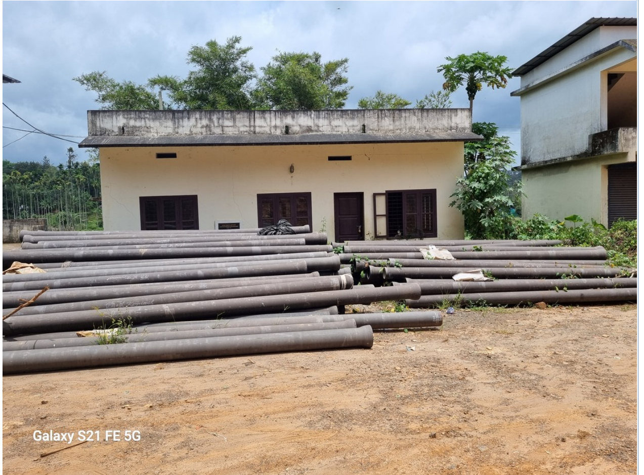
Galaxy S21 FE 5G

04/09/2023- ന് നടത്തിയ സ്ഥല പരിശോധനയിൽ എസ്റ്റിമേറ്റ് പ്രകാരമുള്ള പ്രവൃത്തികൾ(ടോയിലറ്റ് പ്രവൃത്തികൾ) തൃപ്തികരമായി പൂർത്തിയാക്കിയിട്ടുണ്ട് എന്ന് ബോധ്യപ്പെട്ടിട്ടുണ്ട്.എന്നാൽ, പകൽ വീട് ഉപയോഗ ക്ഷമമല്ല. പകൽ വീടിന് മുൻപിൽ ജലനിധിയുടെ പൈപ്പുകൾ ഇറക്കി വാതിൽ പൂട്ടിയിട്ടിരിക്കുകയാണ്. മുൻ വശം കാട്ടു പിടിച്ചു കിടക്കുകയാണ്.