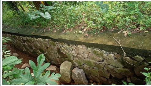
(മാമ്പിലാക്കാവ് ഏലാ തോഡ് സൈഡ് കെട്ട്)

പ്രൊജക്ട് നം 146/2022-23, മാമ്പിലാക്കാവ് ഏലാ തോഡ് സൈഡ് കെട്ട്, 209/2022-23, കോയ്പള്ളി മല ആമ്പല്ലൂർക്കുഴി പാറവിള റോഡ് സംരക്ഷണഭിത്തി, 220/2022-23, കൊട്ടാരം പടി കഴിയത്ത് പടി റോഡ് സൈഡ് കെട്ട് എന്നീ സംരക്ഷണഭിത്തി നിർമ്മാണങ്ങളിൽ ബോണ്ട്സ്റ്റോൺ ഉപയോഗിച്ചിട്ടില്ല എന്നു ബോധ്യപ്പെട്ടിട്ടുണ്ട്.