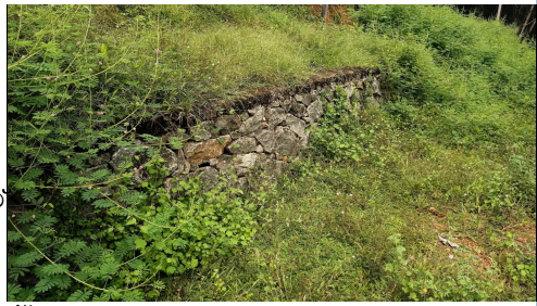
(കൊട്ടാരം പടി കഴിയത്ത് പടി റോഡ്)

പ്രൊജക്ട് നം 180/2022-23, മാങ്കുളം കോട്ടമുകൾപ്പടി റോഡ് സൈഡ് കെട്ട് എന്ന പ്രവൃത്തിയിൽ ഏതാനും ബോണ്ട് സ്റ്റോൺ ഉപയോഗിച്ചിട്ടുണ്ട്. മെഷർമെന്റ് ബുക്ക് പ്രകാരം 40.331 M3 കല്ല് കെട്ടിനു 282 ബോണ്ട് സ്റ്റോണുകൾ ഉപയോഗിക്കേണ്ടതാണ്. എന്നാൽ 50 ൽ താഴെ എണ്ണം ബോണ്ട് സ്റ്റോണുകളാണ് ഓഡിറ്റിനു പ്രാഥമികമായി കാണാൻ കഴിഞ്ഞിട്ടുള്ളത്.