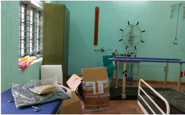
7.അപാകത സംബന്ധിച്ച് നൽകിയ