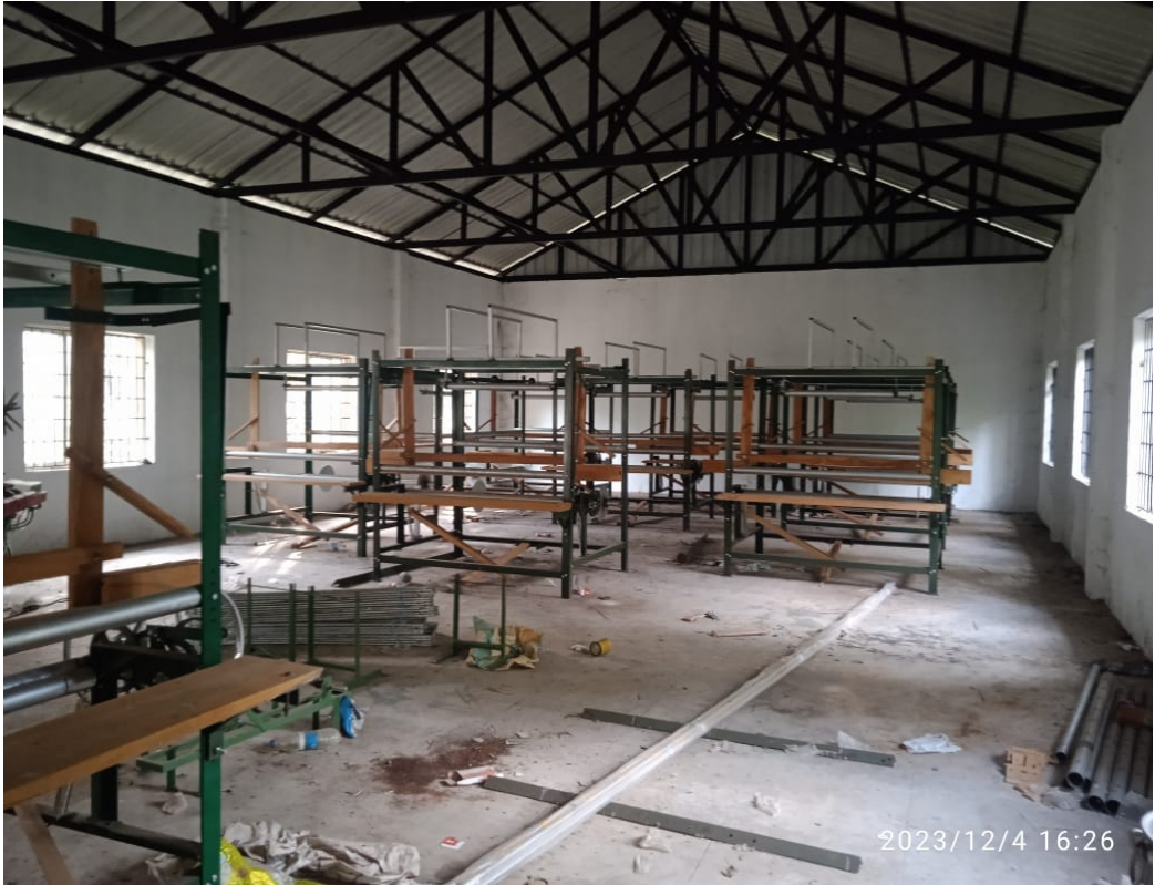
(വളയം മഞ്ചാംതറ തറിയൂണിറ്റ് പ്രവർത്തനം ആരംഭിക്കാത്ത നിലയിൽ)

സ.ഉ (സാധാ) 1400 ത.സ.പ.ഭ.വ തി. 26.7.2020 ഉത്തരവ് പ്രകാരം ഖാദി യൂണിറ്റുകൾക്ക് ഖാദി ഗ്രാമ വ്യവസായ കെട്ടിടനിർമ്മാണത്തിനും അറ്റകുറ്റപ്പണികൾ നടത്തുന്നതിനും ,ചർക്കകളും തറികളും മറ്റ് ഉപകരണങ്ങൾ വാങ്ങി നൽകുന്നതിനും സബ്സിഡി നൽകി ഉത്തരവായിട്ടുണ്ട്. 2022-23 വർഷം വളയം മഞ്ചാംതറ യൂണിറ്റിന് പുതിയ പത്ത് തറികൾ ലഭിച്ചെങ്കിലും 4.12.2023 ന് യൂണിറ്റ് നേരിൽ സന്ദർശിച്ചതിൽ തറിയൂണിറ്റ് പ്രവർത്തനം ആരംഭിച്ചിട്ടില്ല എന്ന് കണ്ടു. തൊഴിലാളികളെ കണ്ടെത്തുന്നതിന് അപേക്ഷ സ്വീകരിച്ചിട്ടുണ്ടെന്ന് പരിശീലക മറുപടി നൽകിയിട്ടുണ്ട്. തൊഴിലാളികളെ കണ്ടെത്താതെയും ആവശ്യകത നിർണ്ണയിക്കാതെയുമാണ് തറികൾ വാങ്ങിയത് . മാത്രമല്ല കെട്ടിടത്തിന്റെ മുകൾ നിലയിൽ വൈദ്യുതി ലഭിച്ചിട്ടില്ല, ആവശ്യത്തിനുള്ള ഫർണിച്ചറും ഇല്ല. യൂണിറ്റുകൾക്കുള്ള അടിസ്ഥാന സൗകര്യങ്ങൾ ഒരുക്കാതെയാണ് തറികൾ വാങ്ങിയത്.