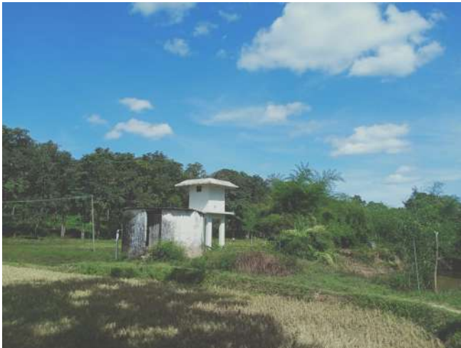
പുഴക്കരയിൽ പണിതീർത്ത പമ്പ് ഹൗസും പുഴയ്ക്കടുത്തുള്ള സ്ഥലത്തിൽ സ്ഥാപിച്ചിരിക്കുന്ന പൈപ്പ് ലൈനും

എസ്റ്റിമേറ്റ് പ്രകാരം പമ്പ് ഹൗസ് , പൈപ്പ് സ്ഥാപിക്കൽ എന്നീയിനങ്ങളാണ് ഉൾപ്പെടുത്തിയത് .28.11.2023ന് നടത്തിയ സ്ഥലപരിശോധനയിൽ പമ്പ് ഹൗസ് പണിതിട്ടുള്ളതായും പൈപ്പ് ലൈൻ സ്ഥാപിച്ചിട്ടുള്ളതായും കണ്ടു. മുൻപ് ഇറിഗേഷൻ വകുപ്പിന്റെ ജലസേചനപദ്ധതി ഉണ്ടായിരുന്നത് നിലവിൽ പ്രവർത്തിക്കുന്നില്ല. മോട്ടോർ സ്ഥാപിച്ചിട്ടില്ല. പദ്ധതി പ്രവർത്തനക്ഷമമായിട്ടില്ല. പദ്ധതി ആസ്തി രജിസ്റ്ററിൽ ഉൾപ്പെടുത്തിയിട്ടുള്ളതായി കാണുന്നില്ല. പമ്പ് ഹൗസ് പണിത സ്ഥലം പഞ്ചായത്തിന് വിട്ടുകിട്ടിയതായി കാണുന്നില്ല. കല്ലുപുഴയുടെ തീരത്താണ് പമ്പ് ഹൗസ് പണിതത്. നെൽകൃഷിക്ക് വേണ്ടി പുഴയിൽനിന്ന് വെള്ളം പമ്പ് ചെയ്യുന്നതിനാണ് പദ്ധതി ആസൂത്രണം ചെയ്തിരിക്കുന്നത്.