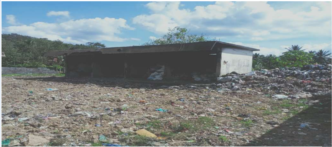
തികഞ്ഞിനശിച്ച MCF കെട്ടിടം-നിലവിലും ശരിയായ സംവിധാനമില്ലാതെ മാലിന്യങ്ങൾ ഇവിടെയാണ് ശേഖരിച്ച് തരം തിരിക്കുന്നത്

കൃത്യമായ അഗ്നിസുരക്ഷാമാർഗ്ഗങ്ങൾ ഇല്ലാത്തതിനാൽ തന്നെ 26.08.23 ന് MCF ൽ തീപിടുത്തം ഉണ്ടാവുകയും അതിനെ തുടർന്ന് അഗ്നിശമനവിഭാഗം ഉൾപ്പെടെ വന്ന് തീയണക്കുകയും ചെയ്തു.ഇതിനെ തുടർന്ന് പോലീസ് കേസ് നിലനിൽക്കുകയും ചെയ്യുന്നു.