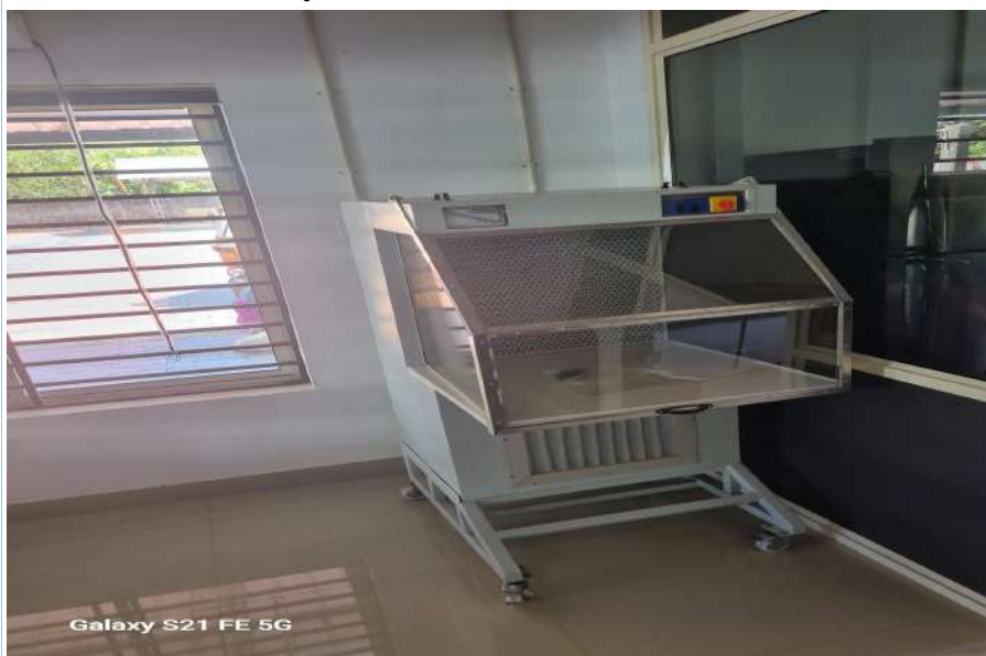
ഇതുവരെ ഉപയോഗിച്ചിട്ടില്ലാത്ത Laminar Airflow Cabinet

06/03/2023 തീയതിയിൽ വെറ്ററിനറി സർജൻ, നൂൽപ്പഴ ഗ്രാമപഞ്ചായത്ത് സെക്രട്ടറിക്ക് അയച്ച കത്ത് പ്രകാരം, 2021-22 വർഷം, പ്രോജക്ട് നം.S0055/22 പ്രകാരം വാങ്ങിയ ലാബ് റീഫ്ലജന്റ്സ് (ഹ്യൂമൺ റീഫ്ലജന്റ്സ്) ആവശ്യകതയോ, ഉപയോഗമോ വരുന്നില്ലാത്തതിനാൽ, ലാബ് റീഫ്ലജന്റ്സ് എക്സ്പയറി കഴിയുവാൻ ഏതാനും മാസങ്ങൾ മാത്രമേ ഉള്ളൂ എന്നത് തുടർനടപടിക്കായി സമർപ്പിച്ചിട്ടുണ്ട്. ഭരണസമിതി തീരുമാന (നം. 14/4/06.03.2023) പ്രകാരം, 2021-22 വർഷം, വാങ്ങിയ ലാബ് റീഫ്ലജന്റ്സ് (ഹ്യൂമൺ റീഫ്ലജന്റ്സ്) ഇപ്പോൾ ആവശ്യമില്ല എന്നുള്ള സാഹചര്യത്തിൽ ഈ ഇനങ്ങൾ മെഡിക്കൽ ഓഫീസർ എഫ്.എച്ച്.സി ക്ക് കൈമാറുന്നതിന് വെറ്ററിനറി സർജൻ, നൂൽപ്പഴ ഗ്രാമപഞ്ചായത്തിനെ ചുമതലപ്പെടുത്തി തീരുമാനിച്ചിട്ടുണ്ട്. എന്നാൽ, മെഡിക്കൽ ഓഫീസർ (എഫ്.എച്ച്.സി) യുടെ ആവശ്യകത അന്വേഷിക്കാതെ ആണ് ഭരണസമിതി തീരുമാനമെടുത്തിരിക്കുന്നത്. വെറ്ററിനറി സർജൻ, മെഡിക്കൽ ഓഫീസർ (FHC) യുമായി ഫോണിൽ സംസാരിച്ചതിൽ നിന്നും ലാബിലെ ഉപകരണങ്ങളിൽ ഉപയോഗിക്കാൻ പറ്റുന്നവയല്ല എന്നറിയിക്കുകയും വെറ്ററിനറി സർജന് ആയത് ഭരണസമിതിയെയും സെക്രട്ടറിയെയും അറിയിക്കുകയും ചെയ്തിട്ടുണ്ട്.