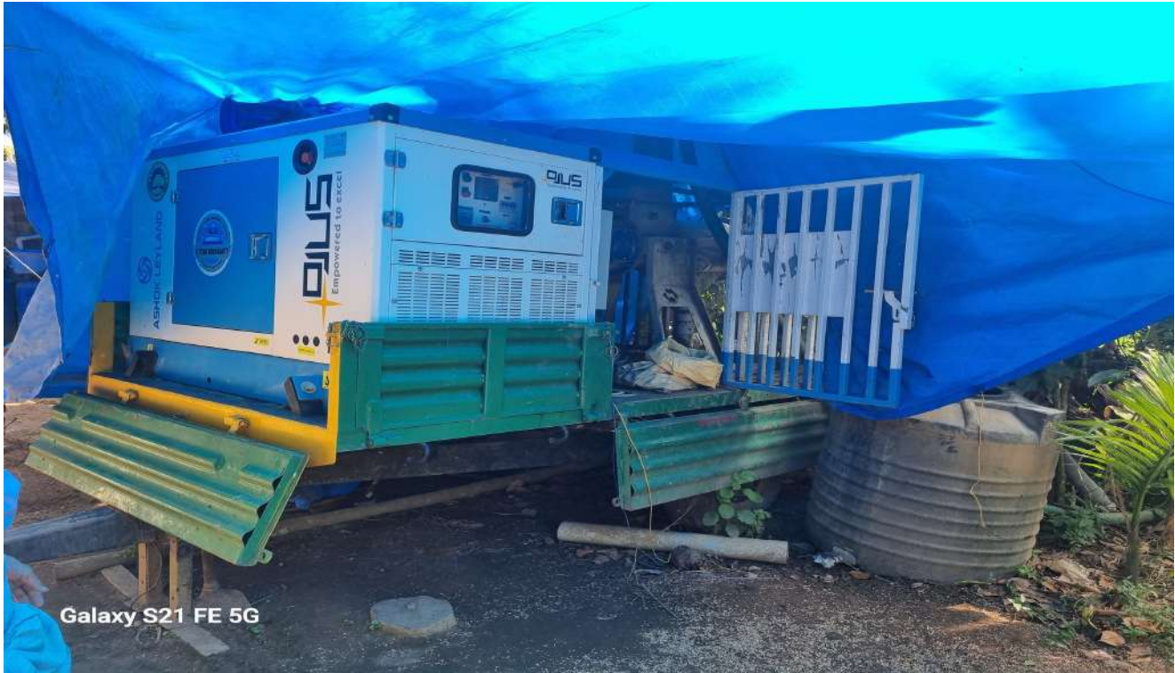
Galaxy S21 FE 5G