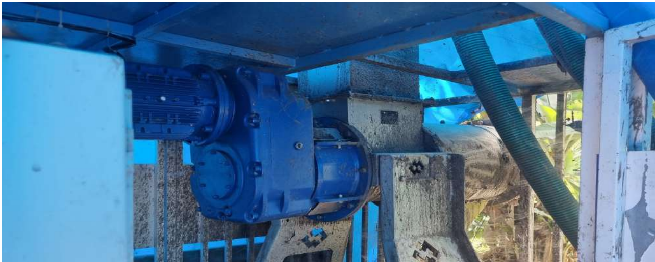
ചാണക ഉണക്ക് യന്ത്രം ഉപയോഗിക്കാനാവാതെ തുരുമ്പെടുത്ത് കിടക്കുന്ന നിലവിലെ അവസ്ഥ..