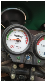
നഗരസഭ വാങ്ങിയ ഇലക്ട്രിക് ഓട്ടോറിക്ഷ ഉപയോഗിക്കാതെ സൂക്ഷിച്ചിരിക്കുന്നു