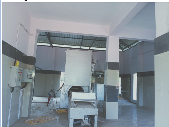
പണി തീരാത്ത കെട്ടിടത്തിൽ സ്ഥാപിച്ച ഉപകരണങ്ങൾ

കെട്ടിട നിർമ്മാണം പൂർത്തിയാക്കാതെയാണ് ഉപകരണങ്ങൾ സ്ഥാപിച്ചിട്ടുള്ളത്. കെട്ടിടനിർമ്മാണം പൂർത്തീകരിക്കാതെ ഉപകരണങ്ങൾ വാങ്ങിയതിനാൽ നിലവിലും ക്രിമിറ്റോറിയം പാതിവഴിയിലാണ്.ഉപകരണങ്ങൾ വാങ്ങുന്നതുമായി ബന്ധപ്പെട്ട പർച്ചേസിംഗ് കമ്മിറ്റി തീരുമാനം,സ്ഥാപനവുമായി വെച്ച എഗ്രിമെന്റ് എന്നിവ ഓഡിറ്റിന് ഹാജരാക്കിയിട്ടില്ല.സ്റ്റീൽ ഇൻഡസ്ട്രീസ് കേരള ലിമിറ്റഡ് സമർപ്പിച്ച രേഖകൾ പ്രകാരം 14.03.23 നാണ് ഉപകരണങ്ങൾ സ്ഥാപിച്ചതിന്റെ അളവുകൾ രേഖപ്പെടുത്തിയത്.പ്രവൃത്തി പൂർത്തീകരിച്ച് പദ്ധതി പ്രവർത്തനക്ഷമമാകുന്നതിന് മുൻപ് സെക്യൂരിറ്റി ഡെപ്പോസിറ്റ് ഒഴികെ മുഴുവൻ തുകയും അനുവദിക്കുകയാണുണ്ടായത്.