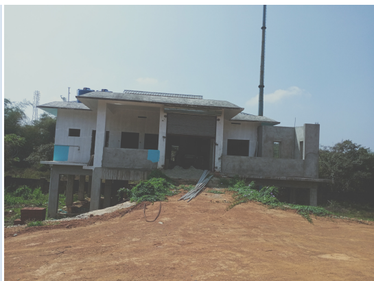
പണി തീരാത്ത ക്രിമിറ്റോറിയം കെട്ടിടം

പദ്ധതി നാളിതവരെയും പൂർത്തീകരിക്കാത്തതിനാൽ തൻവർഷത്തെ ചെലവ് 1538752 ഓഡിറ്റിൽ തടസ്സപ്പെടുത്തുന്നു.